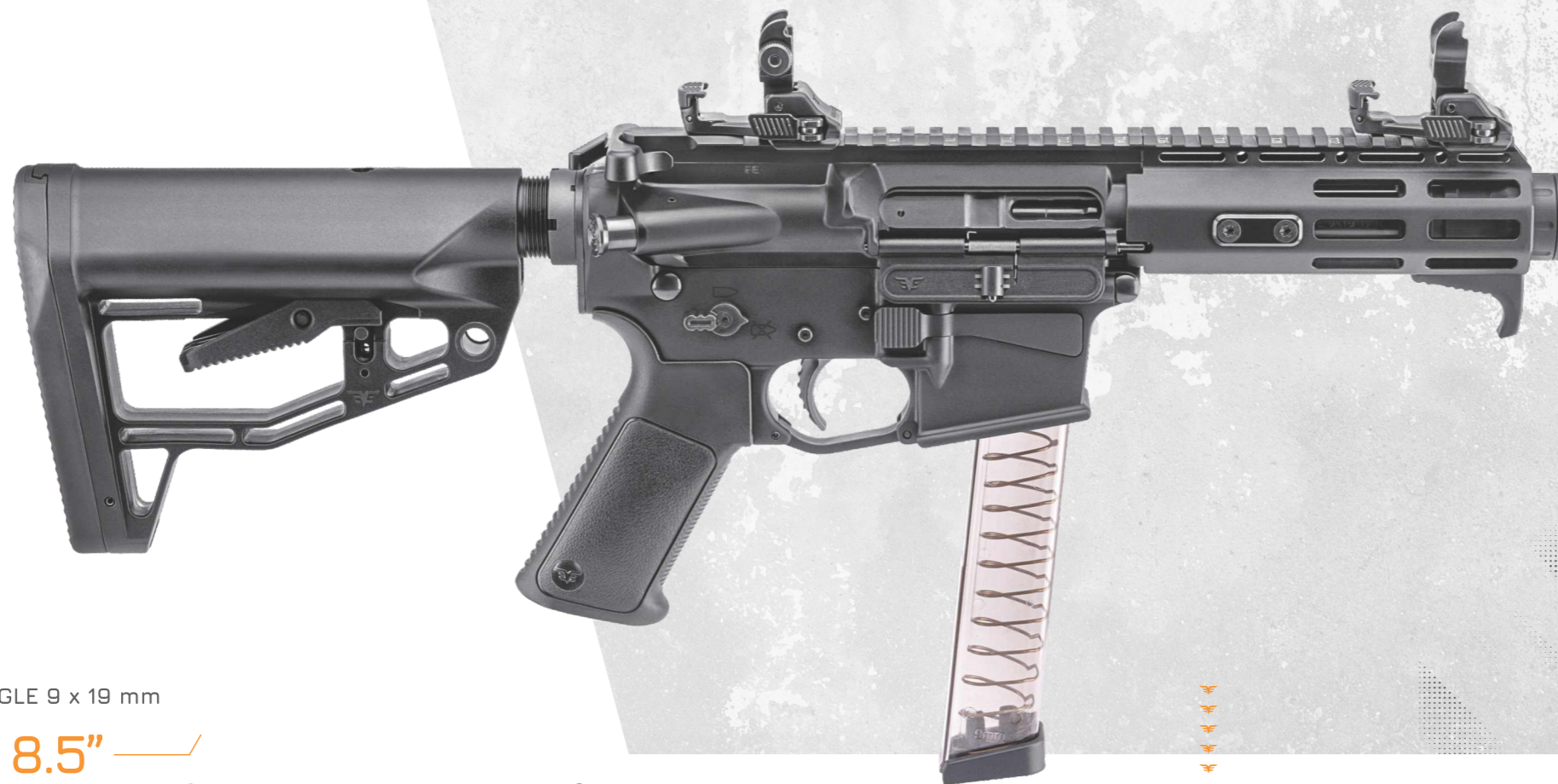
CARABINA FIRE EAGLE 9 x 19 mm > BLOWBACK