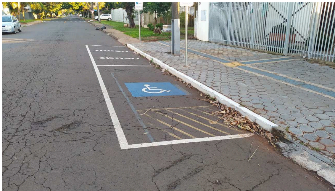
Figura 3 – demarcações existentes em frente ao imóvel a serem refeitas

As demarcações existentes deverão ser pintadas na cor do asfalto, antes da execução das novas demarcações.