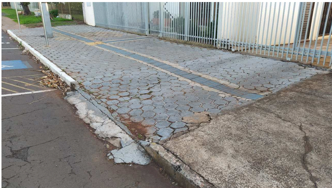
Figura 1 – piso em bloco sextavado a ser demolido

O passeio público será demolido, com a remoção dos blocos sextavados de concreto existentes. Após a demolição, será executado piso de concreto armado com acabamento polido e piso podotátil, além da execução de uma nova rampa de acesso para PCR, também em concreto, conforme projeto.