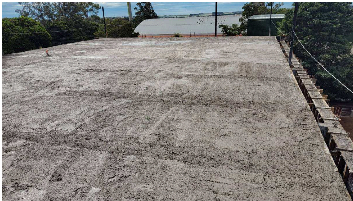
Figura 3 – Vista da laje da cobertura.