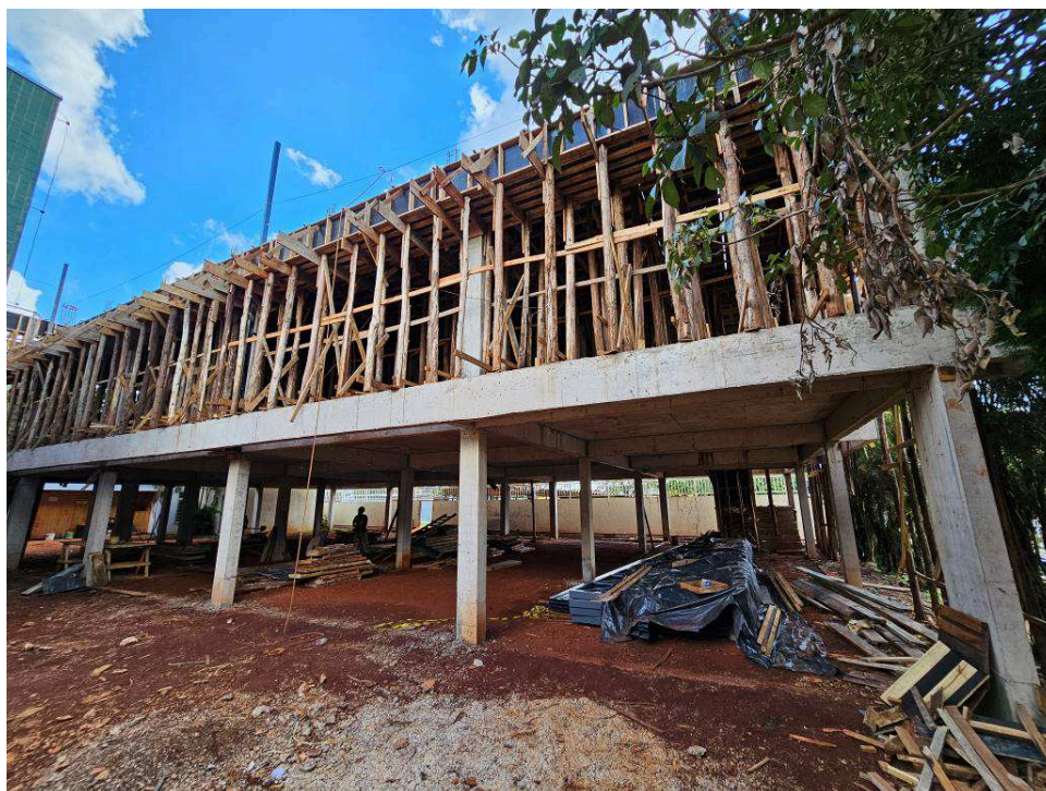
Figura 2 – Vista da laje da cobertura - formas.