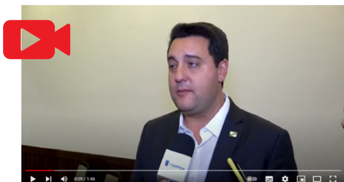
O governador do Paraná, Carlos Massa Ratinho Junior