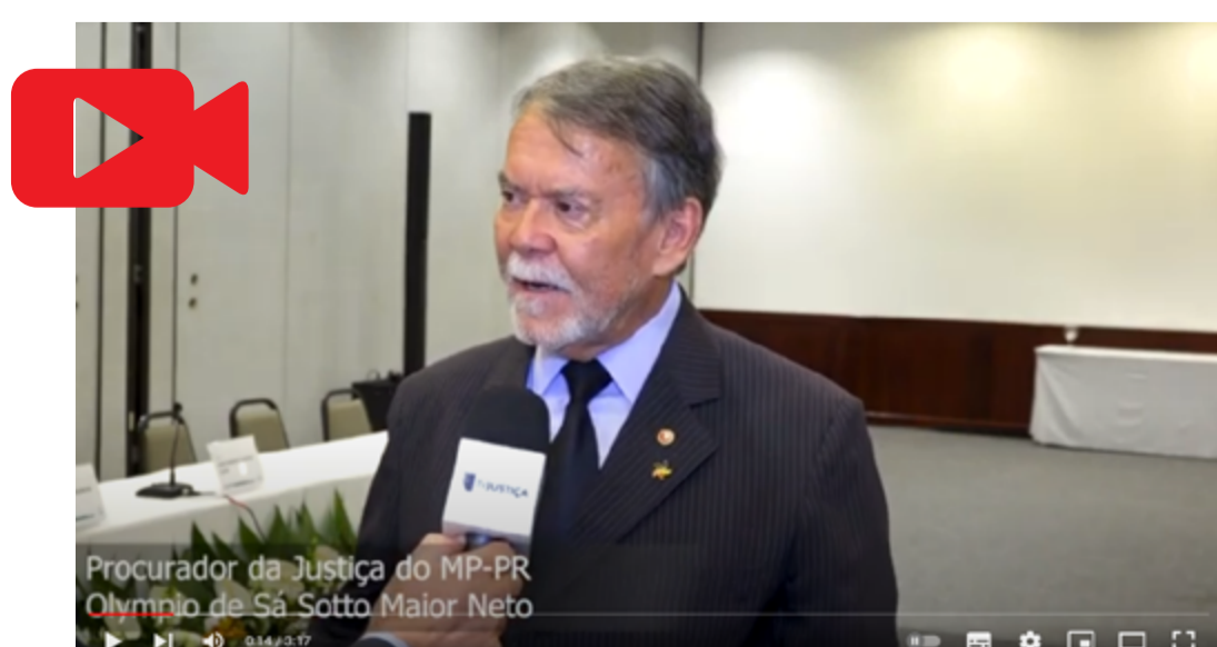
O procurador de Justiça do Ministério Público do Paraná, Olympio de Sá Sotto Maior Neto