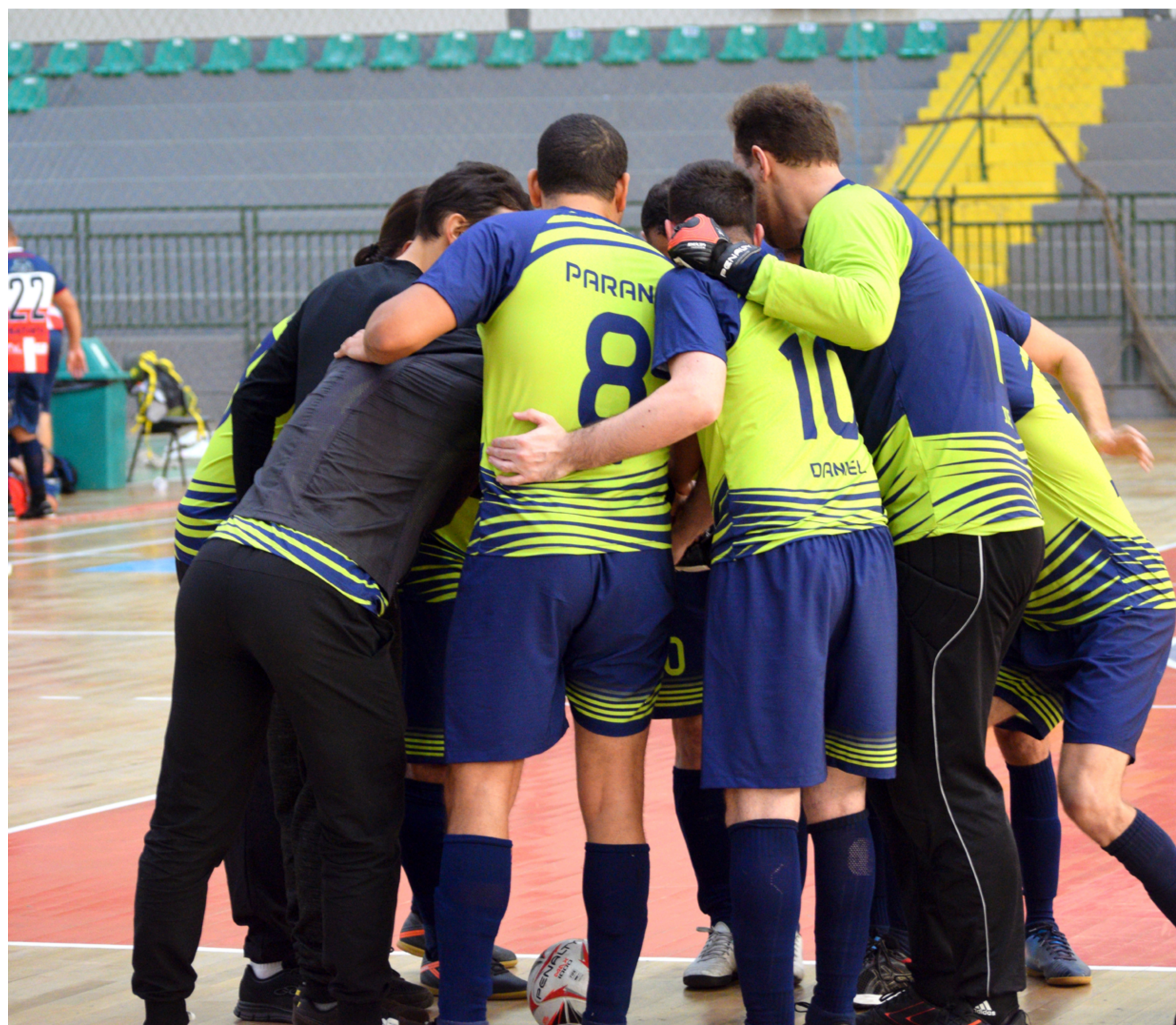
Time de futsal que representou o Paraná na última edição dos jogos (2022), em Blumenau

Os atletas da delegação paranaense serão dispensados do serviço nos dias do evento, sem compensação, mediante concordância da chefia imediata e comprovação da efetiva participação.