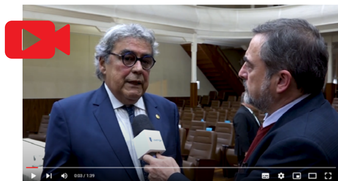
Vice-presidente do TST, ministro Aloysio Corrêa da Veiga

Confira os detalhes do seminário neste link e ouça as entrevistas abaixo: