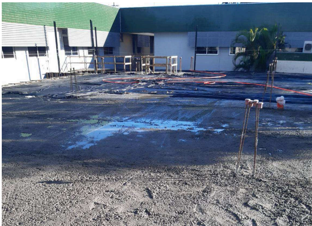
Figura 2 – Vista do 1º pavimento concretado.