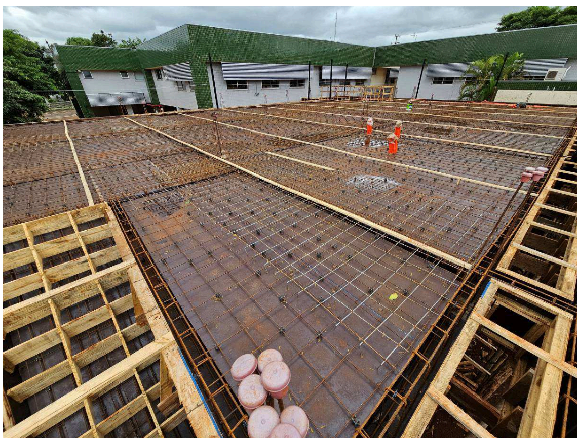
Figura 1 – Vista das formas e armaduras das vigas e lajes do 1º pavimento.

Conforme o cronograma contratual deveria ter sido executado 8,33% do item 01 (Administração de obra), 7,57% do item 02 (Instalação do Canteiro de Obras), 8,75% do item 03 (Ampliação do Fórum Trabalhista), 0,00% do item 04 (Reforma do Fórum – Edificação Existente), 0,00% do item 05 (Serviços Externos - Estacionamento e Passeio Público), 0,00% do item 06 (Limpeza Final), 2,08% do item 07 (Instalações Elétricas), 0,62% do item 08 (Instalações de Rede Lógica, Sonorização e Alarme), e 0,00% do item 09 (Sistema de Proteção Contra Descargas Atmosféricas). Porém, a Contratada executou 8,33% do item 01, 10,27% do item 02, 8,75% do item 03, 0,00% do item 04, 28,67% do item 05, 0,00% do item 06, 0,00% do item 07, 0,00% do item 08, e 0,00% do item 09.