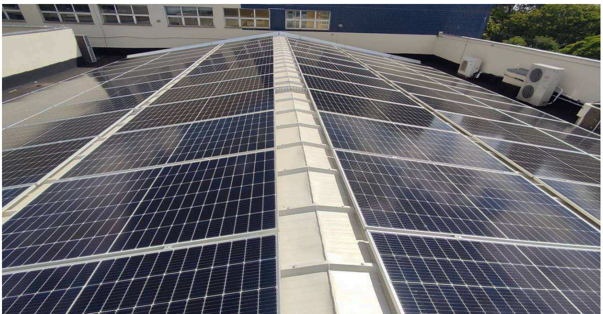
Figuras 02 – Cobertura com placas instaladas – Fórum lado esquerdo