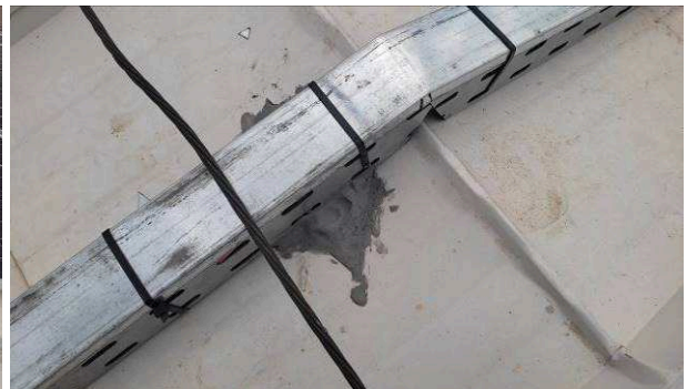
Figuras 01 – Cobertura com placas instaladas - Setorial