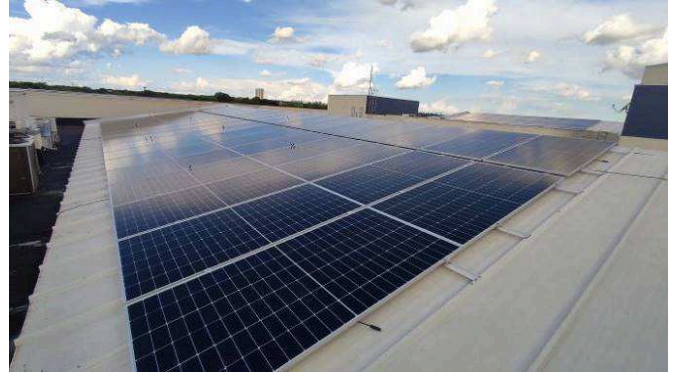
Figuras 03 – Cobertura com placas instaladas – Fórum lado direito