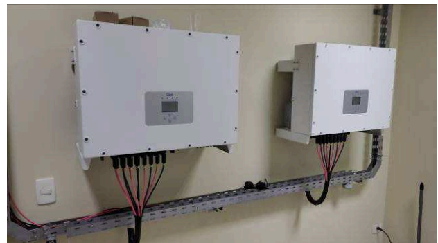
Figuras 04 – Inversores e proteções