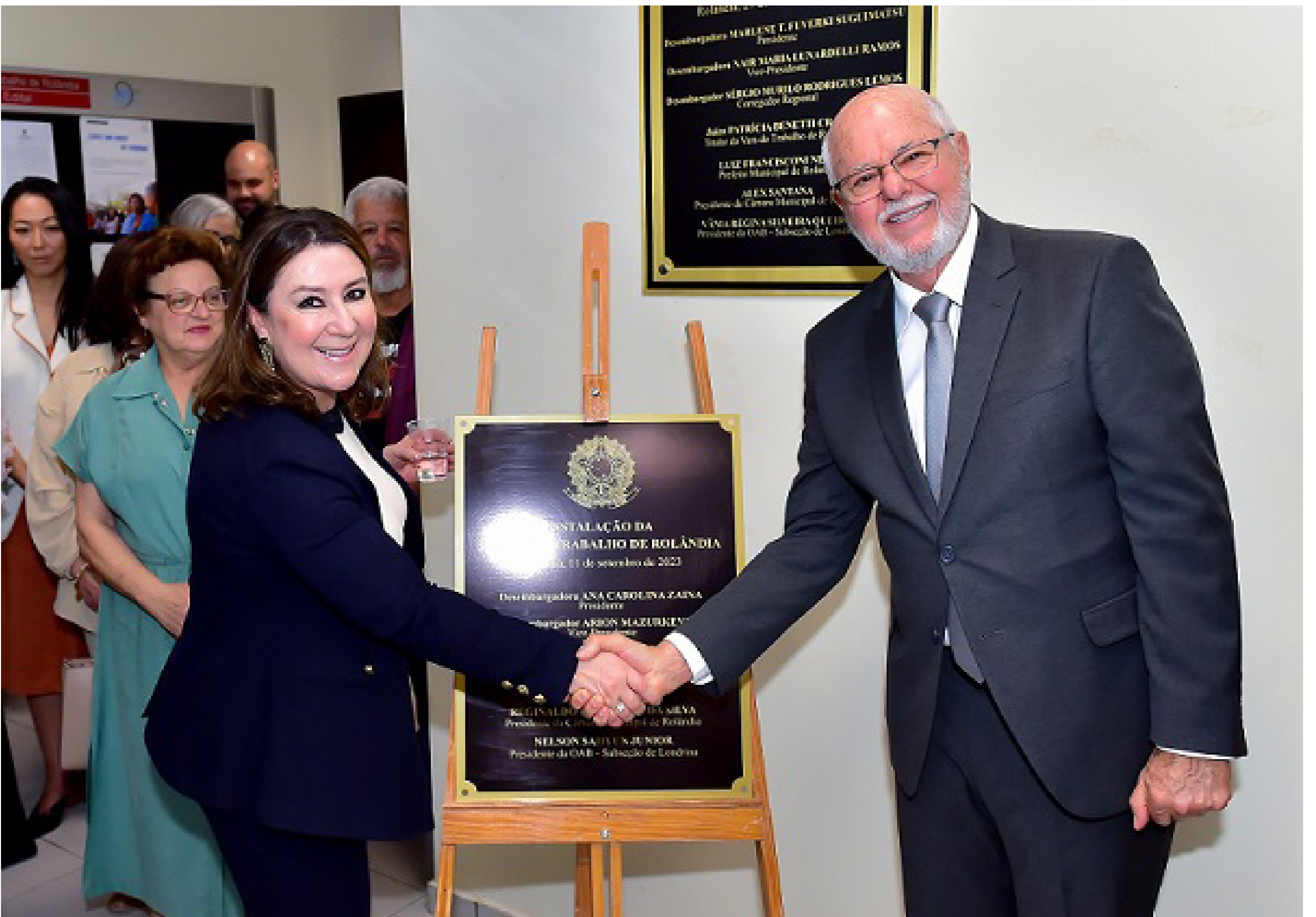
Trinta anos após a instalação da unidade pioneira, Rolândia recebe sua segunda Vara do Trabalho