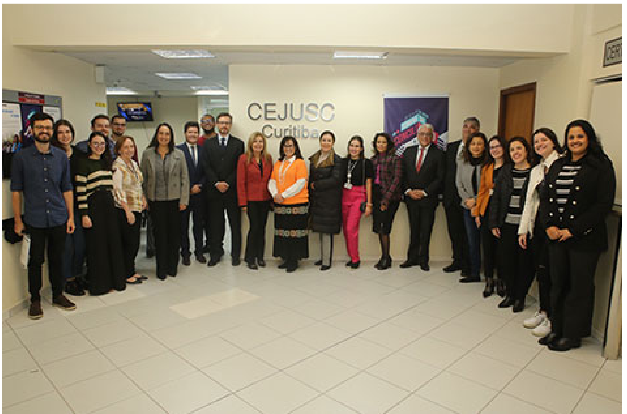
Semana Nacional da Conciliação no TRT-PR é concluída com resultado histórico

Tanto em 2022 como em 2023, o tribunal alcançou a primeira colocação na VII Semana Nacional de Conciliação . Na última edição, o TRT paranaense rompeu, inclusive a barreira do médio porte, com desempenho já na faixa dos tribunais de grande porte.