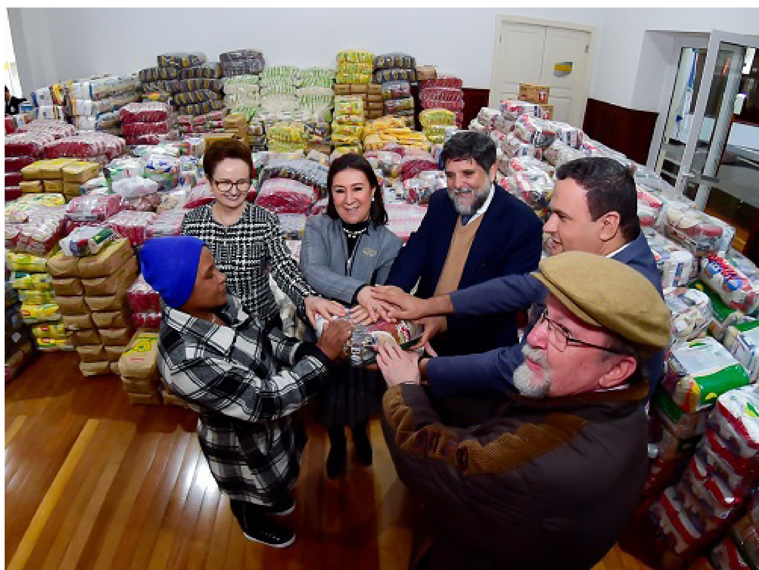
39 toneladas de alimentos foram arrecadadas até o momento na campanha Alimente a Solidariedade

As tradicionais campanhas de arrecadação de alimentos, doces de Páscoa, Cestas de Natal e agasalhos atingiram resultados recordes, com destaque para a campanha que, em Agosto de 2022, arrecadou mais de 40 toneladas de alimentos, durante a semana de correição no tribunal.