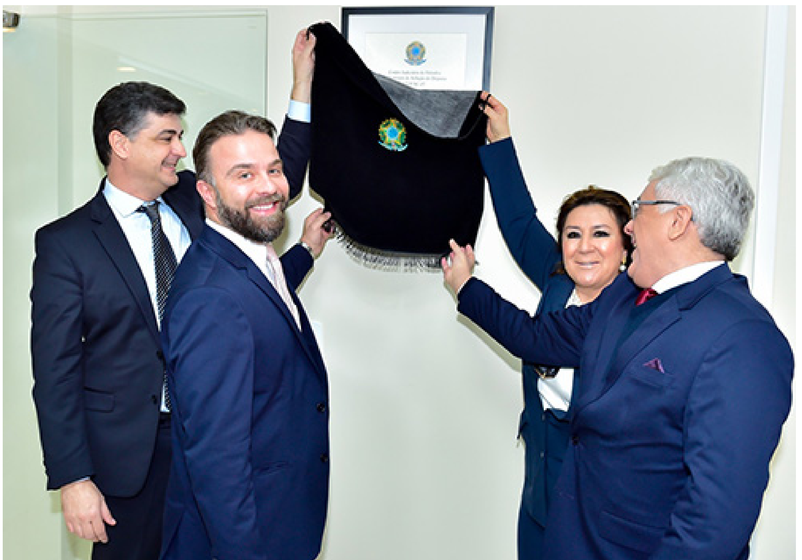
Justiça do Trabalho inaugura Centro de Conciliação no Fórum Trabalhista de Londrina