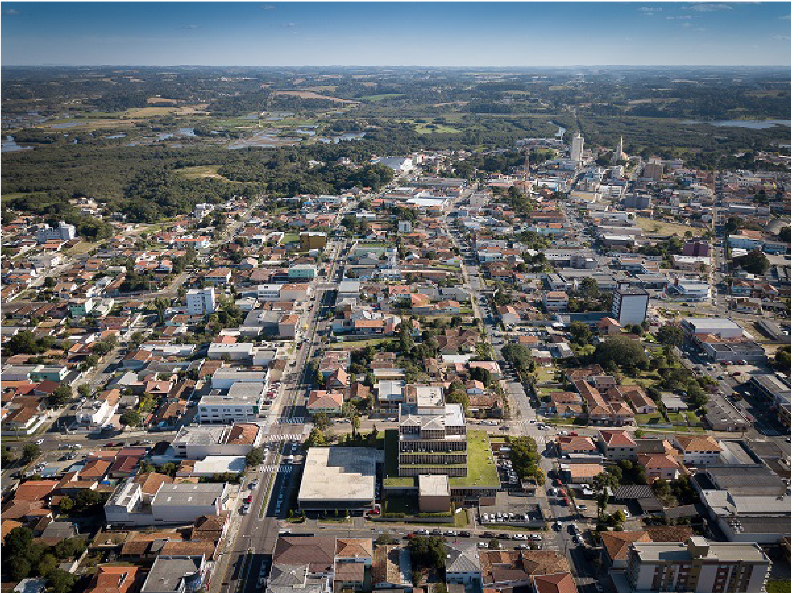
Tribunal aprova novas varas do trabalho em Araucária e Rolândia