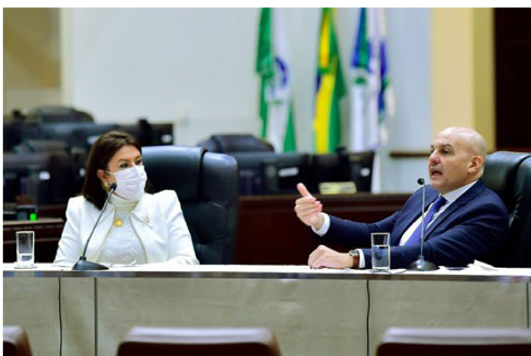
Congresso no TRT-PR reúne tendências contemporâneas da execução na Justiça do Trabalho