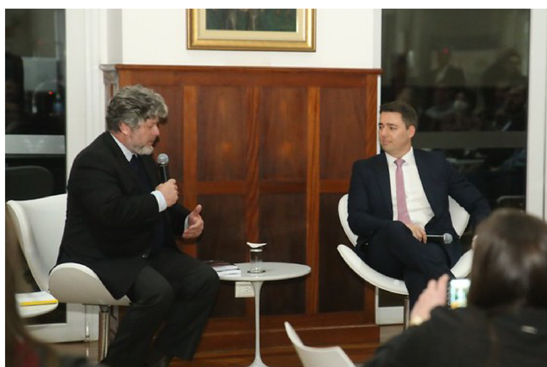
Diálogos com a Magistratura mostra estudo sobre a relevância da Justiça do Trabalho na última década