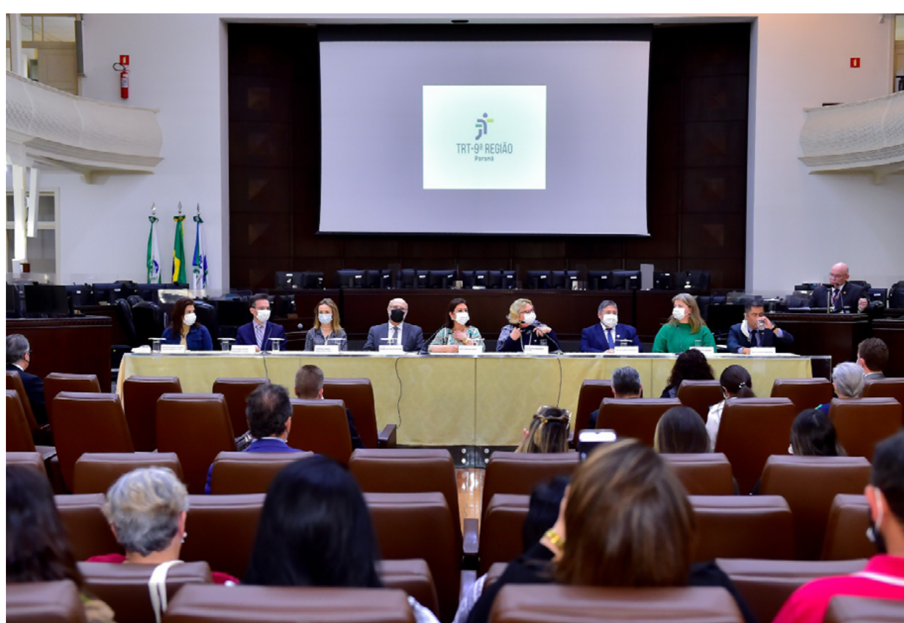
Seminário no TRT-PR reforça expectativa de que mobilização proteja a aprendizagem profissional