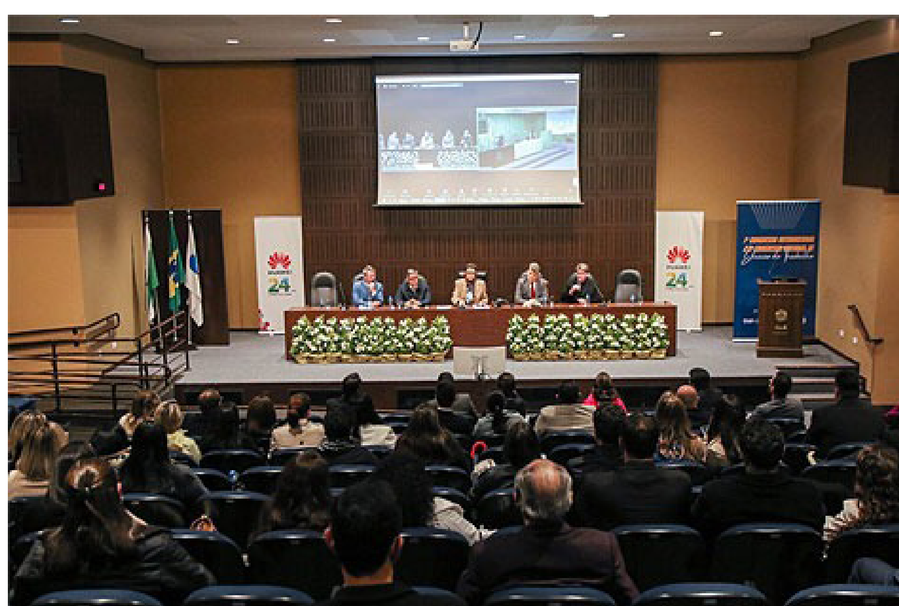
Congresso Internacional expõe as contradições das novas tecnologias no mundo do trabalho