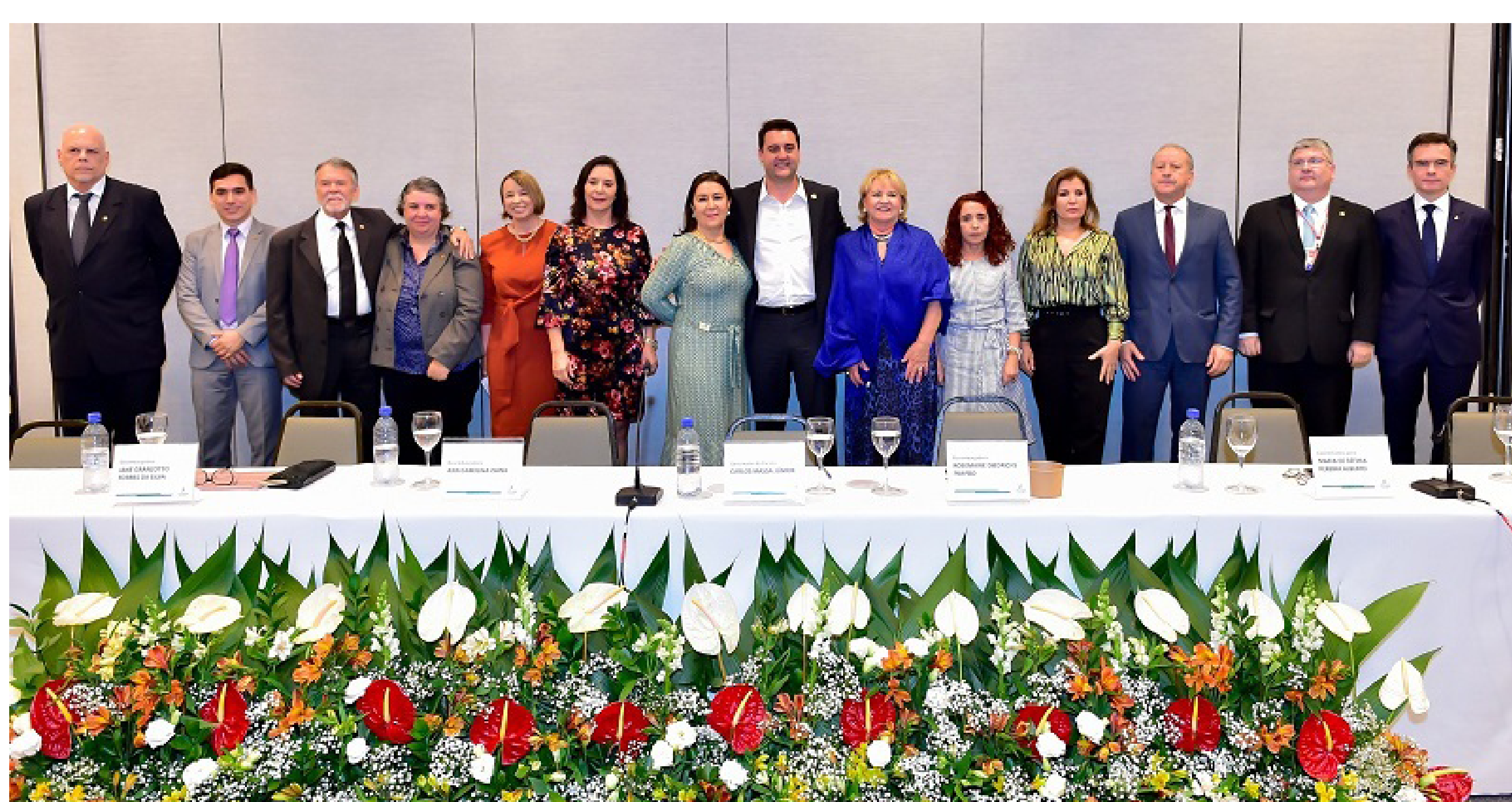
Seminário aponta medidas concretas para erradicação do trabalho infantil e estímulo à aprendizagem