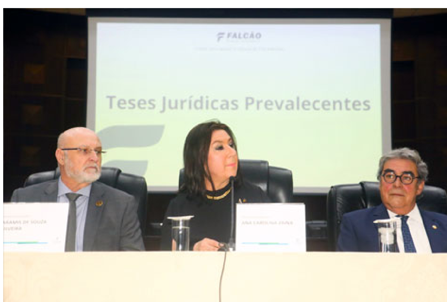
Com mais de 300 participantes, seminário no TRT-PR ajuda a fortalecer a cultura dos precedentes