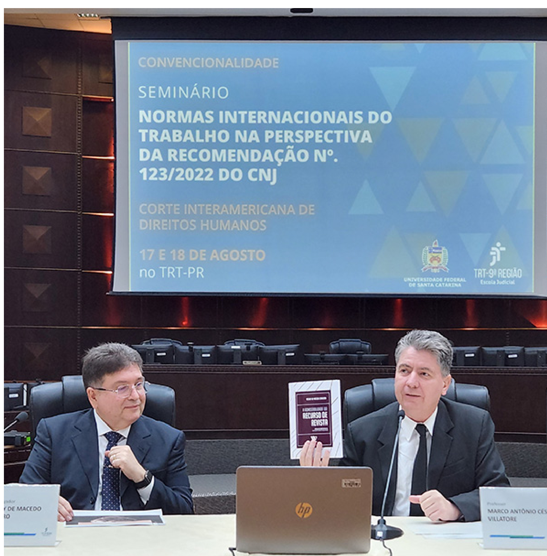
Seminário esclarece aplicação de tratados internacionais e direitos humanos na Justiça do Trabalho