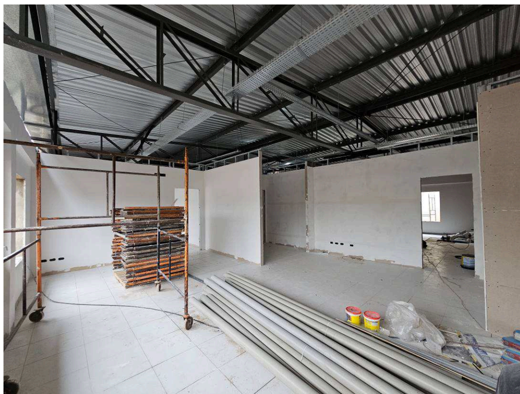
Figura 3 – Vista Interna – edifício frontal.