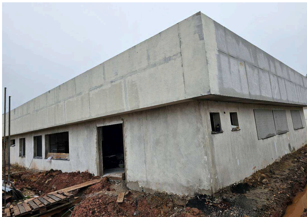
Figura 1 – Fachada externa – edifício frontal.

07 (Esquadrias), 14,46% do item 08 (Cobertura), 0,00% do item 09 (Impermeabilização e tratamentos), 9,12% do item 10 (Revestimentos internos), 8,93% do item 11 (Revestimentos externos), 23,46% do item 12 (Pisos internos/externos), 7,07% do item 13 (Rodapés, soleiras e peitoris), 9,61% do item 14 (Instalações hidrossanitárias), 36,90% do item 15 (Climatização), 0,00% do item 16 (Instalações de prevenção contra incêndios), 28,23% do item 17 (Paisagismo e serviços externos), 48,46% do item 18 (Pinturas), 0,00% do item 19 (Serviços complementares), 0,00% do item 20 (Limpeza da obra), 11,73% do item 21 (Instalações elétricas), 12,52% do item 22 (Instalações lógicas, CFTV, telefonia e alarme), e 8,20% do item 23 (1º Termo Aditivo). Porém, a Contratada executou 9,90% do item 01, 3,91% do item 02, 0,00% do item 03, 0,00% do item 04, 0,00% do item 05, 39,84% do item 06, 0,00% do item 07, 8,10% do item 08, 0,00% do item 09, 0,00% do item 10, 8,93% do item 11, 19,55% do item 12, 5,98% do item 13, 2,42% do item 14, 36,90% do item 15, 0,00% do item 16, 0,00% do item 17, 9,67% do item 18, 0,00% do item 19, 0,00% do item 20, 0,82% do item 21, 2,30% do item 22, e 6,37% do item 23.