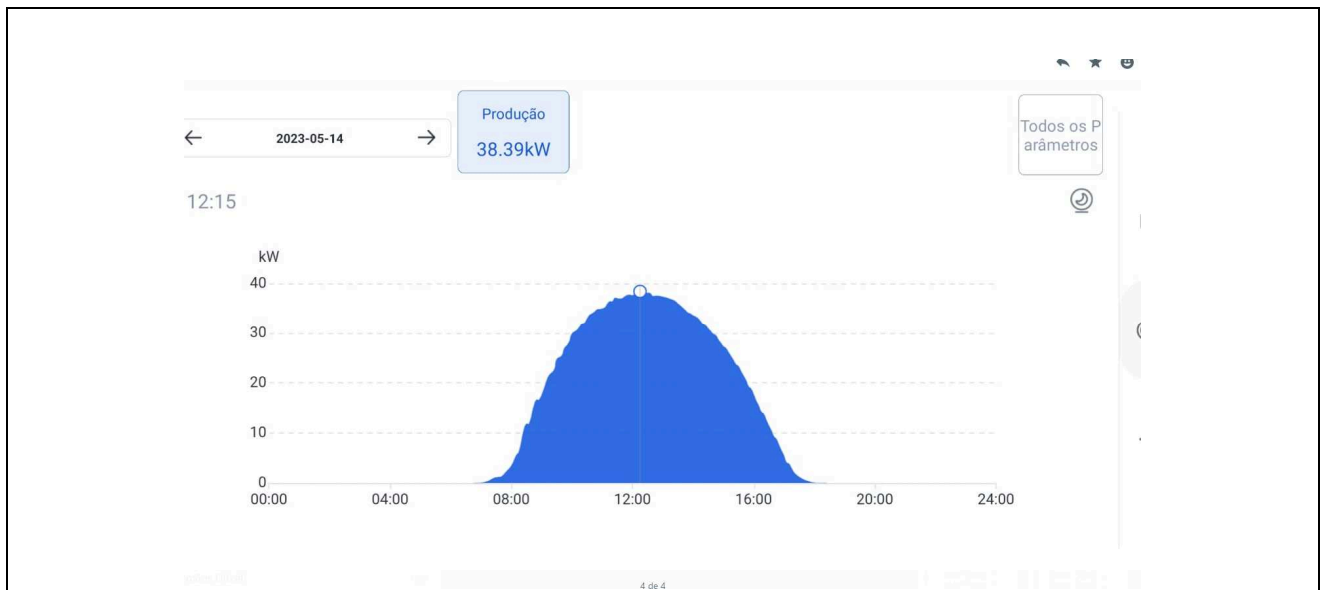
Figura 01 – Gráfico de geração do dia 14/05/23 (aplicativo Solarman) - Cascavel

Nesta etapa a contratada finalizou os ajustes nas usinas fotovoltaicas de Cascavel e Toledo, e o comissionamento das instalações foi realizado pela fiscalização do TRT. As usinas encontram-se em pleno funcionamento conforme informações obtidas através do aplicativo de gerenciamento Solarman.