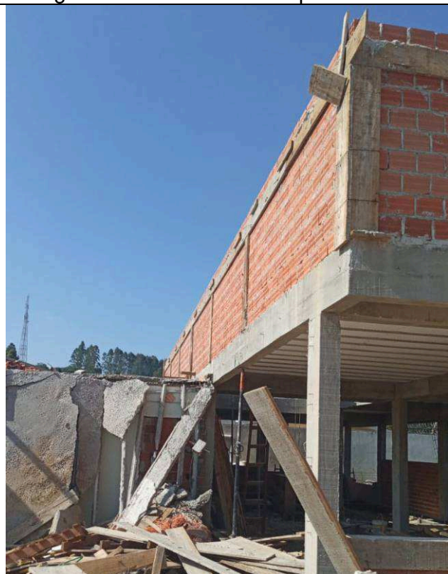
Figura 09: Alvenarias das platibandas.