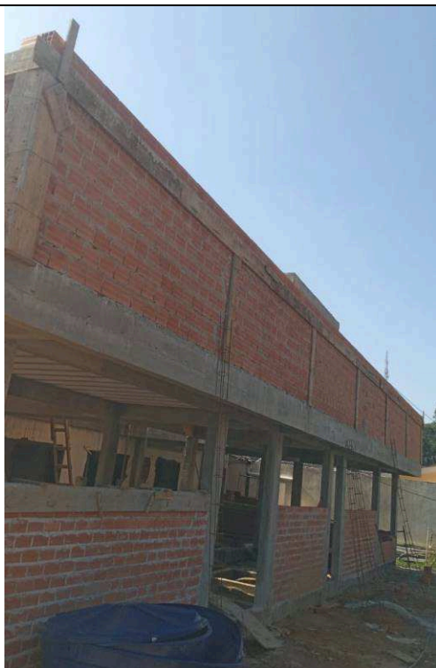
Figura 07: Alvenarias das platibandas.