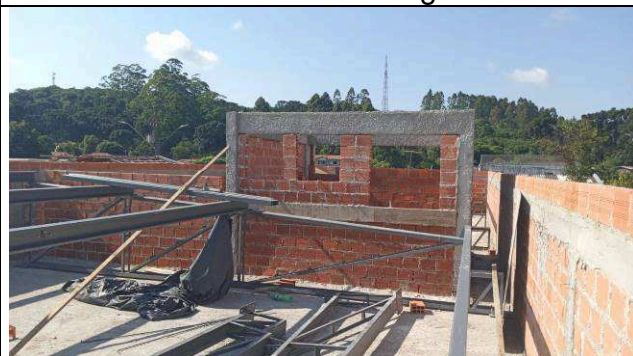
Figura 14: Estrutura metálica de cobertura - ampliação.