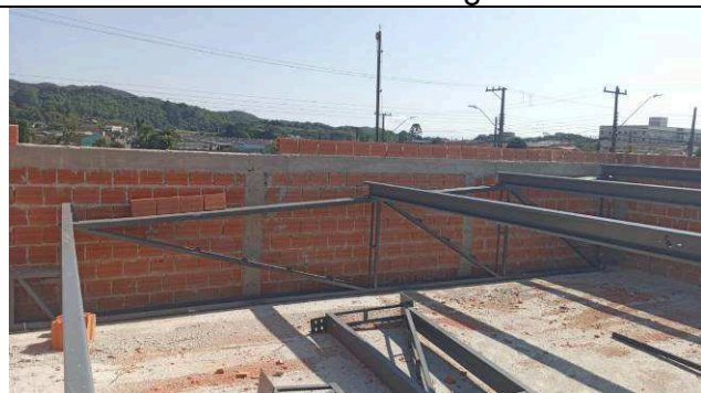
Figura 13: Estrutura metálica de cobertura - ampliação.