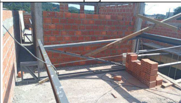
Figura 18: Estrutura metálica de cobertura - ampliação.