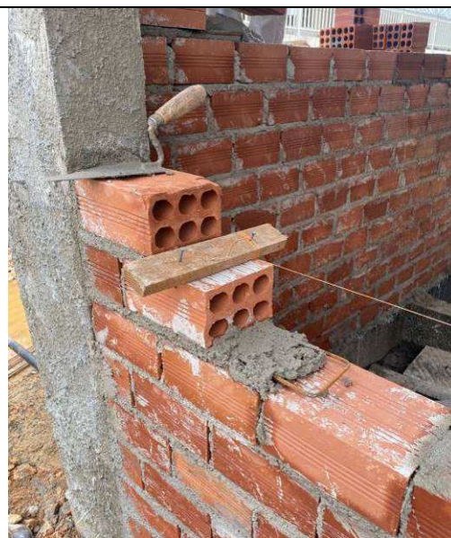
Figura 02: Alvenarias externas – detalhe de amarração com ferro-cabelo.