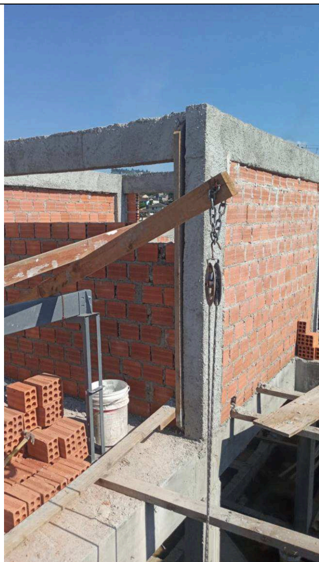
Figura 11: Alvenarias do volume dos reservatórios de água.