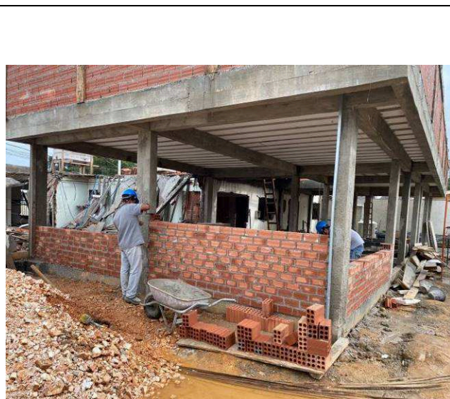
Figura 01: Alvenarias externas – ampliação.