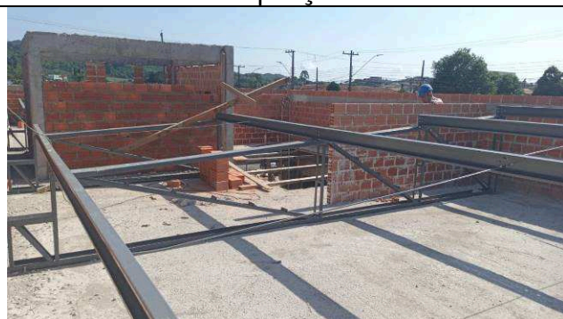
Figura 17: Estrutura metálica de cobertura - ampliação.