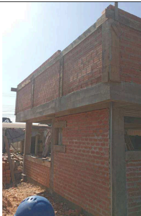
Figura 08: Alvenarias das platibandas.