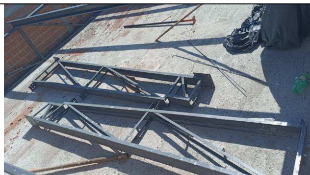
Figura 15: Estrutura metálica de cobertura - ampliação.