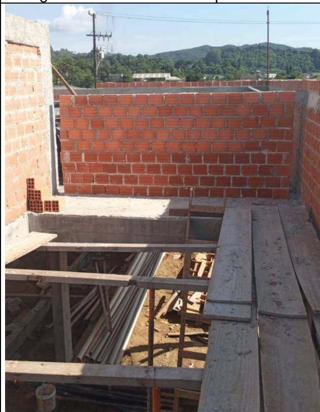
Figura 10: Alvenarias das platibandas.