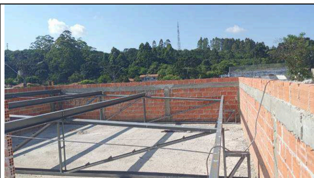
Figura 16: Estrutura metálica de cobertura - ampliação.