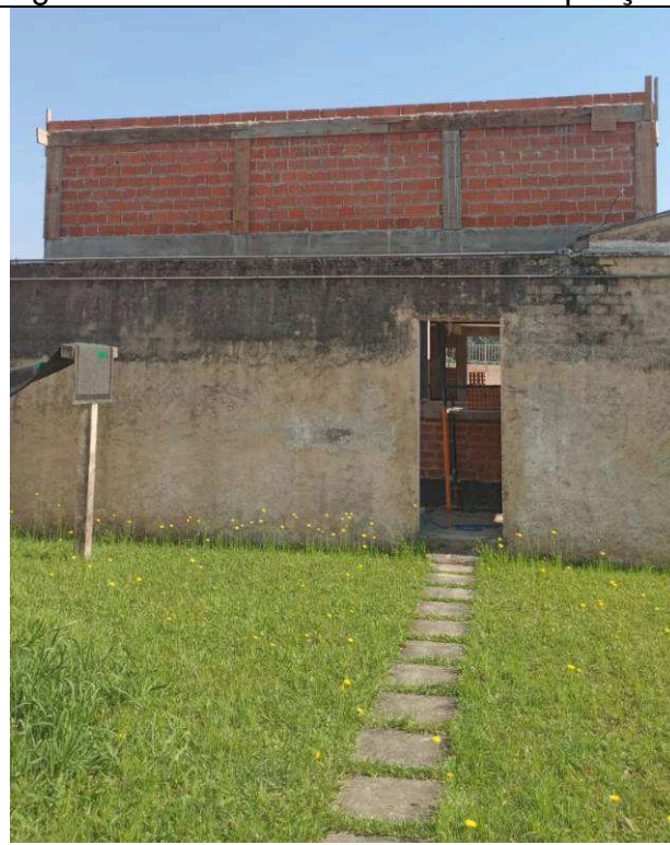
Figura 05: Alvenarias externas – ampliação.