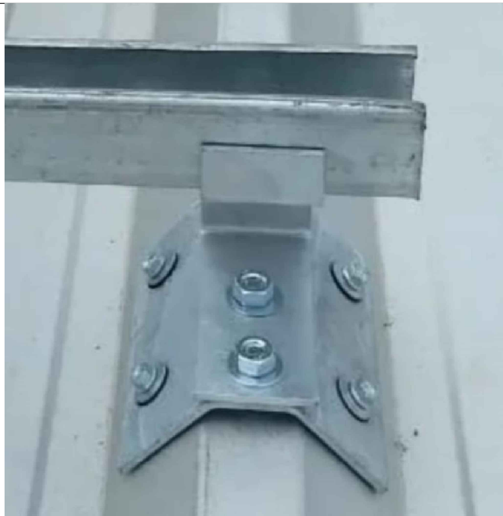
DETALHE DE FIXAÇÃO