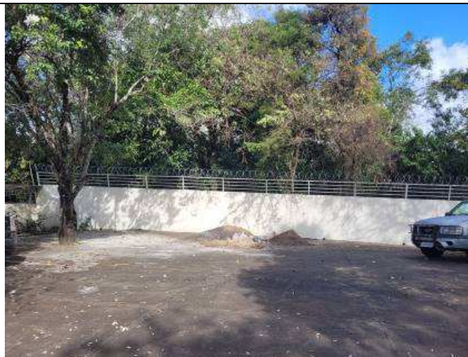
Figura 01: Pintura muros fundos