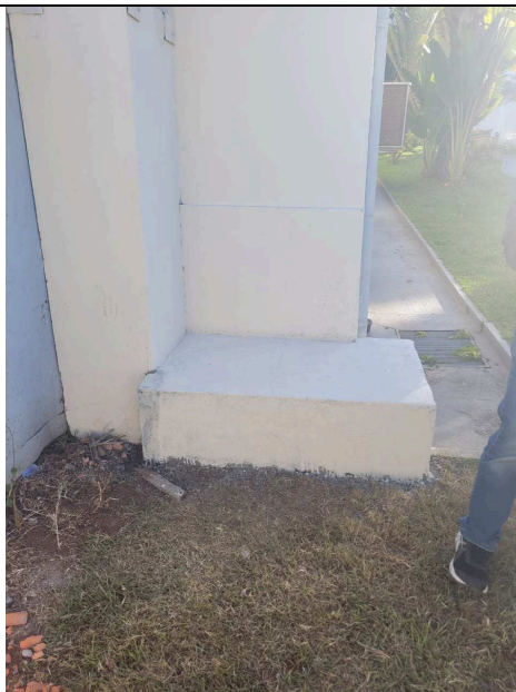
Figura 05: Base da cisterna de reuso