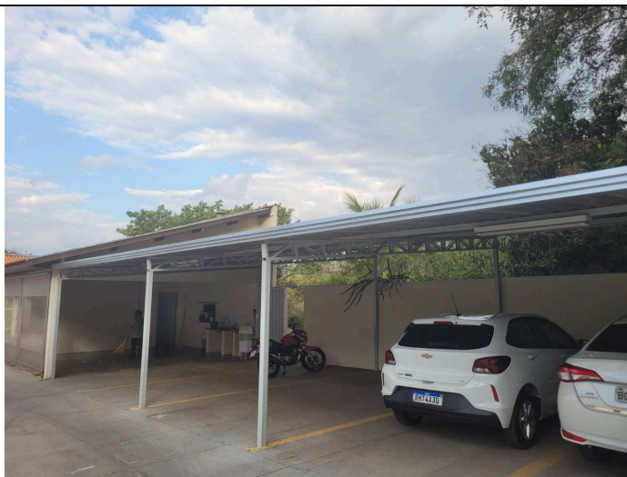
Figuras 04: Pintura estrutura do estacionamento