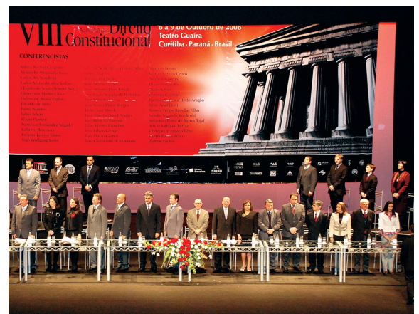
Magistrados do TRT do Paraná participaram do Simpósio

O presidente de honra da Academia, Dalmo de Abreu Dallari, foi responsável pela outorga do título de membro catedrático ao ministro aposentado do Supremo Tribunal Federal Sepúlveda Pertence. Na oportunidade, o magistrado proferiu palestra sobre o processo de democratização e confirmação das garantias constitucionais por que passou o Brasil nos últimos 20 anos. ■