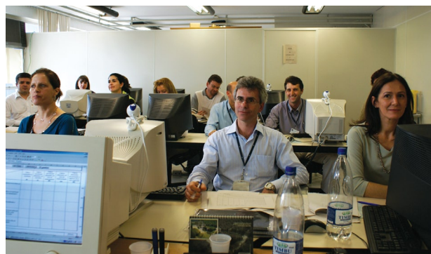
Gespública: servidores da Justiça do Trabalho da 9ª Região efetuam nova avaliação da Gestão do TRT do Paraná em outubro

No instrumento de 250 pontos, no qual o Tribunal Regional do Trabalho foi avaliado, por exemplo, verifica-se a gestão sob sete aspectos: liderança; estratégias e planos; cidadãos e sociedade; informação e conhecimento; pessoas; processos (procedimentos); e resultados. ■