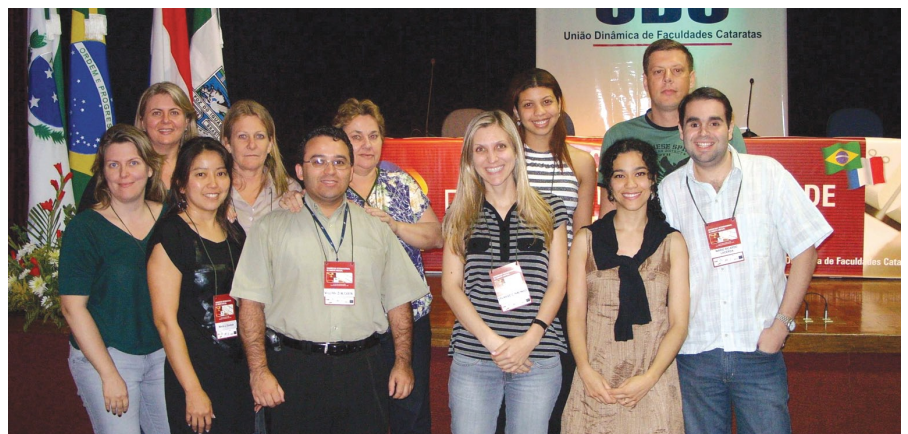
Servidores da Justiça do Trabalho de Foz do Iguaçu participaram do Congresso Internacional de Direito Virtual

do Trabalho, Distribuição de Feitos de Primeiro Grau e oficiais de justiça. ■