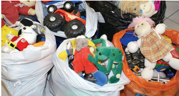
A campanha do Dia das Crianças, da Comissão de Responsabilidade Social, arrecadou 439 livros e 533 brinquedos