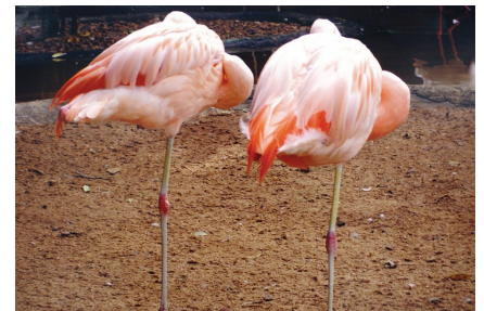
Uma das fotos da exposição

A mostra permanecerá até 14 de novembro no hall de entrada do Fórum de Primeiro Grau de Curitiba (Av. Vicente Machado, 400). Poderá ser vista pelo público externo, das 12 às 18 horas, de segunda a sexta-feira. O projeto “Prata da Casa” visa a incentivar a produção artística e cultural de magistrados e servidores da Justiça do Trabalho do Paraná. Outras informações: (41) 3310-7309. ■