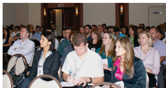
Diretores de secretaria e oficiais de justiça durante a abertura dos encontros, no dia 27 de outubro