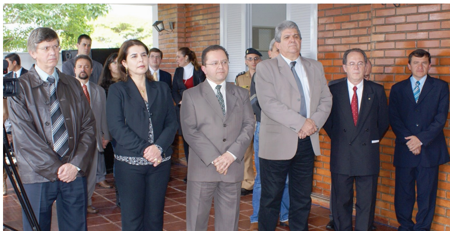
Magistrados e autoridades de Ibaiti durante a instalação do Posto de Atendimento da Justiça do Trabalho naquele município, em 2 de outubro