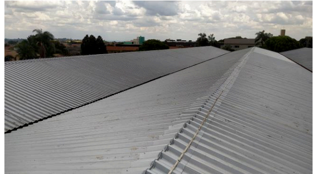
Figura 04C: Vista superior do local de instalação das telhas sobre a setorial