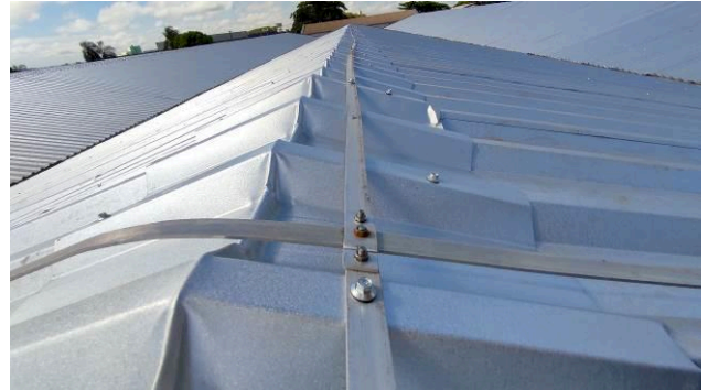
Figura 04E: Sistema de Proteção Contra Descargas Atmosféricas reinstalado – fitas alumínio, captadores, parafusos.