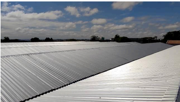
Figura 07E: Sistema de Proteção Contra Descargas Atmosféricas reinstalado – visão geral.