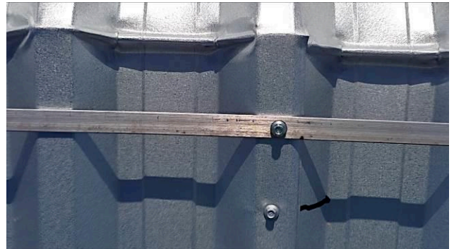
Figura 02E: Sistema de Proteção Contra Descargas Atmosféricas reinstalado – fitas alumínio, captadores, parafusos.