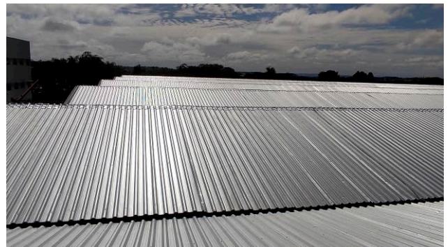
Figura 08E: Sistema de Proteção Contra Descargas Atmosféricas reinstalado – visão geral.