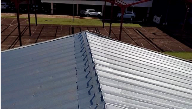
Figura 03E: Sistema de Proteção Contra Descargas Atmosféricas reinstalado – fitas alumínio, captadores, parafusos.