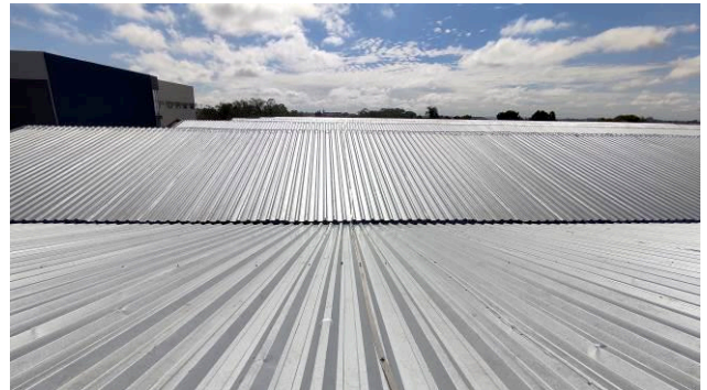
Figura 06E: Sistema de Proteção Contra Descargas Atmosféricas reinstalado – visão geral.