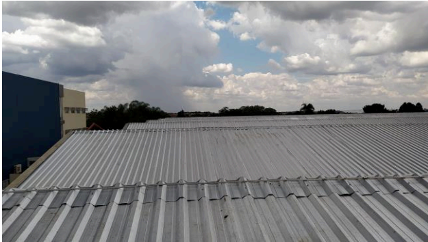
Figura 03C: Vista superior do local de instalação das telhas sobre o estacionamento e setorial