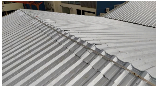
Figura 06C: Detalhe da fixação das goivas