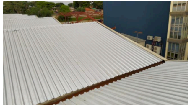
Figura 02C: Vista superior do local de instalação as telhas sobre o estacionamento