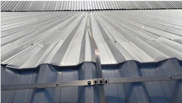
Figura 05E: Sistema de Proteção Contra Descargas Atmosféricas reinstalado – fitas alumínio, captadores, parafusos.