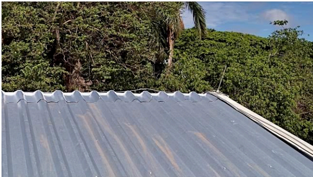
Figura 01E: Sistema de Proteção Contra Descargas Atmosféricas reinstalado – fitas alumínio, captadores, parafusos.