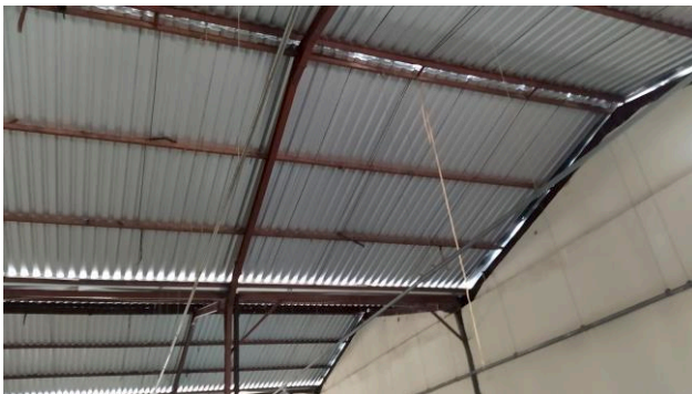
Figura 01C: Vista inferior do local de instalação das telhas do estacionamento