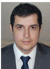
..... Paulo Roberto Fernandes

AGRAVO DE INSTRUMENTO EM RECURSO DE REVISTA. ACÓRDÃO PUBLICADO NA VIGÊNCIA DA LEI Nº 13.015/2014. VÍNCULO DE EMPREGO. MANICURE. Caracterizada uma potencial ofensa ao art. 3º da CLT, dá-se provimento ao agravo de instrumento para determinar o prosseguimento do recurso de revista. Agravo de instrumento provido. RECURSO DE REVISTA. VÍNCULO DE EMPREGO. MANICURE. O ganho de comissões no percentual de 60% dos serviços prestados revela-se totalmente incompatível com a relação empregatícia, ao passo