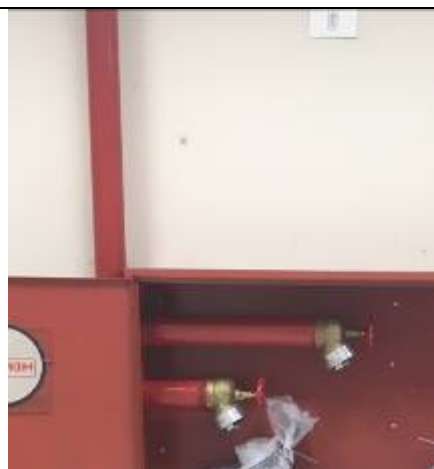
Figura 10: Pintura tubulação de incêndio.