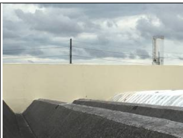
Figura 07: Pintura parede de compartimentação, sobre cobertura.