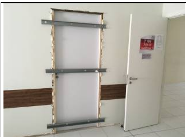
Figura 01: Abertura de vão para instalação de porta.