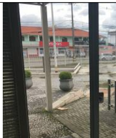
Figura 06: Painel de vidro fixo instalado.