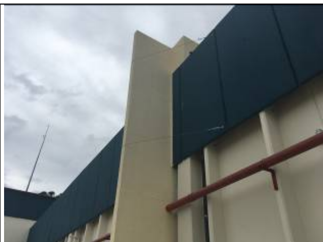
Figura 09: Pintura parede de compartimentação, aba fundos.