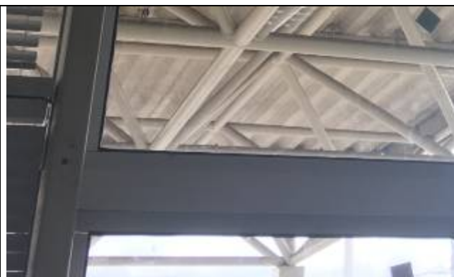
Figura 05: Caixilho fixo instalado.