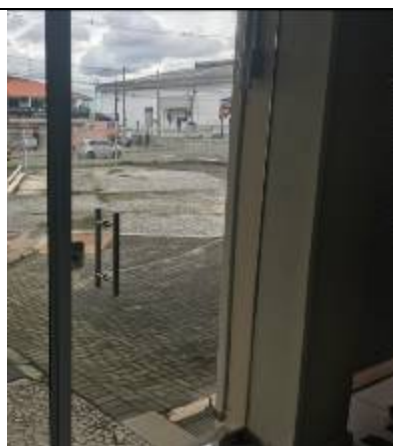
Figura 04: Porta de vidro temperado instalada.