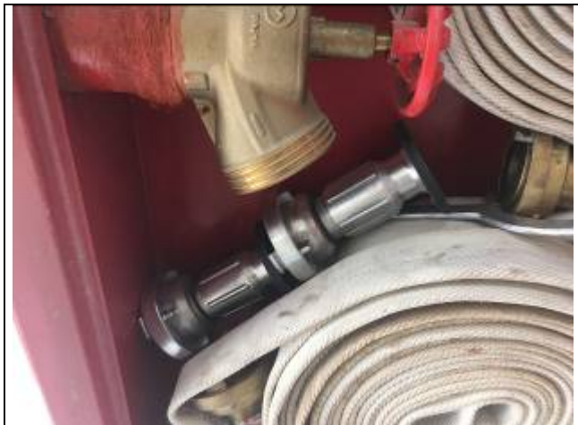
Figura 02: Fornecimento de Esguichos reguláveis para os hidrantes existentes.