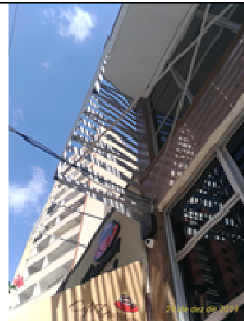
Figura 22: Estrutura e brise.