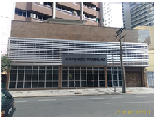
Figura 23: Fachada pronta.