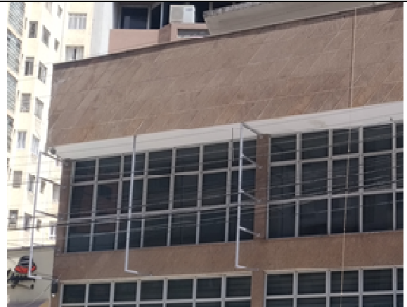
Figura 10: Fixação das estruturas.