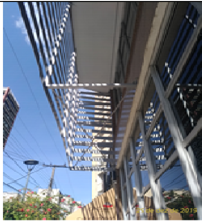
Figura 19: Estrutura e brise.

FISCALIZAÇÃO DE OBRAS - FORNECIMENTO E INSTALAÇÃO DE ESTRUTURA METÁLICA E BRISES DO IMÓVEL 147 DO TRIBUNAL REGIONAL DO TRABALHO DO PARANÁ