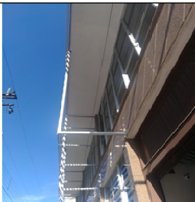
Figura 11: Estrutura em aço para apoio