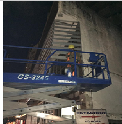
Figura 04: Utilização de andaime tipo plataforma aérea.