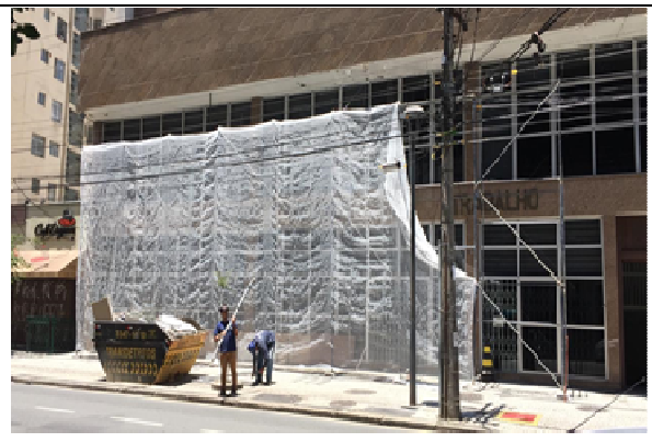
Figura 02: Instalação de tela para trabalho em marquise.