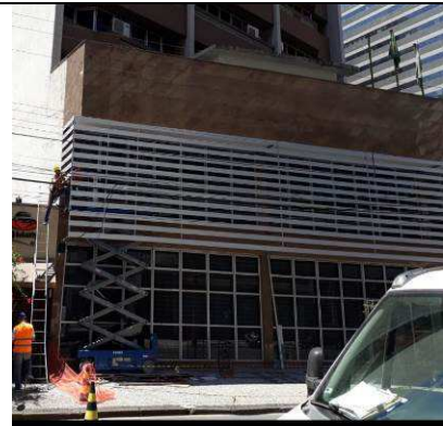
Figura 16: Instalação aletas em alumínio na lateral