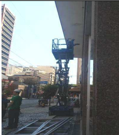
Figura 09: Início dos serviços.