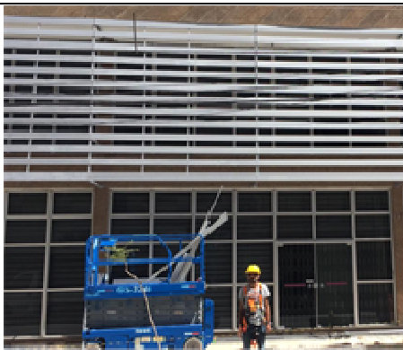
Figura 05: Utilização de andaime tipo plataforma aérea.