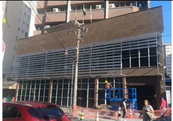
Figura 14: Instalação aletas em alumínio.