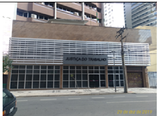
Figura 28: Placa e letreiro.