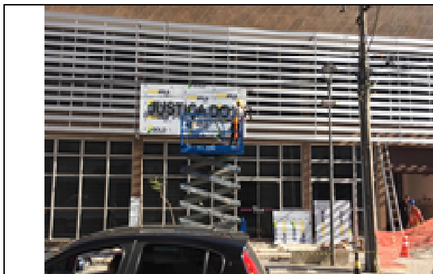
Figura 27: Placa para instalação de letreiro.