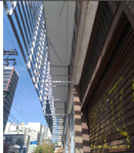
Figura 26: Pintura marquise e estruturas