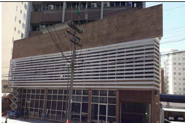
Figura 17: Instalação aletas em alumínio