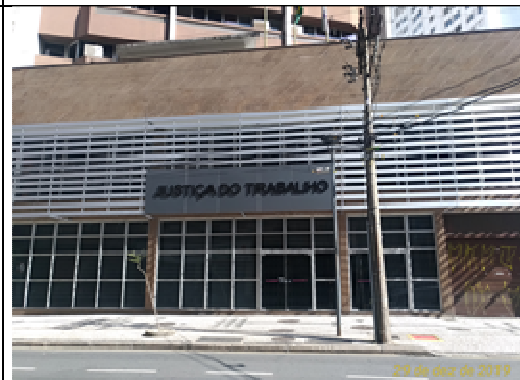
Figura 24: Fachada pronta