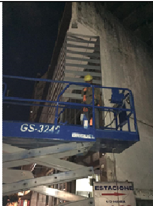
Figura 15: Instalação aletas em alumínio na lateral