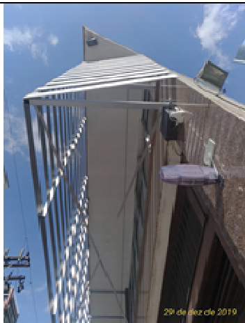
Figura 21: Estrutura e brise.