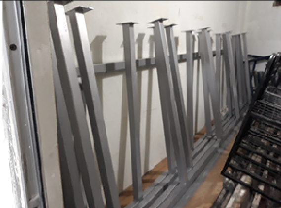
Figura 07: Estrutura em aço para apoio

FISCALIZAÇÃO DE OBRAS - FORNECIMENTO E INSTALAÇÃO DE ESTRUTURA METÁLICA E BRISES DO IMÓVEL 147 DO TRIBUNAL REGIONAL DO TRABALHO DO PARANÁ