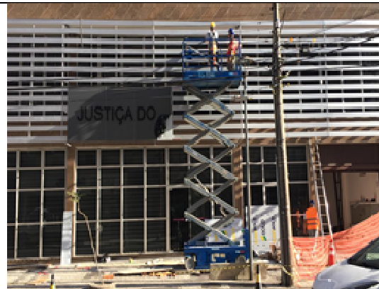
Figura 06: Utilização de andaime tipo plataforma aérea.