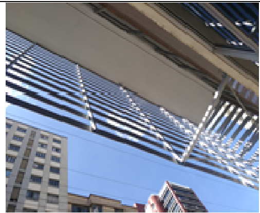
Figura 20: Estrutura e brise.