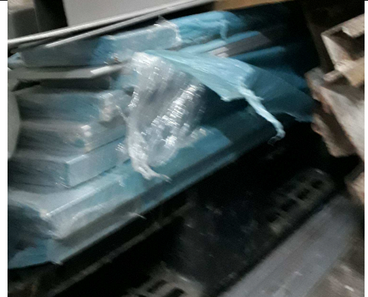
Figura 08: Aletas brises.