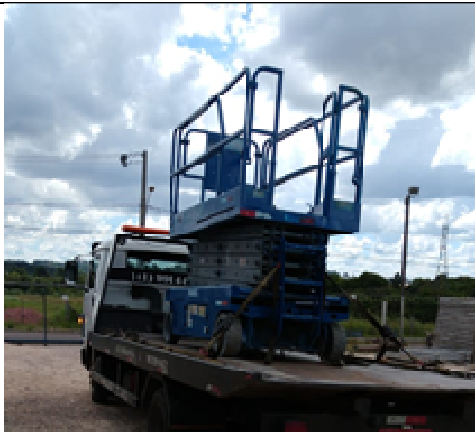
Figura 03: Locação de andaimes.

FISCALIZAÇÃO DE OBRAS - FORNECIMENTO E INSTALAÇÃO DE ESTRUTURA METÁLICA E BRISES DO IMÓVEL 147 DO TRIBUNAL REGIONAL DO TRABALHO DO PARANÁ