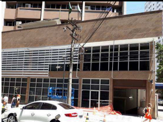
Figura 13: Instalação das aletas.

FISCALIZAÇÃO DE OBRAS - FORNECIMENTO E INSTALAÇÃO DE ESTRUTURA METÁLICA E BRISES DO IMÓVEL 147 DO TRIBUNAL REGIONAL DO TRABALHO DO PARANÁ