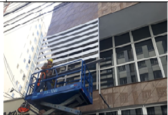
Figura 12: Colocação aletas