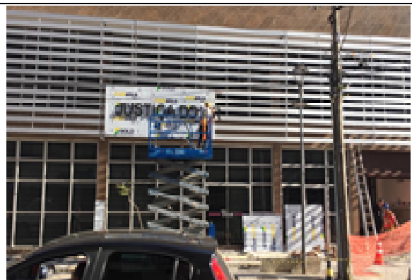
Figura 18: Instalação de placa e letreiro.