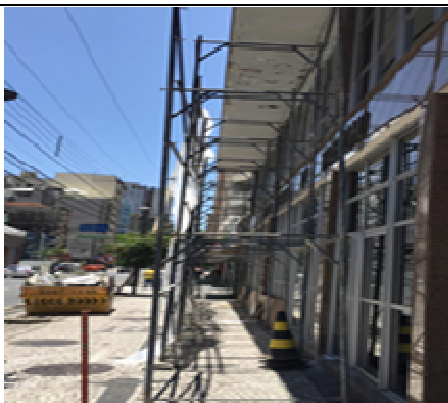
Figura 01: Estrutura andaimes para trabalho em marquise.