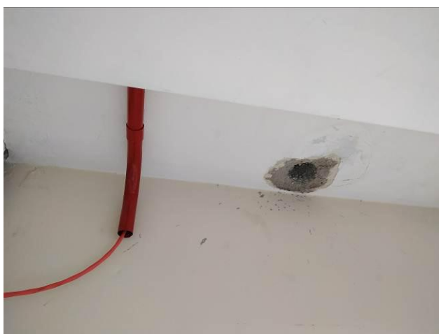
Figura 07: Perfuração em laje de concreto