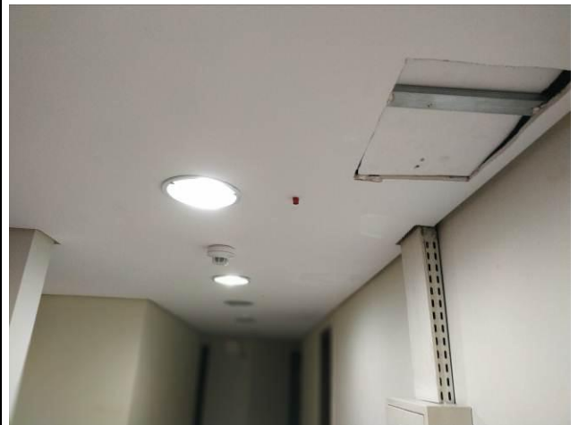
Figura 16 - Detector e indicador visual de acionamento de detector acima do forno