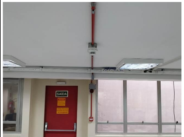
Figura 12: Detector óptico de fumaça, acionador manual e avisador audiovisual