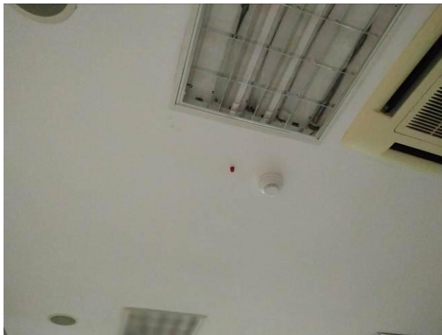
Figura 15 - Detector e indicador visual de acionamento de detector acima do forno