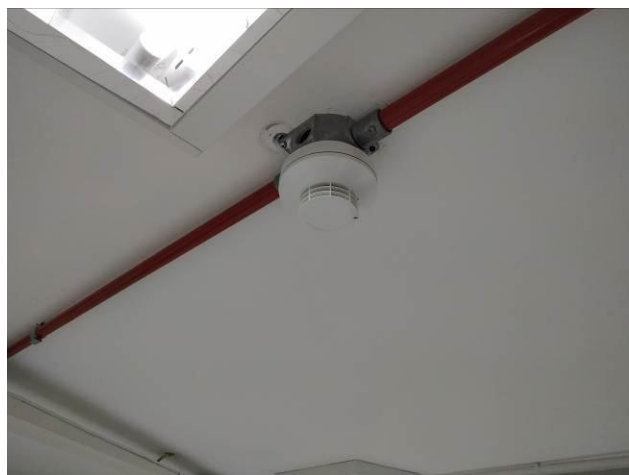
Figura 11: Detector óptico de fumaça