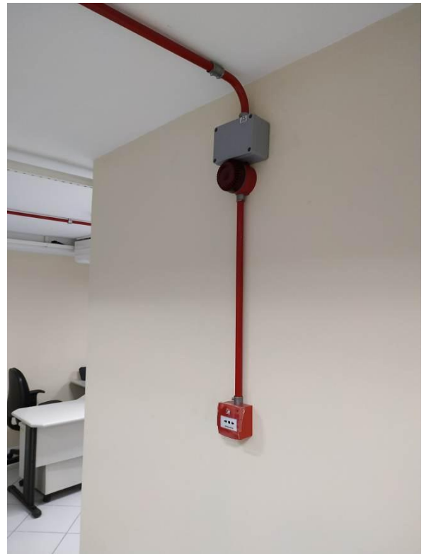
Figura 18 - Conjunto avisador audiovisual e acionador manual