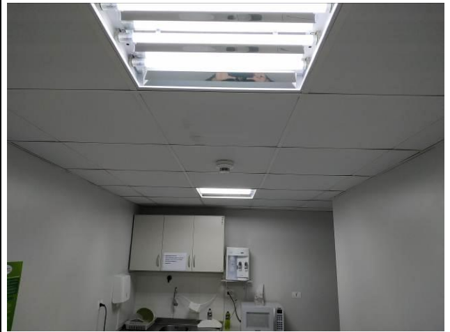
Figura 14 - Detector termovelocimétrico