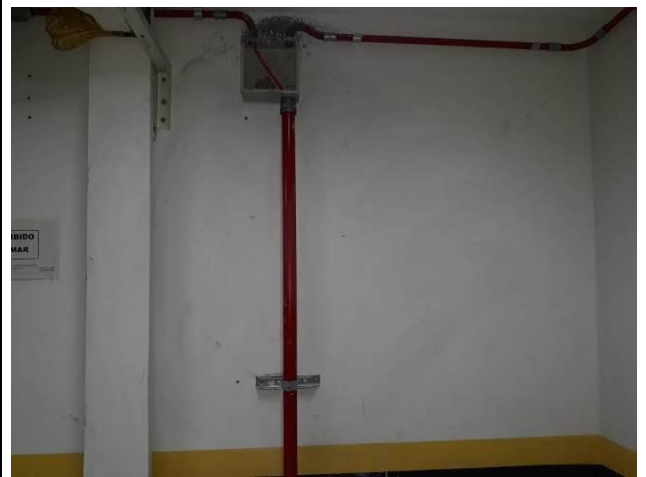
Figura 06: Infraestrutura e cabeamento (garagem 1º pavimento)