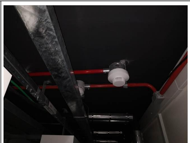
Figura 02: Infraestrutura e detector de fumaça