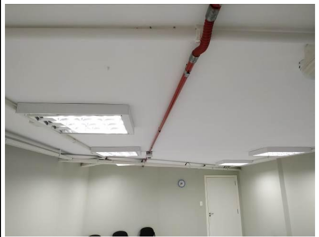
Figura 04: Infraestrutura (sala de audiências)