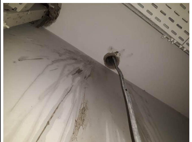
Figura 08: Perfuração em laje de concreto