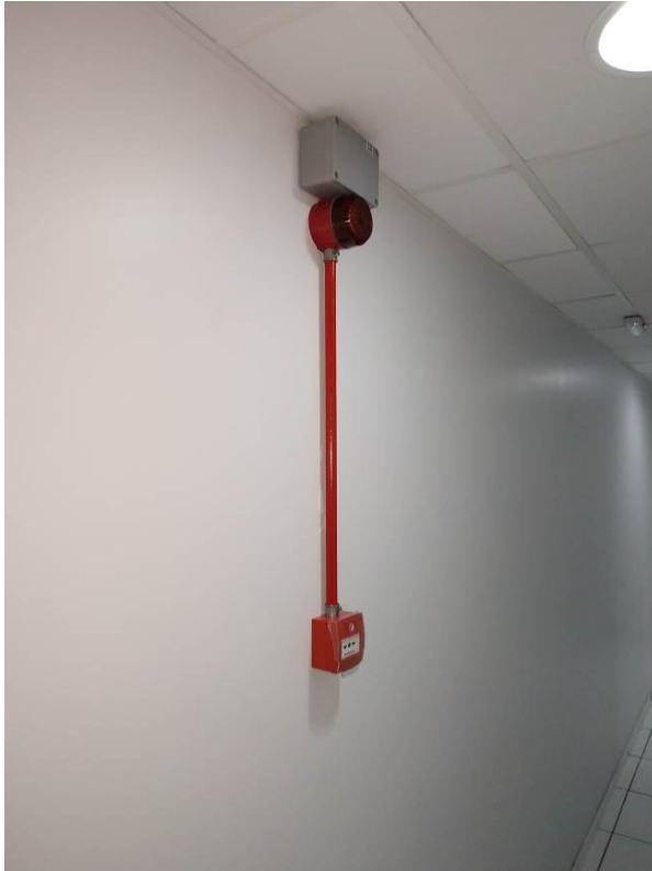
Figura 17 - Conjunto avisador audiovisual e acionador manual