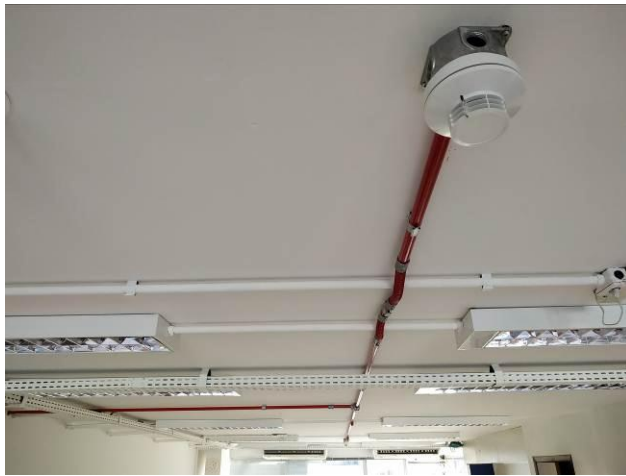
Figura 13 - Detector óptico de fumaça