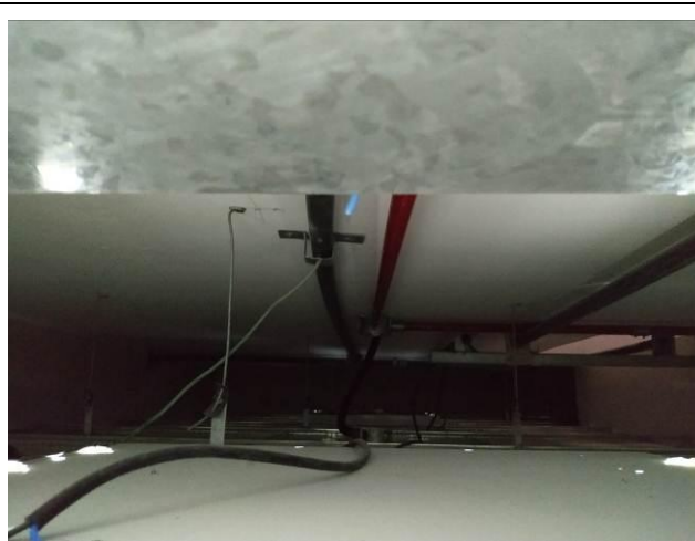
Figura 01: Infraestrutura