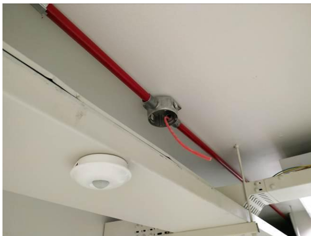
Figura 05: Infraestrutura e cabamento (sobreloja)