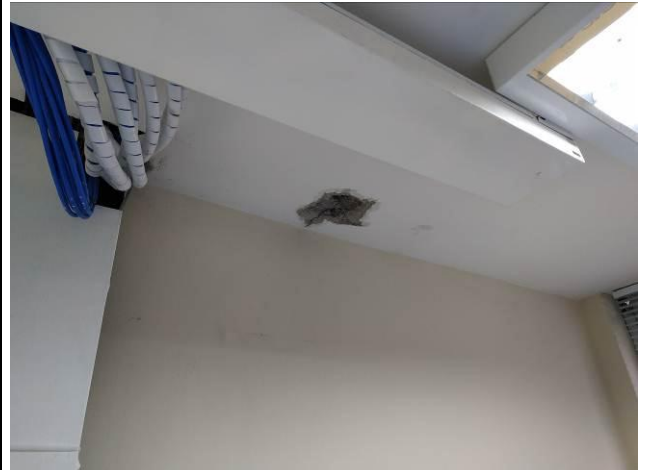
Figura 10: Perfuração em laje de concreto