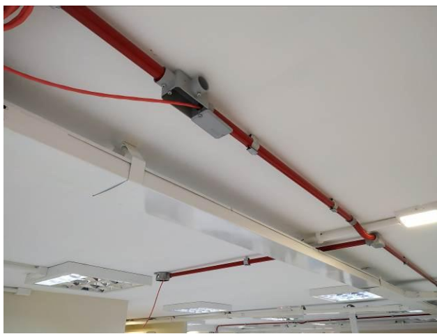
Figura 03: Infraestrutura e cabeamento (secretaria)