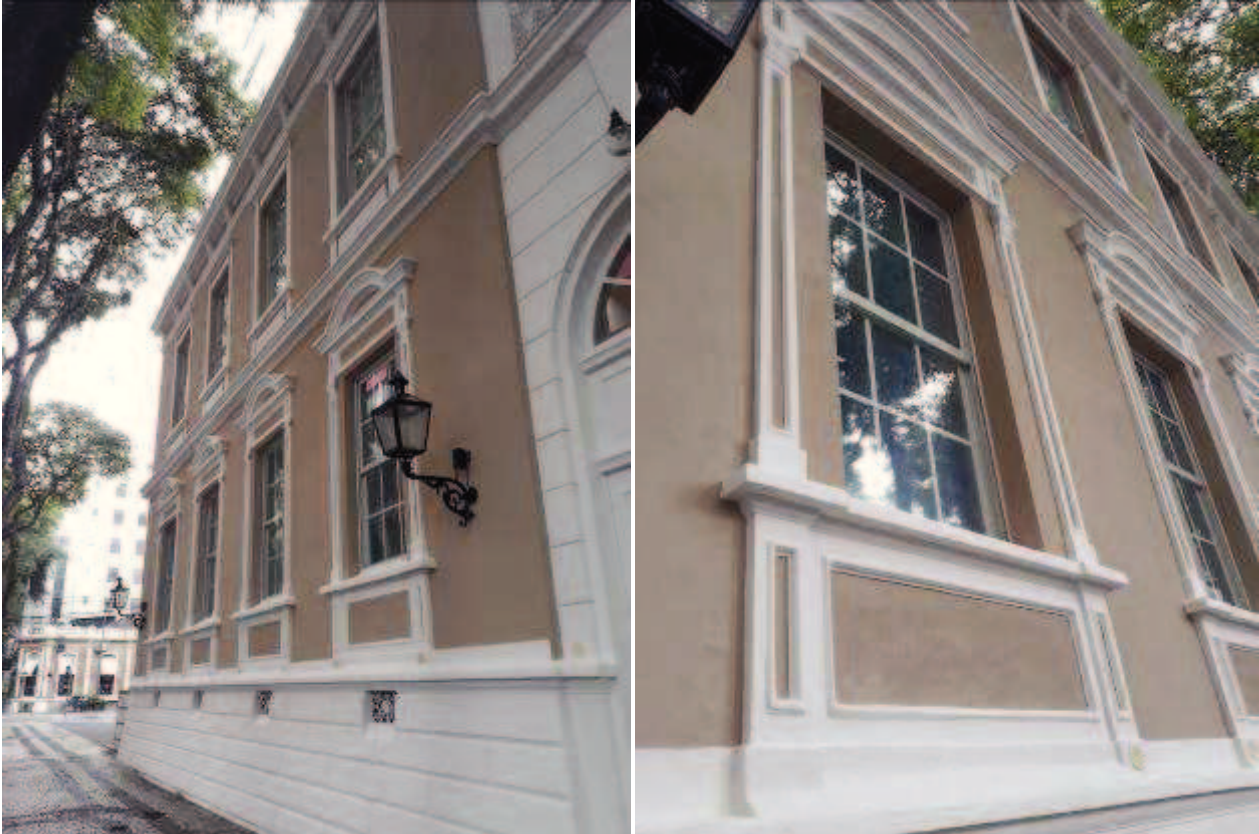
Figuras 06 e 07 - Após obra de restauro

CASARÃO DO TRIBUNAL REGIONAL DO TRABALHO DO PARANÁ