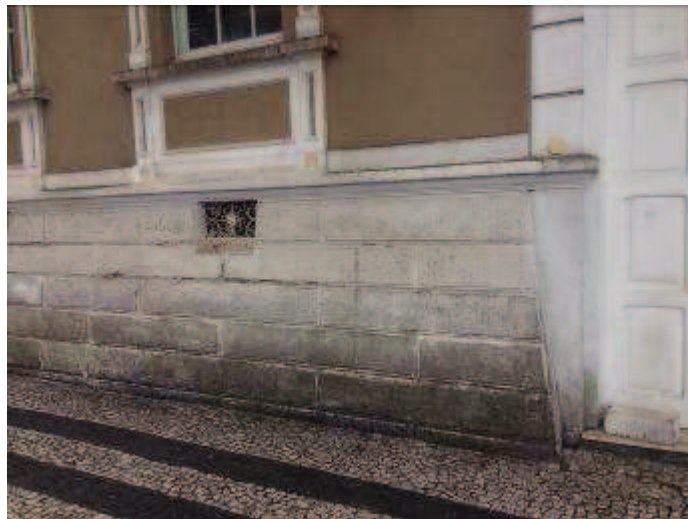
Figuras 09 - Antes do restauro e pintura