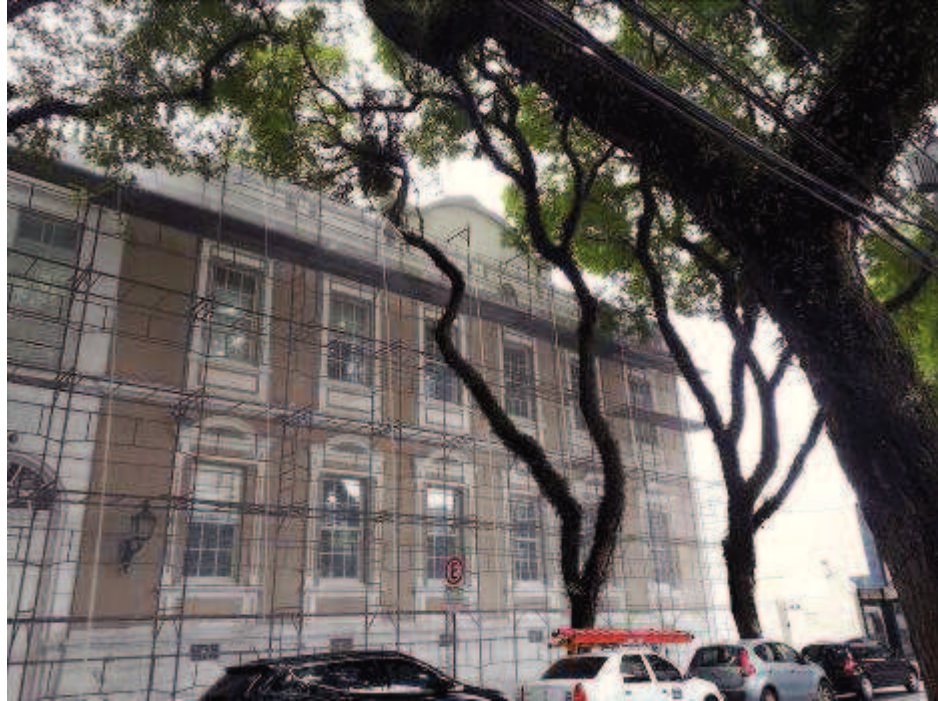
Figura 03 - Andaimos e tela

FISCALIZAÇÃO DE OBRAS - PINTURA E RESTAURO DO IMÓVEL CASARÃO DO TRIBUNAL REGIONAL DO TRABALHO DO PARANÁ