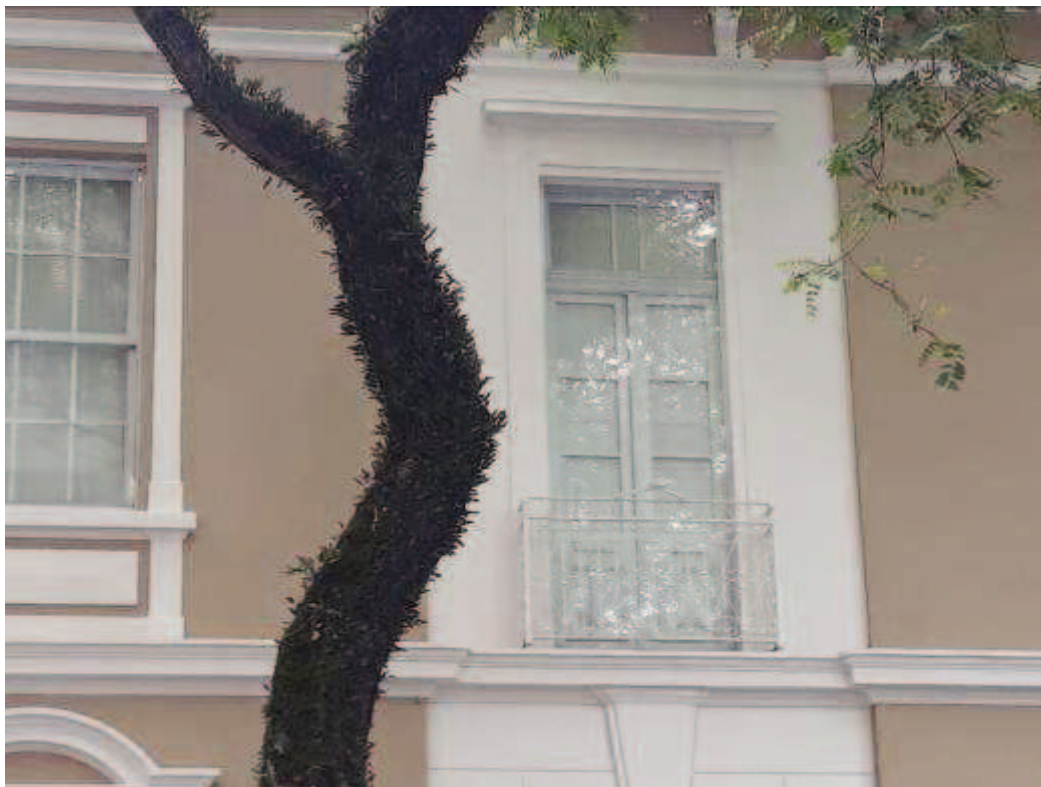
Figura 16 - Sacada após obra de restauro e pintura