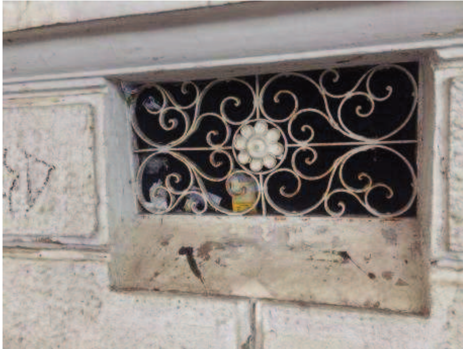
Figura 13 - "Gateira" antes do restauro e pintura