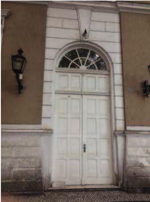
Figura 17 - Porta antes da pintura