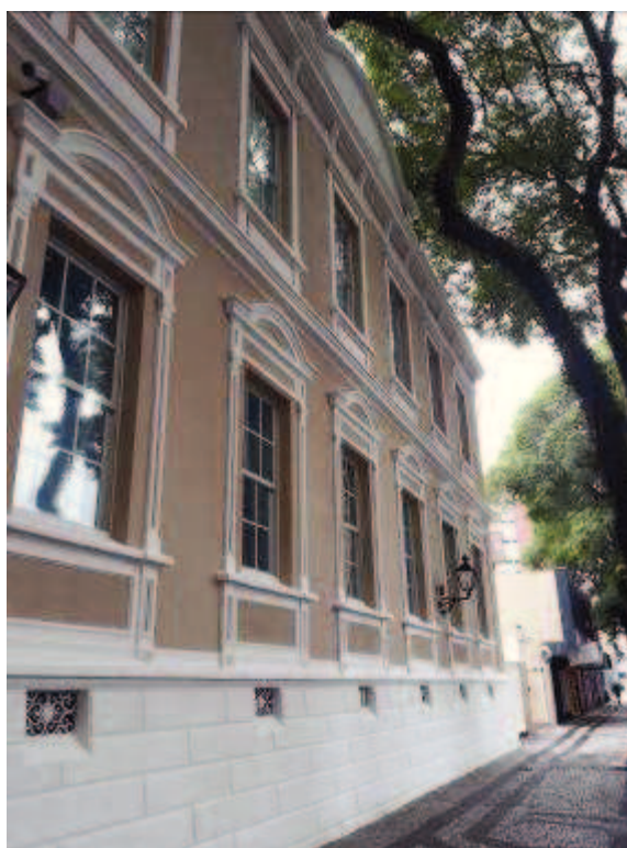
Figuras 10, 11 e 12 - Após obra de restauro e pintura