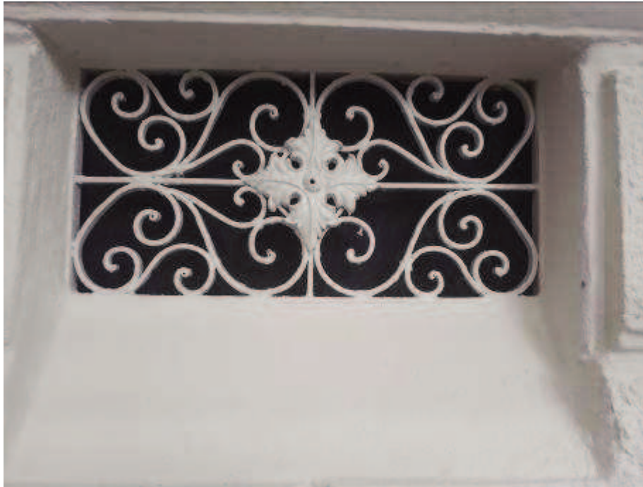
Figuras 14 e 15 - "Gateiras" após obra de restauro e pintura