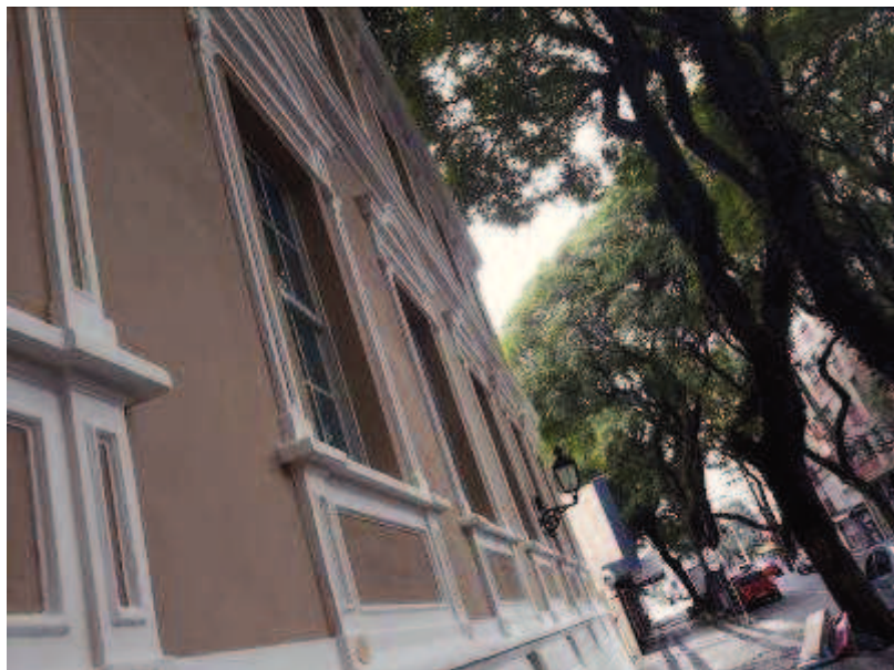
Figura 08 - Após obra de restauro e pintura.