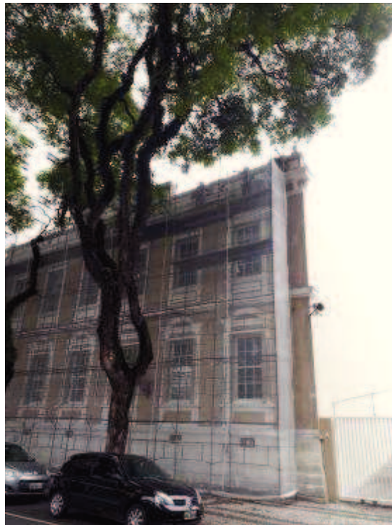
Figura 04 - Andaimos e tela