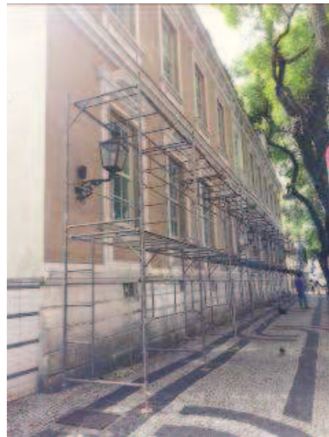
Figuras 01 e 02 - Andaimos e tela