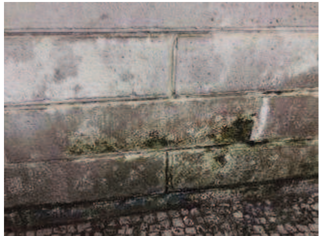
Figuras 05 - Antes do restauro