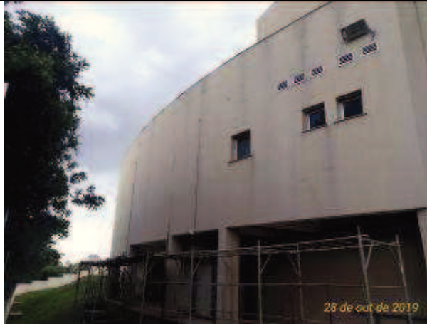
Figura 25. Fachada Norte parcial - ANTES.