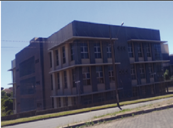
Figura 37. Fachada Oeste/ Sul - Antes