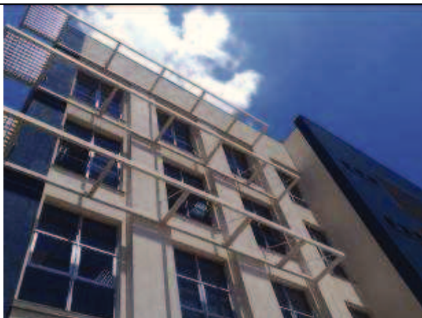
Figura 33: Pintura Fachada Oeste - Durante