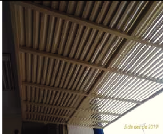
Figura 50: Pintura Portões estacionamento