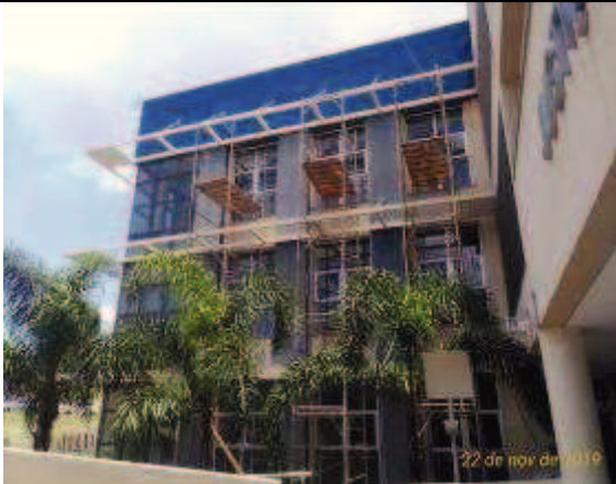
Figura 09: Instalação andaimes- Fachada Sul