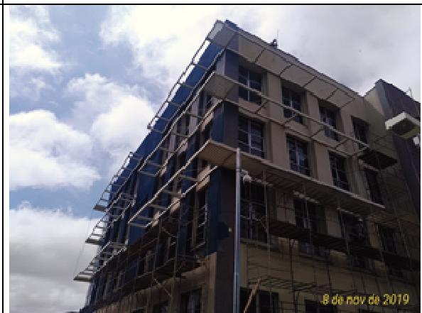
Figura 28: Fachada Norte/oeste - durante