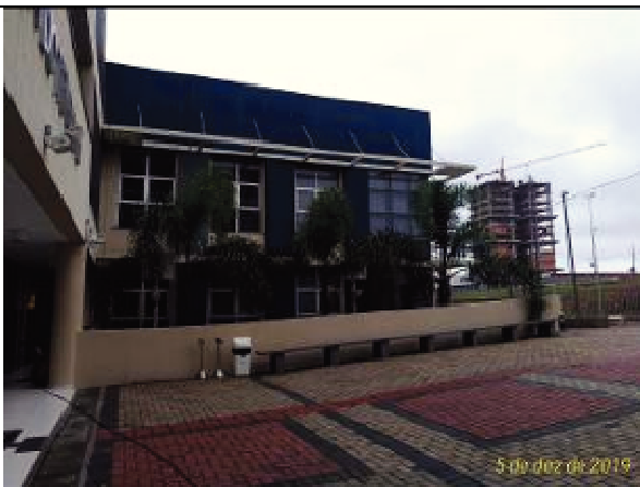
Figura 47: Pintura Acesso- Fachada Sul