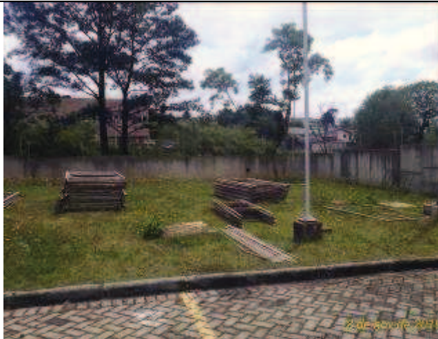
Figura 15: Muro antes.