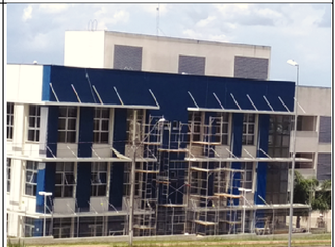
Figura 08: Instalação andaimos- Fachada Sul