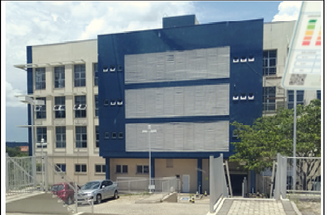
Figura 32: Pintura fachada Oeste - DEPOIS.