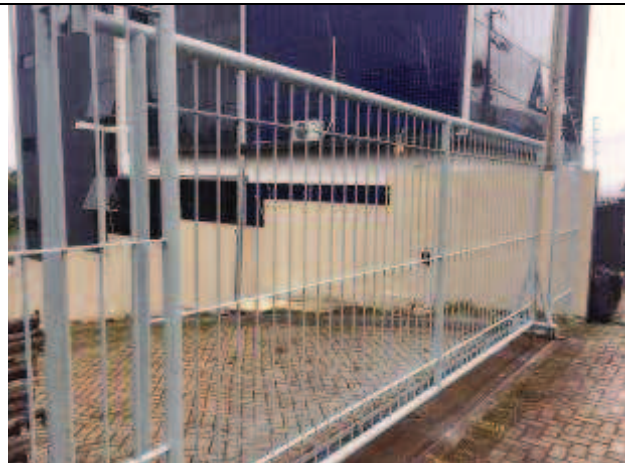
Figura 56: Fachada Sul pintura Gradil /portão