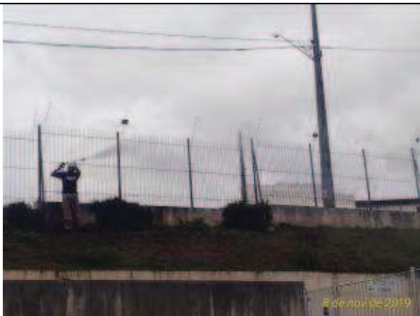
Figura 17. Lavagem de gradil - Antes