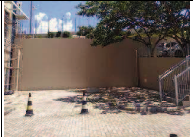
Figura 14: Lavagem e pintura de muro.