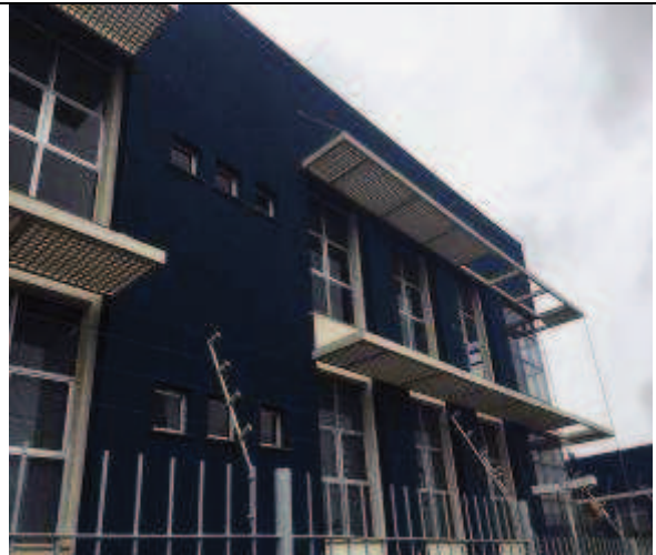
Figura 40: Pintura Fachada Sul - Durante