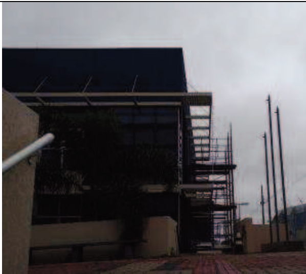
Figura 11. Instalação andaimes- Fachada Sul