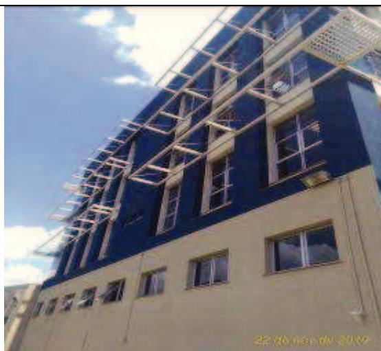
Figura 29. Fachada Norte - Depois