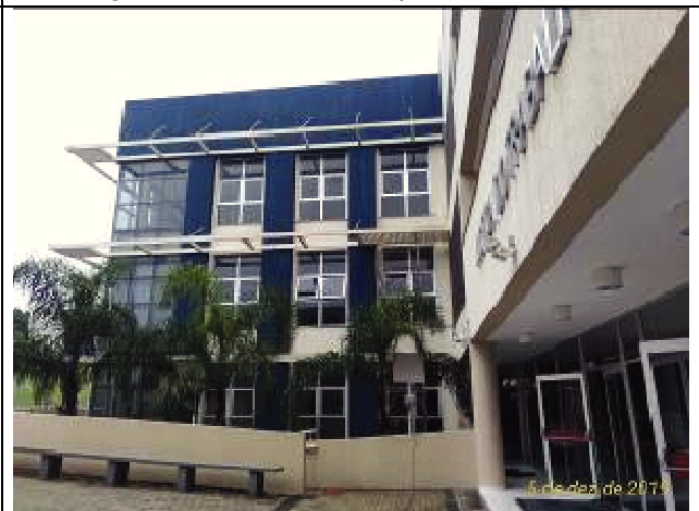
Figura 48: Pintura Acesso- Fachada Sul