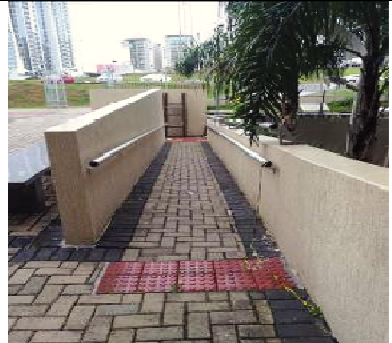
Figura 46: Pintura rampa Fachada Sul