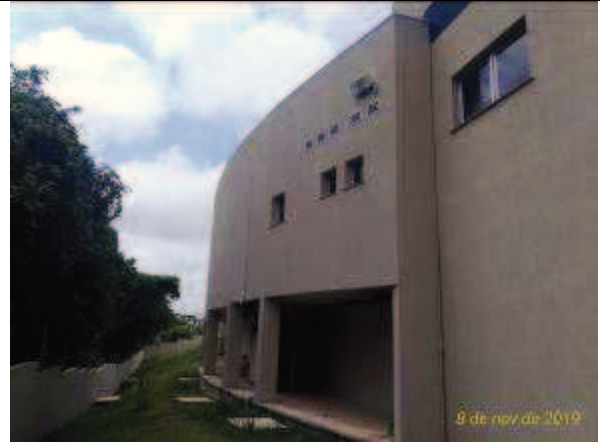
Figura 26: Fachada Norte parcial -DEPOIS.