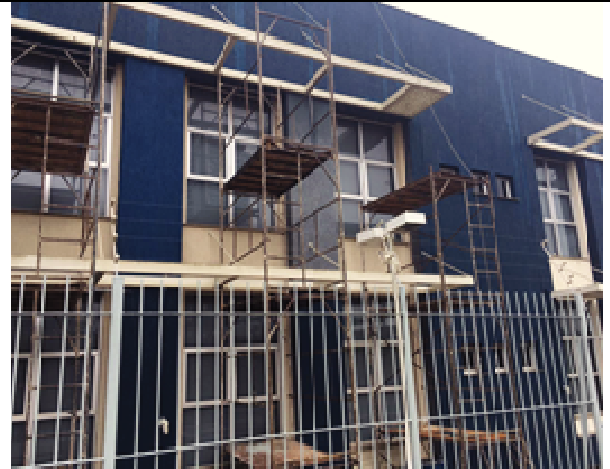
Figura 44: Pintura Fachada Sul - Durante