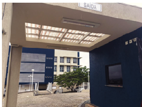
Figura 35. Pintura Fachada Oeste e guarita