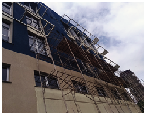
Figura 02: Instalação andaimes- Fachada Norte