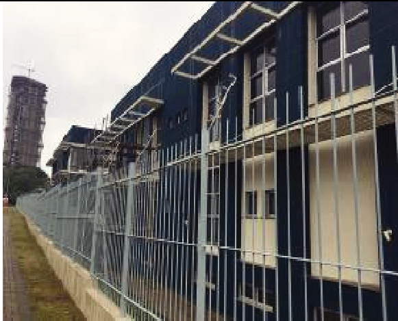
Figura 43: Pintura Fachada Sul - Durante