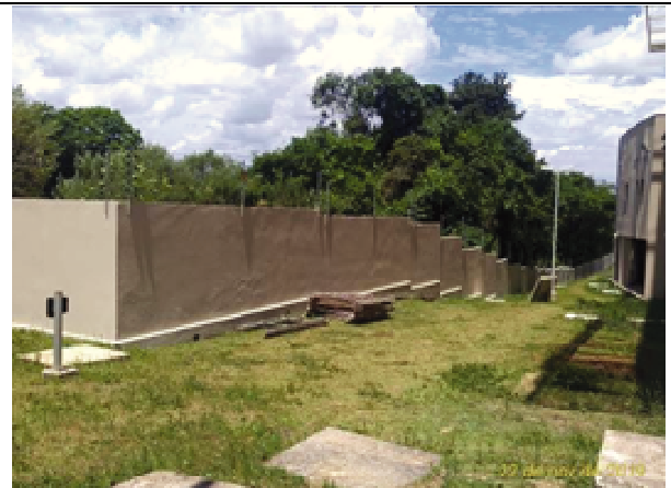
Figura 22. Muro fundos - Depois