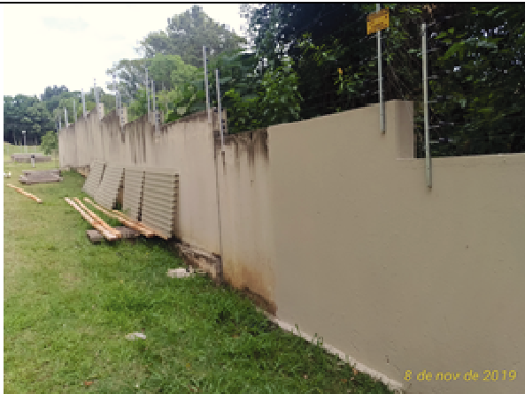
Figura 21. Muro fundos - Antes