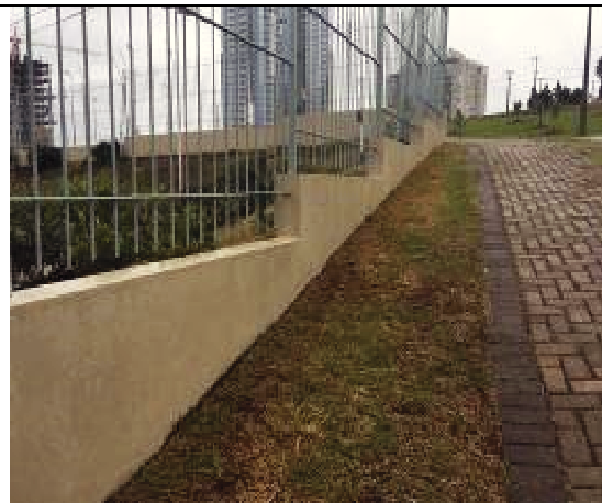
Figura 54: Gradil e muro- Depois