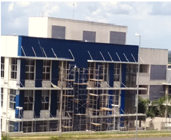
Figura 39: Pintura Fachada Sul - Durante