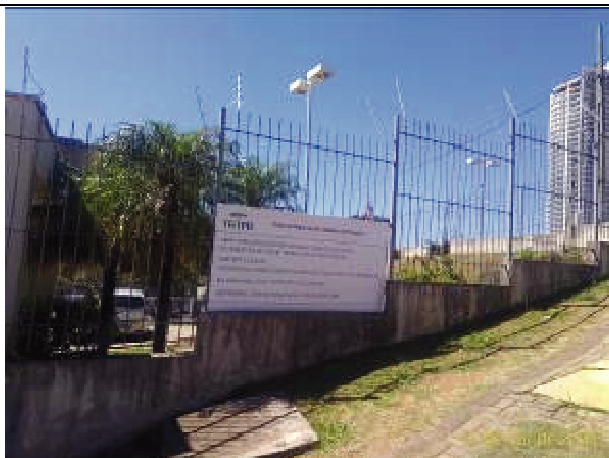
Figura 53: Gradil e muro- antes