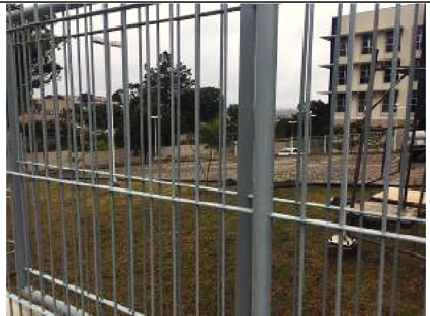
Figura 52: Pintura Gradil.