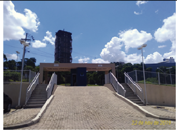
Figura 20. Estacionamento e Guarita - Depois