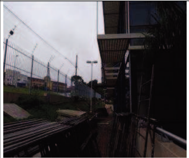
Figura 12: Instalação andaimes- Fachada Sul