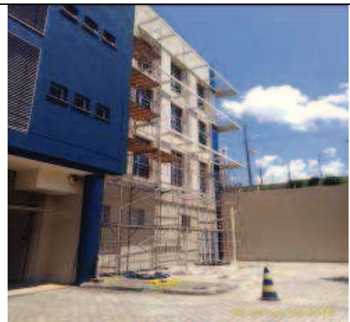
Figura 34: Pintura Fachada Oeste - Durante