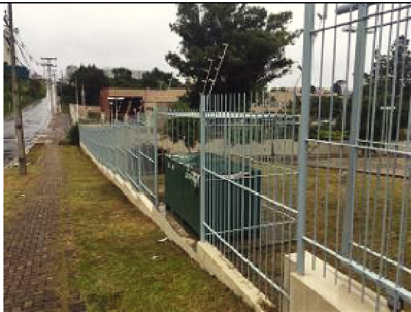
Figura 55: Fachada Oeste pintura Gradil e muro.

TRIBUNAL REGIONAL DO TRABALHO 9ª REGIÃO Secretaria de Engenharia e Arquitetura Fiscalização Pintura FT Ponta Grossa