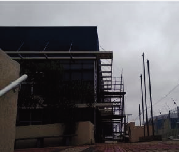
Figura 45: Pintura Fachada Sul - Durante