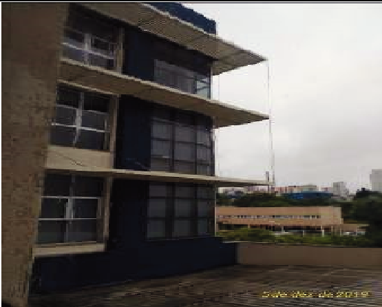
Figura 49: Pintura Face interna sobre telhado