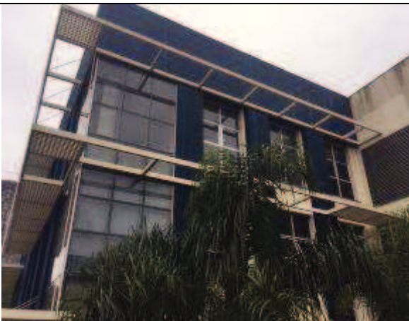
Figura 41: Pintura Fachada Sul - Durante