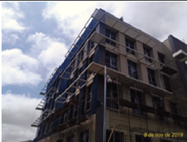
Figura 03: Instalação andaimos- Fachada Oeste