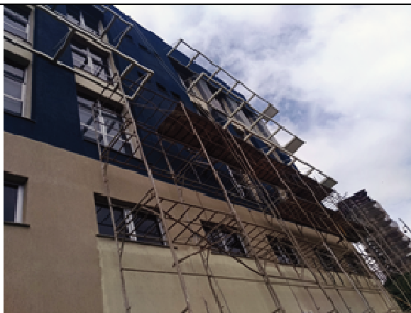
Figura 27: . Fachada Norte parcial - durante