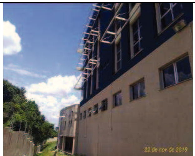
Figura 30: Pintura Fachada Norte - depois