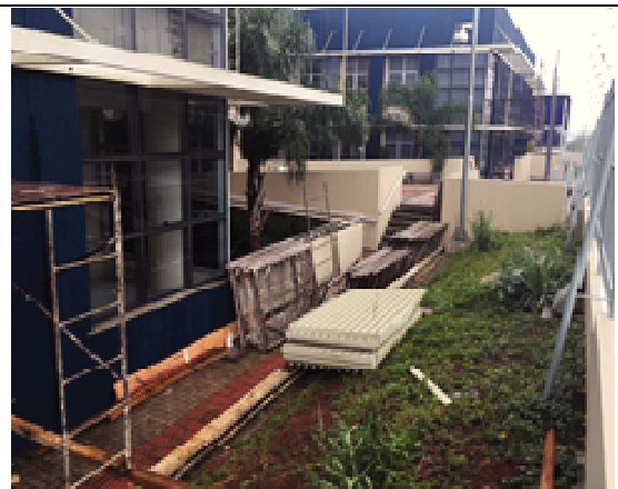
Figura 42: Pintura Fachada Sul - Durante