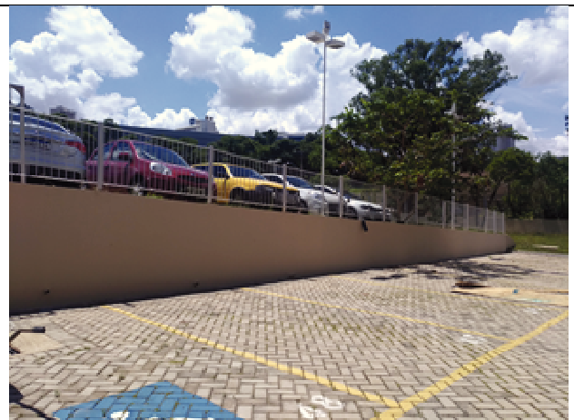
Figura 24. Muro estacionamento - Depois