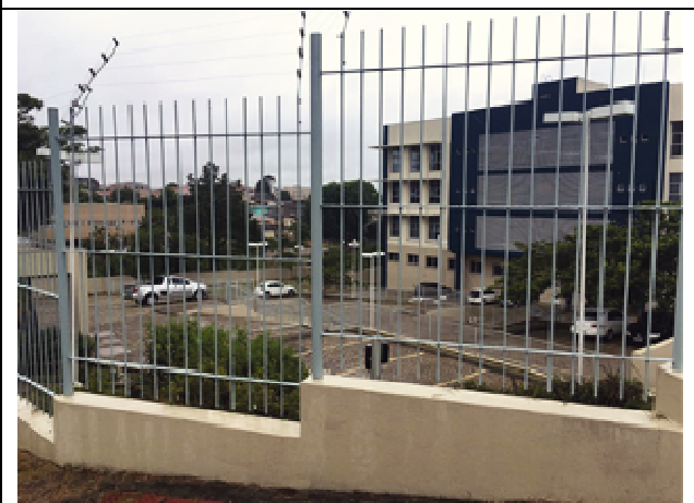
Figura 36: Pintura Fachada Oeste/gradil