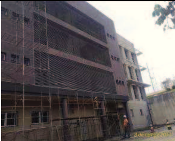
Figura 05: Instalação andaimos- Fachada Oeste