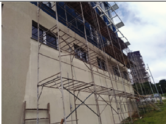
Figura 01: Instalação de Andaimes - Fachada Norte