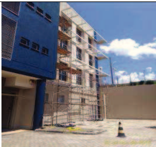
Figura 07: Instalação andaimos- Fachada Oeste.