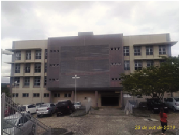
Figura 31. Fachada Oeste -ANTES.

TRIBUNAL REGIONAL DO TRABALHO 9ª REGIÃO Secretaria de Engenharia e Arquitetura Fiscalização Pintura FT Ponta Grossa