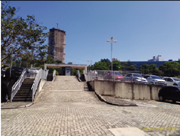
Figura 19. Estacionamento e Guarita - Antes