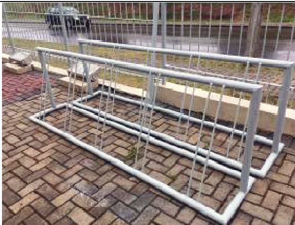
Figura 51: Pintura Gradil e bicicletário