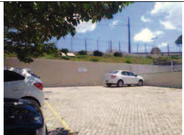
Figura 18: Lavagem e pintura muro- depois