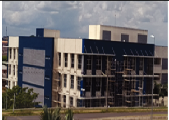
Figura 38: Pintura Fachada Oeste/Sul