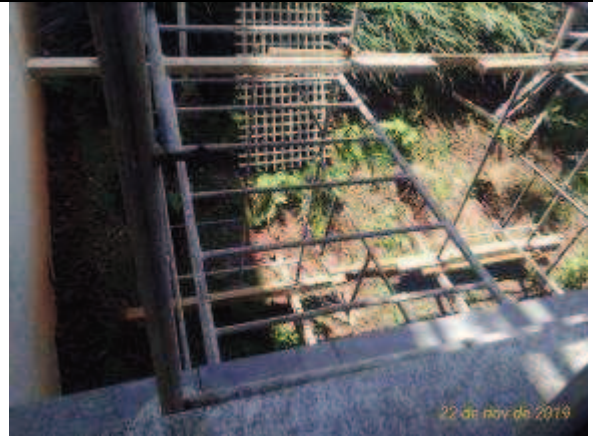
Figura 10: Instalação andaimes- Fachada Sul