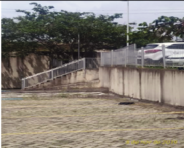
Figura 13. Muro e paver - Antes