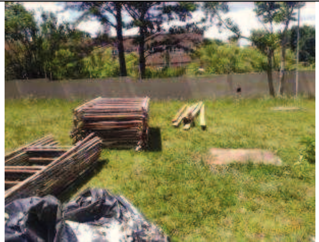
Figura 16: Lavagem e pintura de muro depois