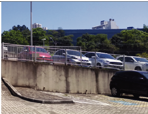
Figura 23. Muro estacionamento - Antes