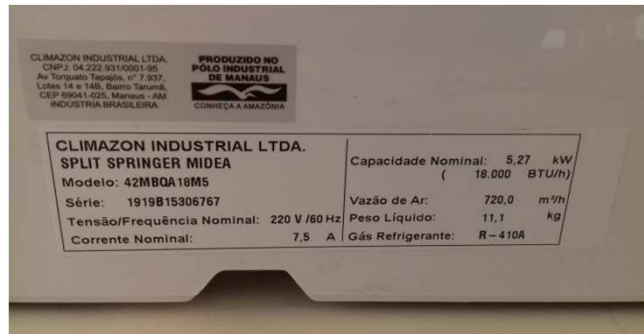
Figura 08C: Decalque da evaporadora - sala da OAB