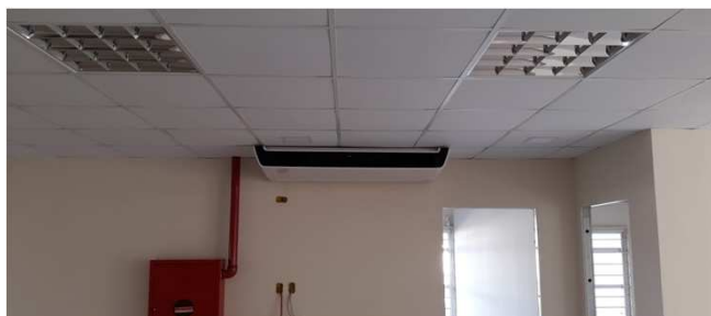
Figura 17C: Segunda evaporadora de 47.000 BTU/h, instalada na secretaria da 2ª Vara