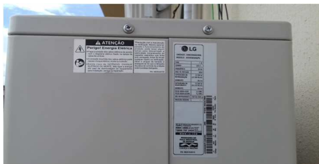
Figura 22C: Decalque de especificações técnicas (47.000 BTU/h)