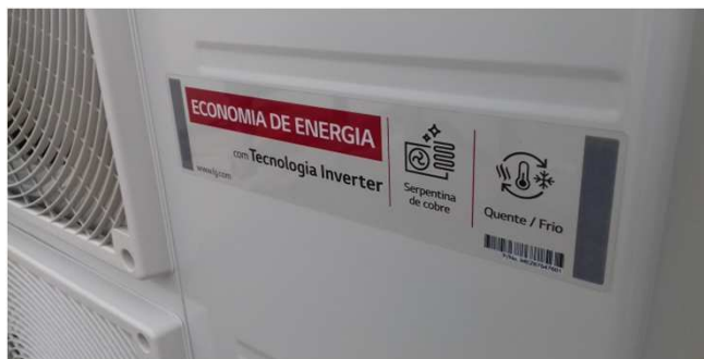
Figura 21C: Condensadora de 47.000 BTU/h, no detalhe