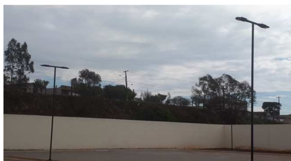
Figura 02E: luminárias externas postes 1 e 2 pétalas