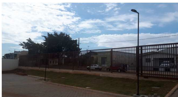
Figura 03E: luminárias externas postes 1 e 2 pétalas