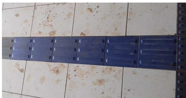
Figura 02C: Piso podotátil direcional, instalado na entrada principal do fórum