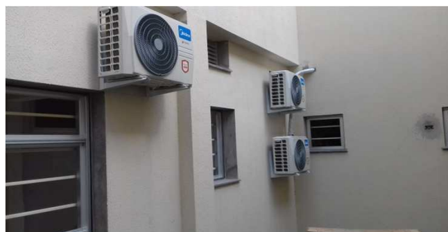
Figura 13C: Condensadoras da sala técnica (fundos) e da sala de conciliação (frente)