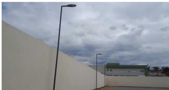
Figura 05E: luminárias externas postes 1 e 2 pétalas