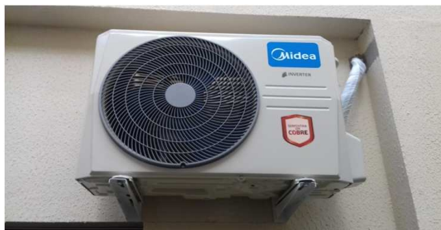
Figura 06C: Condensadora de 12.000 BTU/h