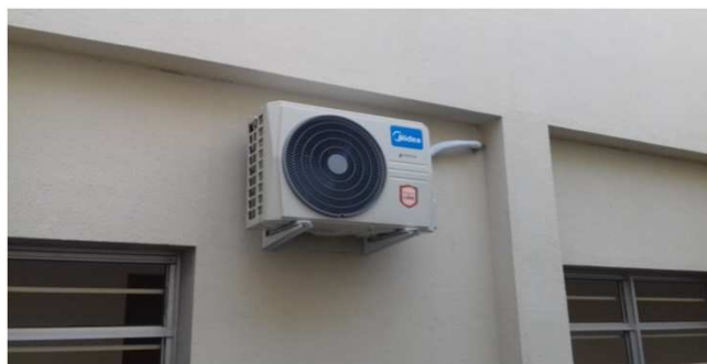
Figura 10C: Condensadora de 18.000 BTU/h