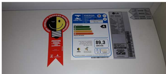
Figura 16C: Etiqueta de consumo - Secretaria da 2ª Vara