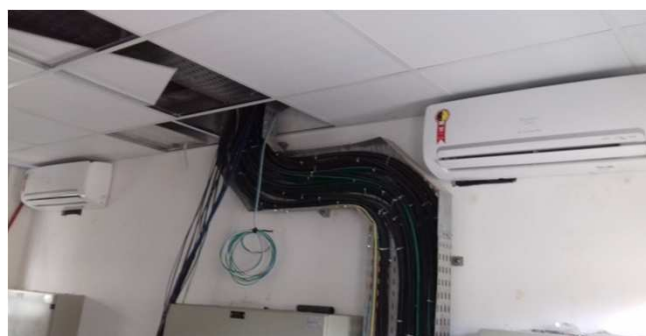
Figura 11C: Duas evaporadoras de 12.000 BTU/h, instaladas na sala técnica