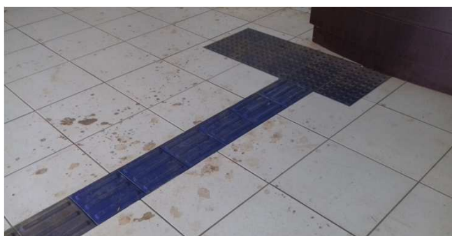
Figura 01C: Piso podotátil direcional, instalado na entrada principal do fórum