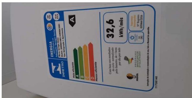
Figura 09C: Etiqueta de consumo - Sala da OAB