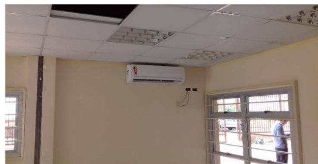
Figura 07C: Evaporadora instalada na sala da OAB