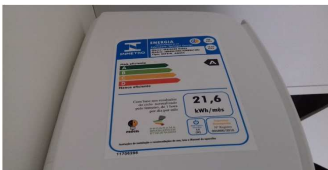
Figura 05C: Etiqueta de consumo - Sala de perícia