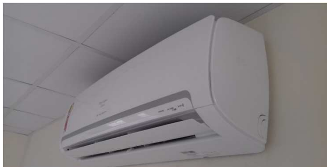
Figura 03C: Evaporadora de 12.000 BTU/h, instalada na sala de perícia