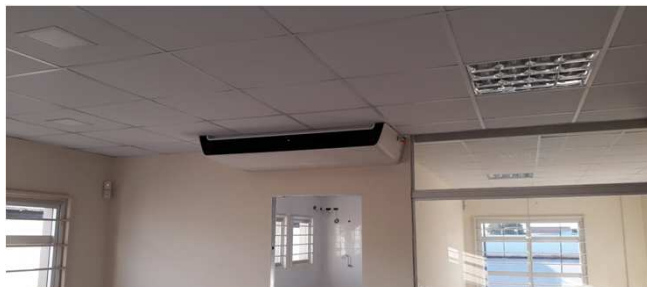
Figura 15C: Evaporadora de 47.000 BTU/h, instalada na secretaria da 2ª Vara