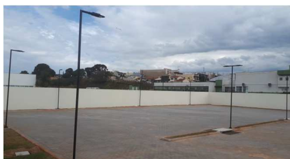
Figura 04E: luminárias externas postes 1 e 2 pétalas