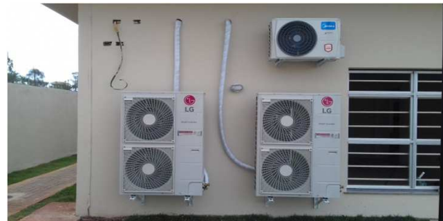
Figura 20C: Condensadoras da secretaria da 1ª vara (47.000 BTU/h) e Condensadora da sala dos assistentes da 1ª Vara (18.000 BTU/h)