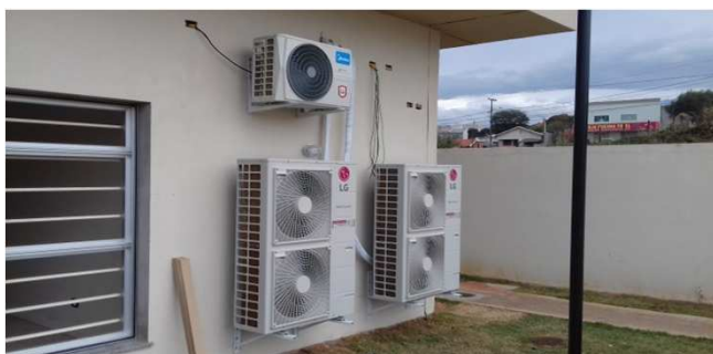
Figura 19C: Condensadoras da secretaria da 2ª vara (47.000 BTU/h) e Condensadora da sala dos assistentes da 2ª Vara (18.000 BTU/h)