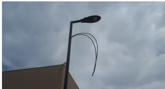
Figura 06E: luminárias externas postes 1 e 2 pétalas