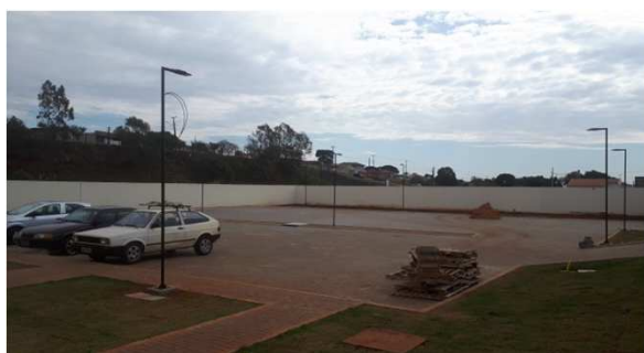
Figura 01E: luminárias externas postes 1 e 2 pétalas