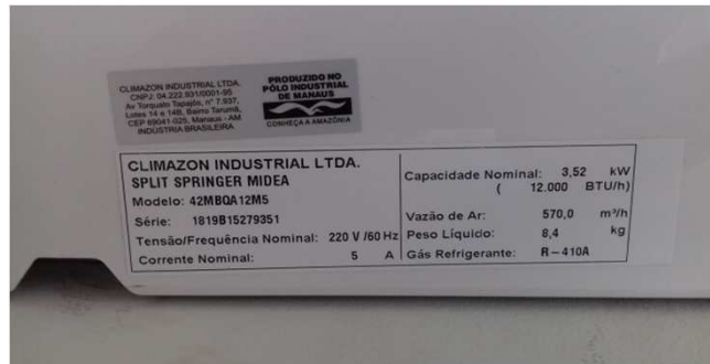
Figura 04C: Decalque da evaporadora - sala de perícia