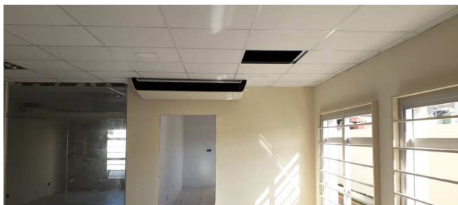
Figura 18C: Evaporadora de 47.000 BTU/h, instalada na secretaria da 1ª Vara