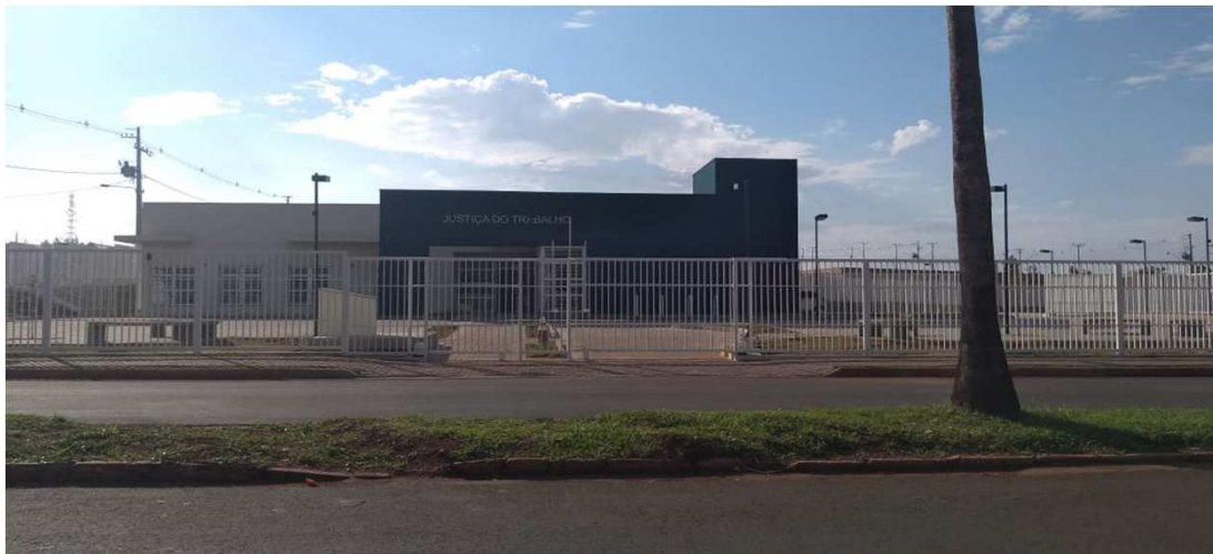
visão geral da obra

O total executado nesta etapa, foi de 65.861,31 (sessenta e cinco mil, oitocentos e sessenta e um reais e trinta e um centavos), que corresponde a um percentual de 3,79% para a medição e 100% acumulado. Estava previsto, no cronograma atualizado, um total acumulado de 100%, o que foi cumprido e a obra encontra-se finalizada.