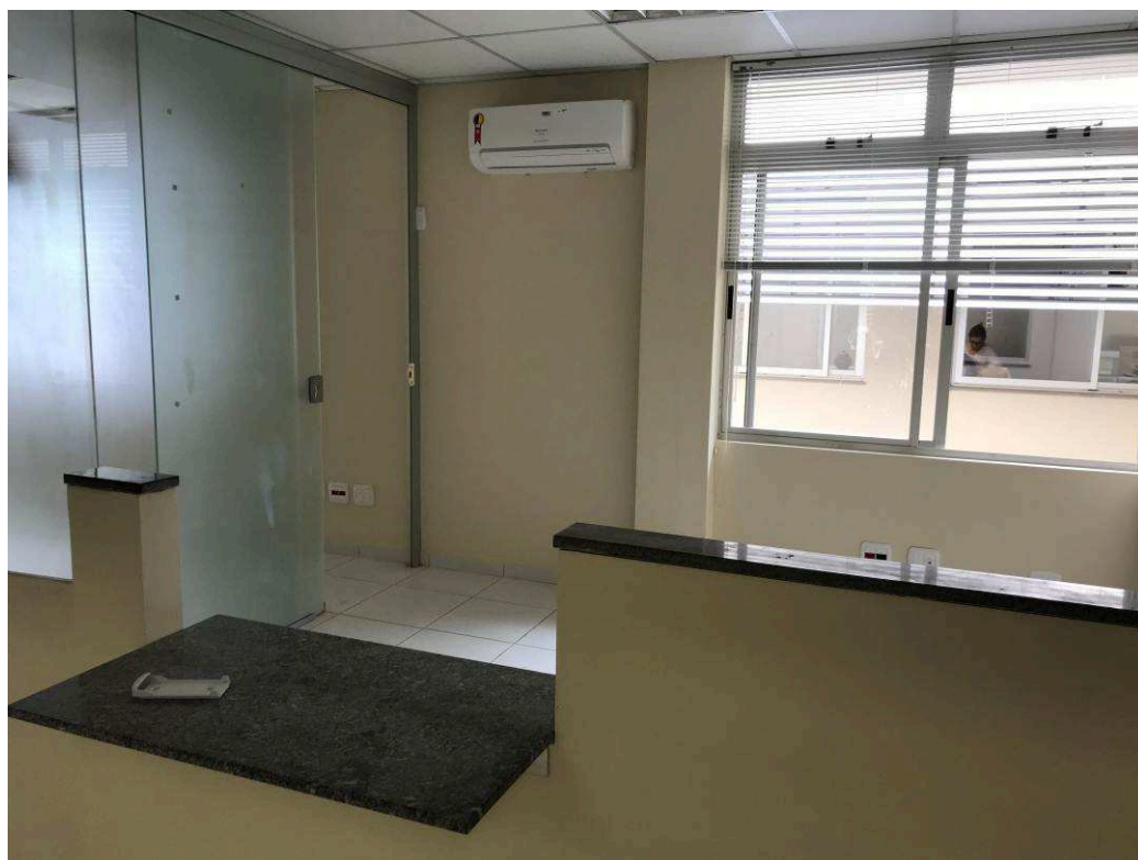
Figura 2 – Vista interna - CEJUSC.