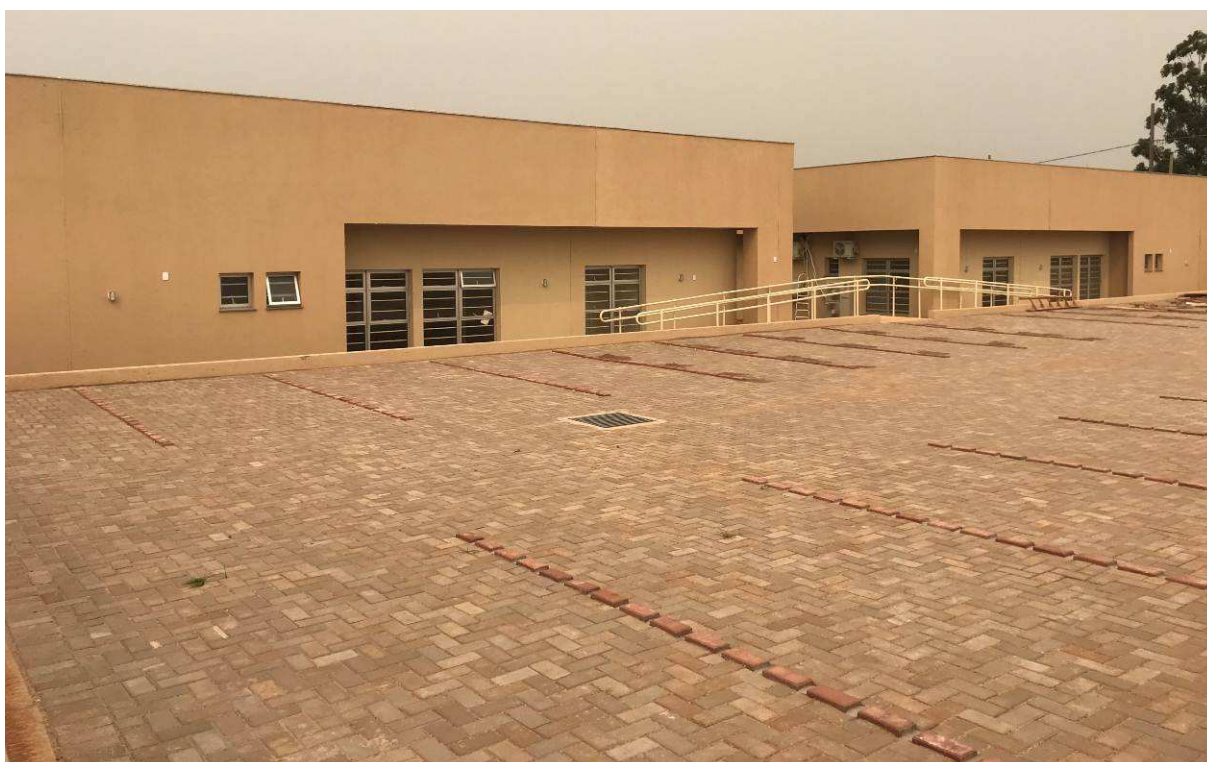
Figura 3 – Fórum - Vista externa - Fundos.