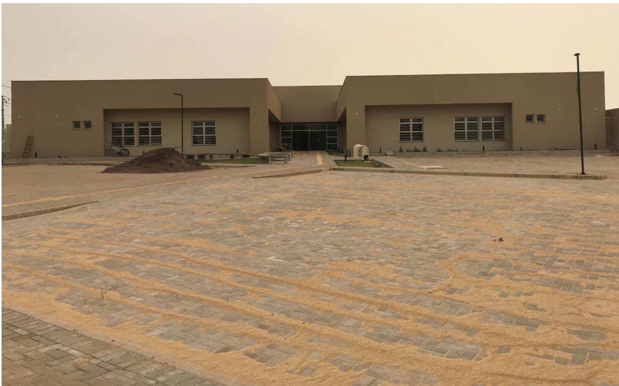
Figura 1 – Fórum - Vista externa - Frente.

condicionado), 15,98% do item 17 (Instalações de prevenção contra incêndios), 8,71% do item 18 (Paisagismo e serviços internos), 8,28% do item 19 (Pinturas), 33,10% do item 20 (Serviços complementares), 100,00% do item 21 (Limpeza da obra), 7,53% do item 22 (Instalações elétricas), 4,54% do item 23 (Sistema de proteção contra descargas atmosféricas), 22,87% do item 24 (Instalações lógicas, CFTV, telefonia, alarme), 6,87% do item 25 (Sistema de alarme e acionadores da bomba de combate à incêndio), 0,00% do item 26 (1º Termo Aditivo), e 100,00% do item 27 (2º Termo Aditivo). Porém, a Contratada executou 0,00% do valor previsto para o item 01, 0,00% do item 02, 0,00% do item 03, 0,00% do item 04, 0,00% do item 05, 1,23% do item 06, 1,64% do item 07, 0,00% do item 08, 0,00% do item 09, 0,00% do item 10, 0,00% do item 11, 0,00% do item 12, 0,00% do item 13, 9,58% do item 14, 4,81% do item 15, 17,99% do item 16, 13,57% do item 17, 4,82% do item 18, 0,52% do item 19, 3,07% do item 20, 0,00% do item 21, 5,24% do item 22, 4,54% do item 23, 17,95% do item 24, 5,24% do item 25, 0,00% do item 26, e 100,00% do item 27.