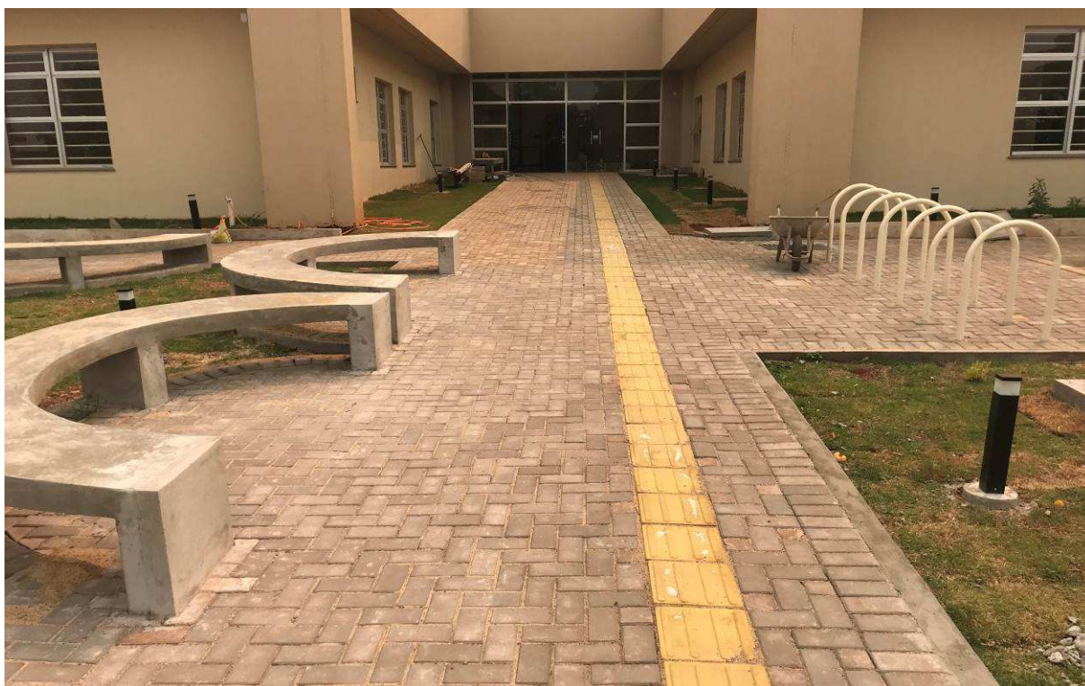
Figura 2 – Fórum - Vista externa - Frente.