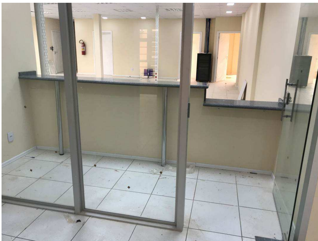
Figura 4 – Fórum - Vista interna - Balcões de atendimento.