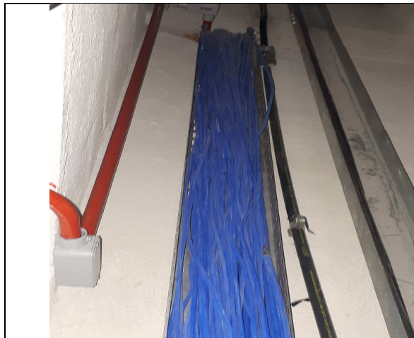
Figura 3E - sala técnica 2º pav