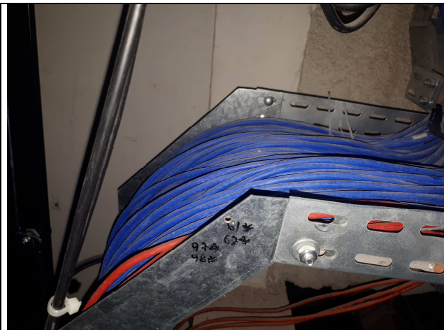
Figura 4E - sala técnica 2º pav