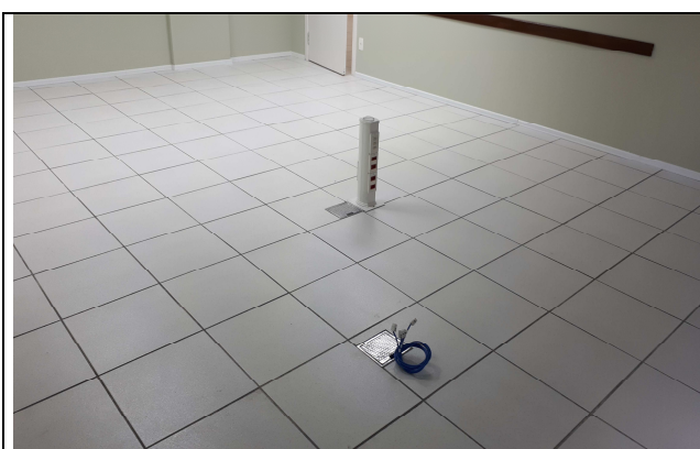
Figura 1E - salas de audiências 2º pav