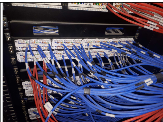
Figura 6E - rack 1º pavimento