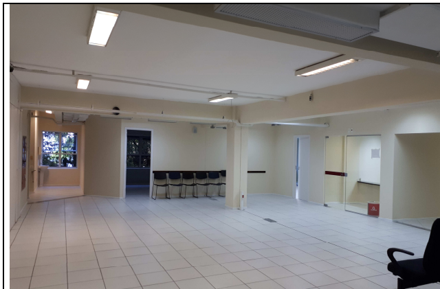
Figura 7E - totens hall 2º pav com tomadas