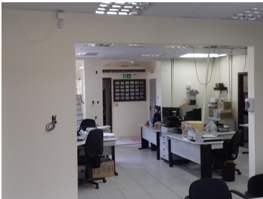
Figura 2 – Visão interna do imóvel