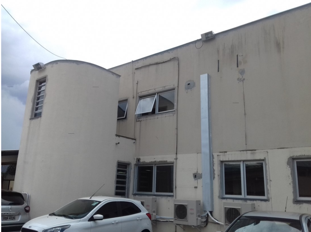
Figura 1 – Visão externa o imóvel

As imagens abaixo retratam a situação geral do canteiro de obra, após término da etapa atual.