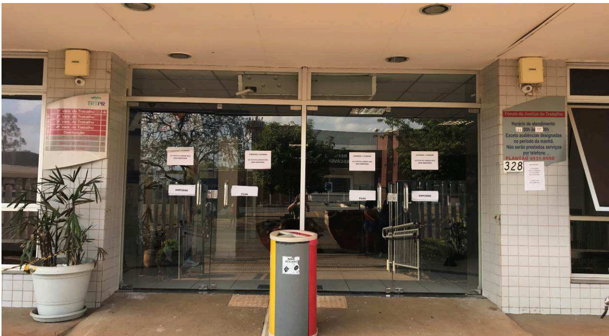
Figura 1 – Esquadria da entrada principal.

Conforme o cronograma contratual deveria ter sido executado 25,00% do valor previsto para o item 01 (Administração de obra e serviços iniciais), 26,66% do item 02 (Instalação do canteiro de obras), 2,51% do item 03 (Coberturas), 82,56% do item 04 (Instalações hidráulicas), 59,83% do item 05 (Forro), 52,96% do item 06 (Esquadrias), 37,46% do item 07 (Pinturas internas), 30,98% do item 08 (Pinturas externas), 40,36% do item 09 (Rede climatização), 84,73% do item 10 (Adaptação no passeio e implantação de estacionamento em via pública), 21,44% do item 11 (Entrada principal do Fórum - rampa/jardim/bancos), 0,00% do item 12 (Serviços complementares), 23,66% do item 13 (Instalações elétricas - climatização e transferência no-break), 46,22% do item 14 (Instalações elétricas - iluminação), 70,00% do item 15 (Sistema de proteção contra descargas atmosféricas - SPDA), e 49,75% do item 16 (1º Termo Aditivo). Porém, a Contratada executou 25,00% do valor previsto para o item 01, 25,16% do item 02, 2,51% do item 03, 46,48% do item 04, 44,50% do item 05, 5,03% do item 06, 50,23% do item 07, 26,33% do item 08, 44,50% do item 09, 80,32% do item 10, 21,44% do item 11, 0,00% do item 12, 18,33% do item 13, 50,19% do item 14, 0,00% do item 15, e 0,00% do item 16.