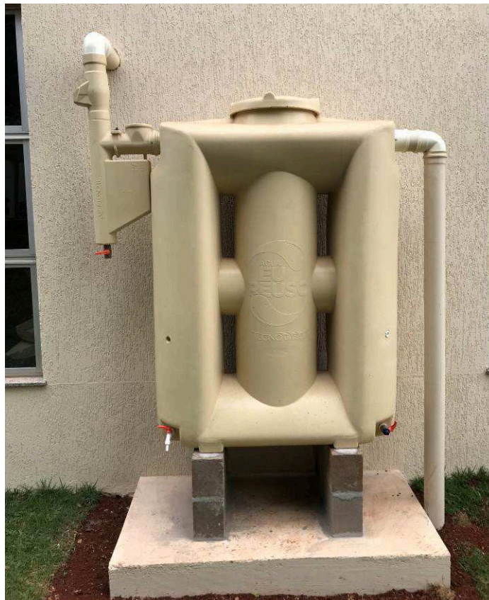
Figura 3 – Cisterna de Reaproveitamento de Águas Pluviais.