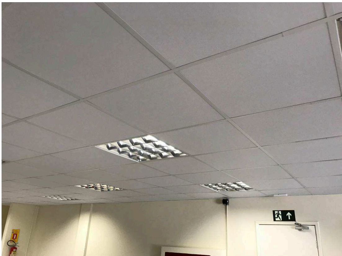
Figura 5 – Forro - 2ª Vara do Trabalho.