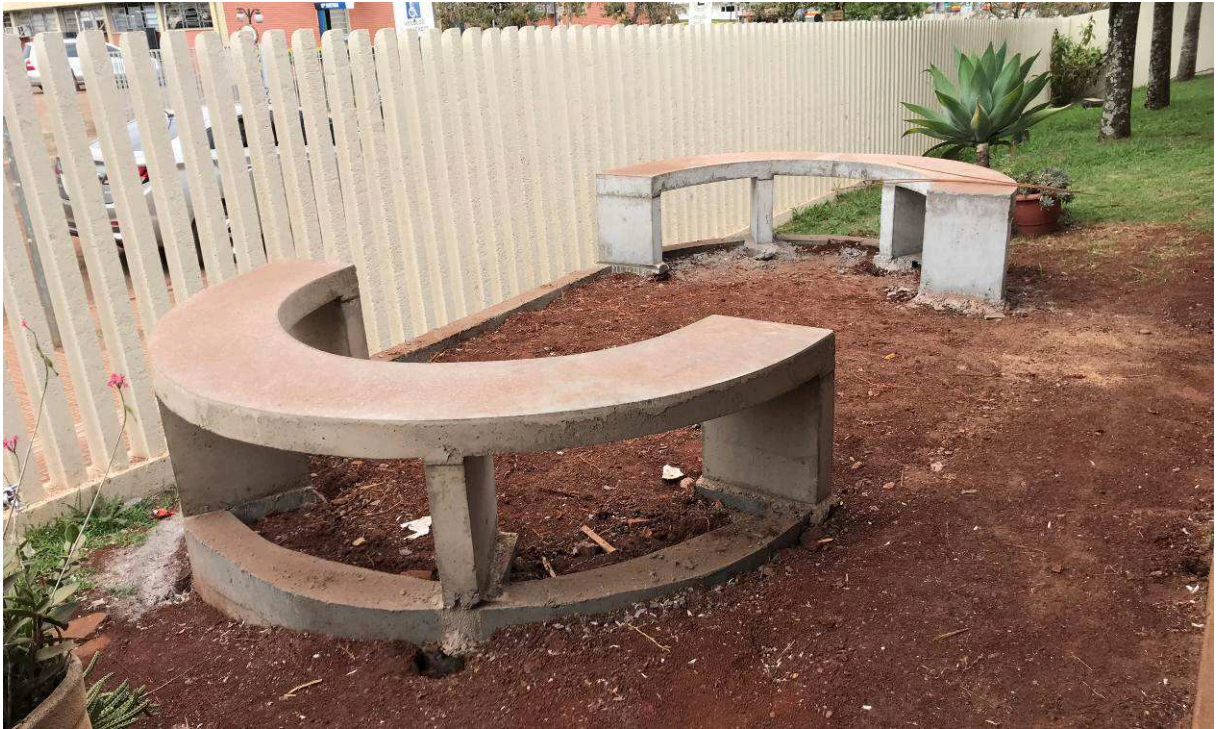
Figura 4 – Bancos de concreto.