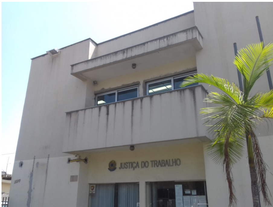
Figura 2 – Frontal