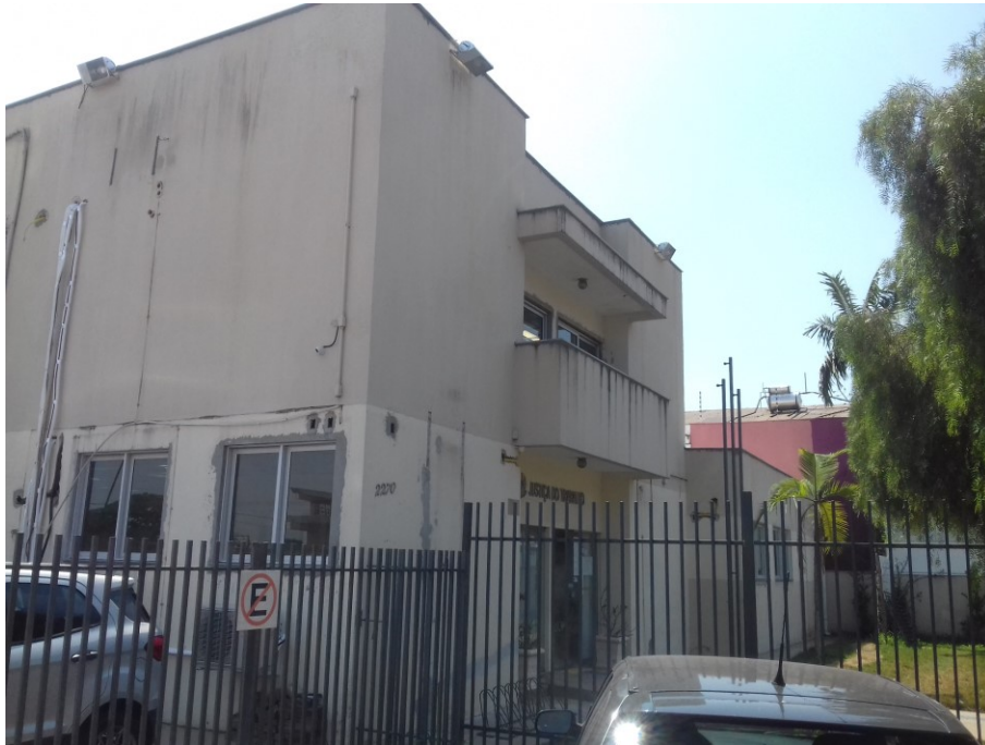
Figura 1 – Frontal e lateral esquerda