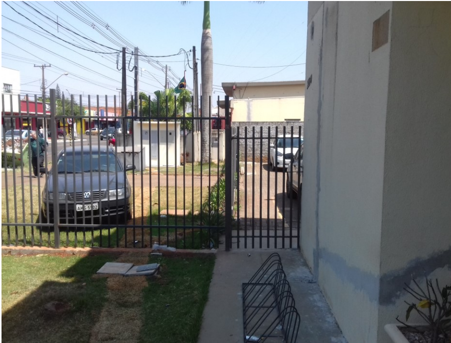
Figura 3 – Entrada do estacionamento