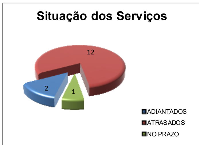
Gráfico 1.

O Gráfico 1, abaixo, mostra a quantidade de itens adiantados, atrasados e dentro do prazo, em relação à etapa atual, tendo em vista o cronograma vigente da obra.