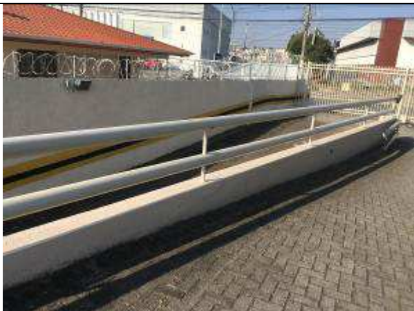
Figura 44C - pintura muretas estacionamento - Rua Joaquim Nabuco