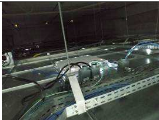
Figura 20E - pontos lógicos (múltiplo uso)