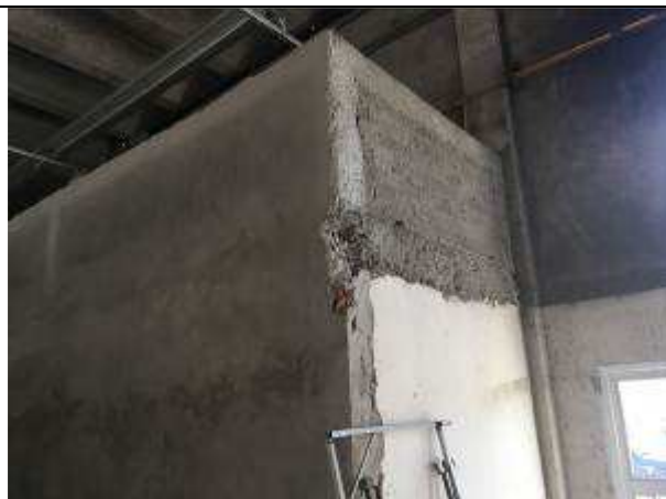
Figura 04C - pilares e vigas executadas