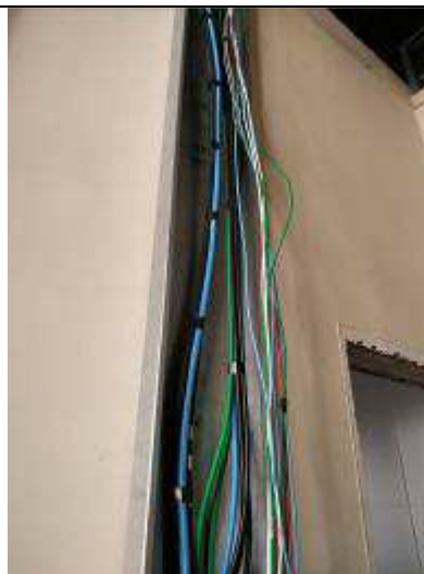
Figura 18E - Hall - infraestrutura e cabeamento elétrico