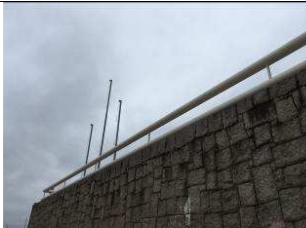
Figura 48C - pintura muretas estacionamento - fachada Av. das Nações Unidas