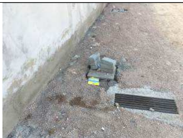
Figura 37C - reinstalação de piso paver - valas para passagem de tubulação elétrica e caixas de passagem - estacionamento frente