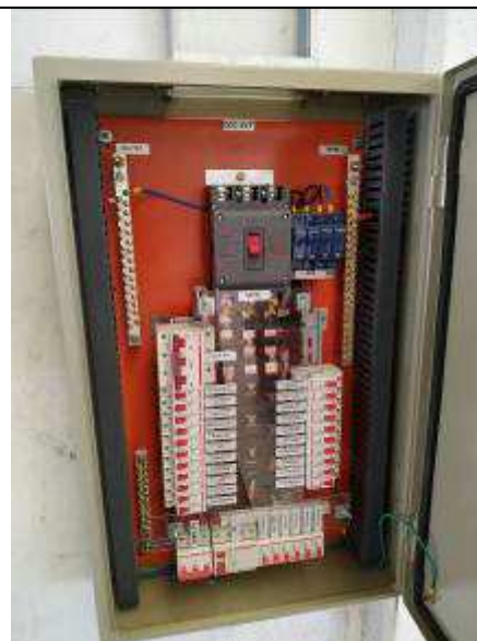
Figura 06E - Quadro elétrico QDC-4VT