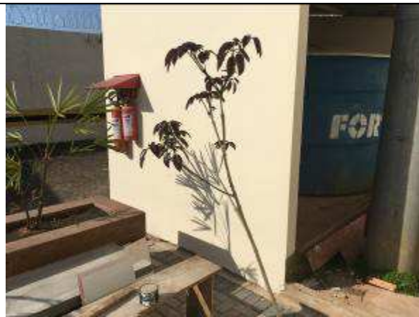
Figura 26C - Plantio de árvore - jardim de acesso à 3ª VT