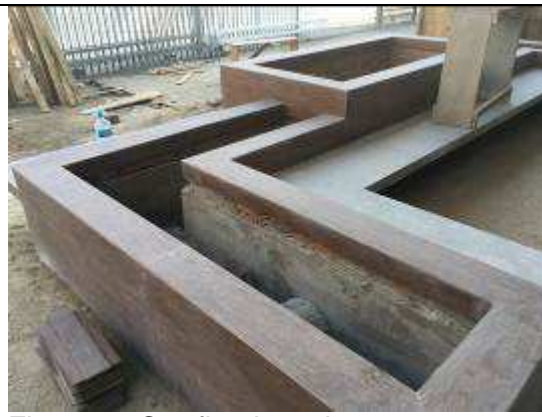
Figura 28C - floreiras de concreto em "L" - jardim do acesso principal ao FT