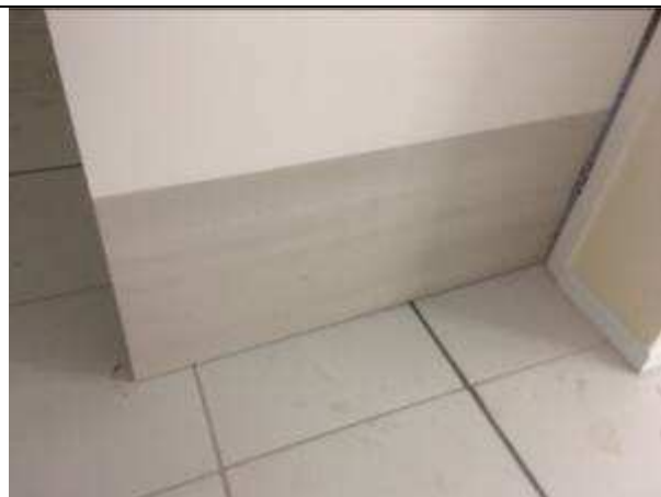
Figura 22C - proteção laminado melamínico - portas - BWC PABs