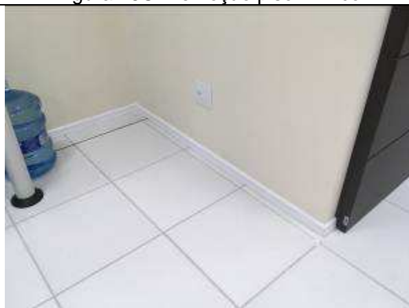
Figura 18C - rodapés