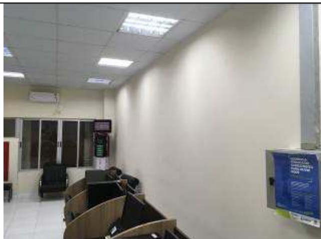
Figura 23C - Pintura interna - OAB