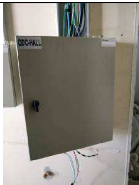
Figura 11E - Quadro elétrico QDC-Hall