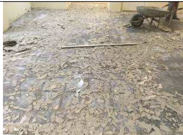
Figura 16C - remoção piso vinílico