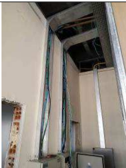
Figura 17E - Hall - quadros, infraestrutura e cabeamento elétrico