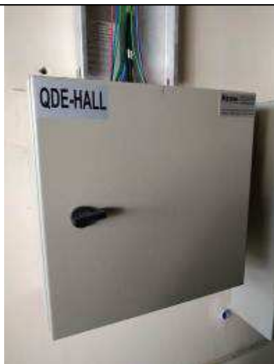
Figura 15E - Quadro elétrico QDE-Hall