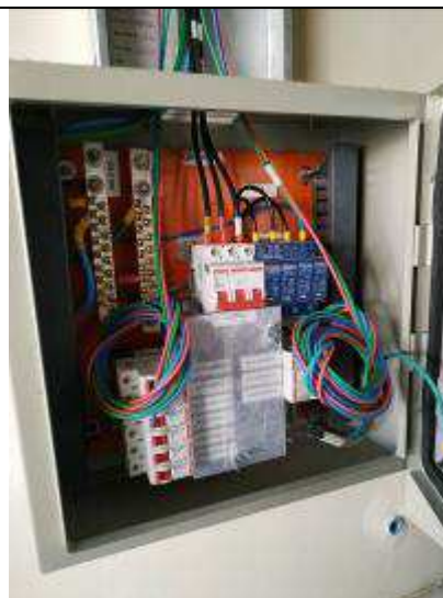
Figura 16E - Quadro elétrico QDE-Hall