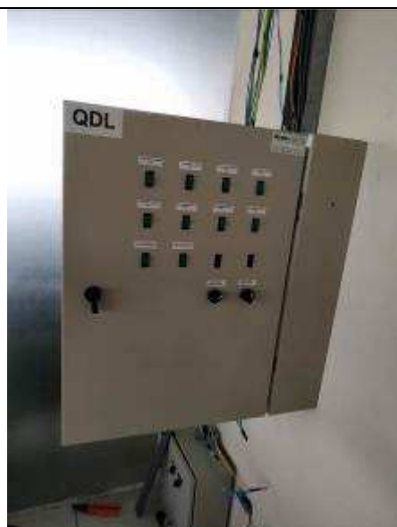
Figura 13E - Quadro elétrico QDL