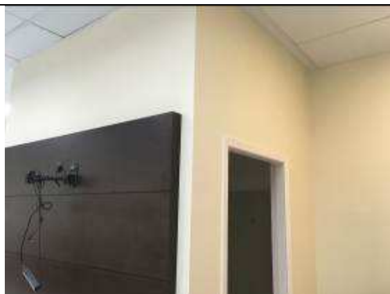
Figura 19C - Divisórias instaladas