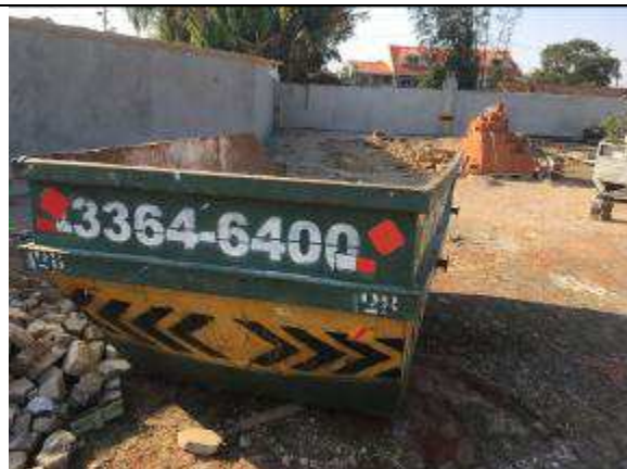
Figura 30C - caçamba para entulho