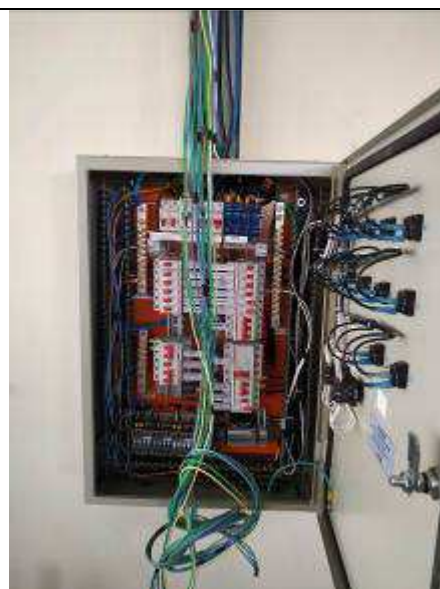
Figura 14E - Quadro elétrico QDL