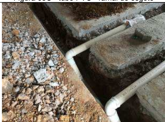
Figura 07C - ramal de esgoto - BWCs Secretaria