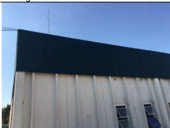
Figura 40C - pintura fachada frontal - área nova - Av. das Nações Unidas