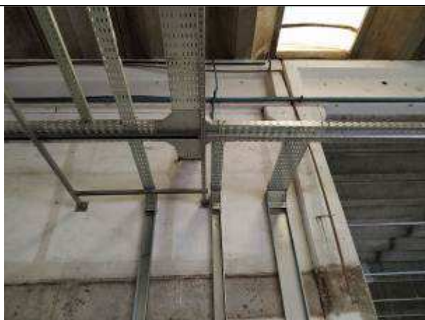
Figura 03E - Infraestrutura 4ª Vara