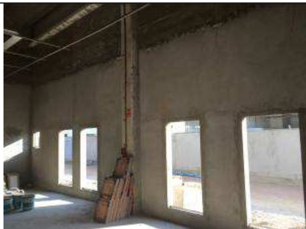
Figura 10C - massa única sobre alvenarias