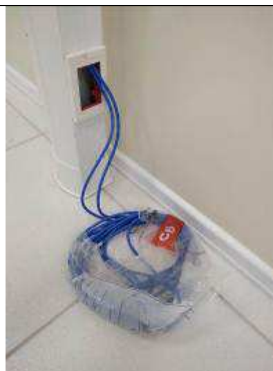
Figura 22E - Patch-cords