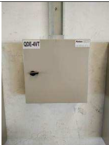
Figura 07E - Quadro elétrico QDE-4VT