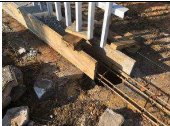
Figura 34C - fôrmas - estrutura de suporte do gradil