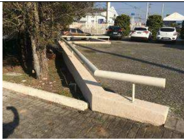
Figura 45C - pintura muretas estacionamento - Rua Joaquim Nabuco