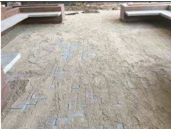
Figura 27C - piso intertravado de concreto - acesso principal