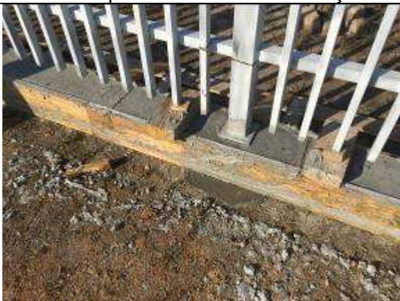
Figura 33C - estrutura de suporte do gradil