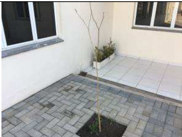
Figura 25C - Plantio de árvore - jardim de acesso à 3ª VT