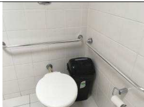
Figura 13C - barras de apoio cromadas