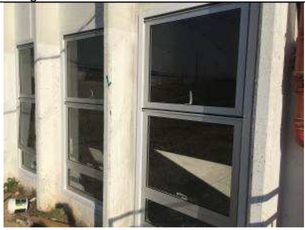
Figura 12C - esquadrias instaladas - vista externa