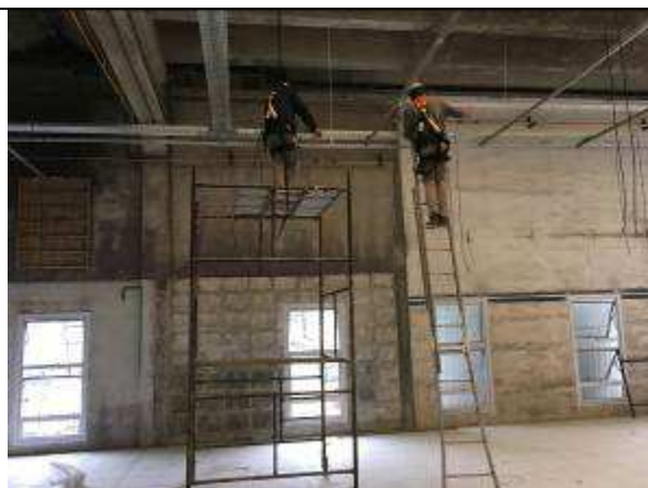
Figura 01C - Andaimes tubulares