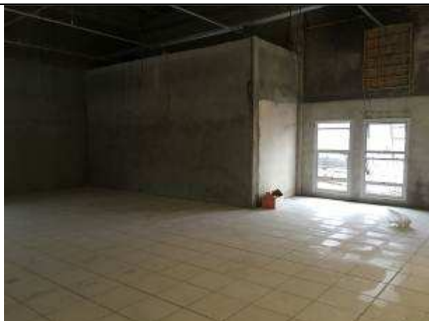
Figura 09C - massa única sobre estruturas