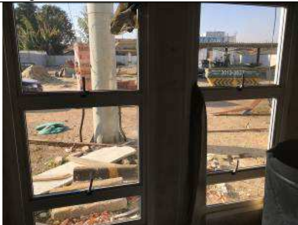
Figura 11C - esquadrias instaladas - vista interna