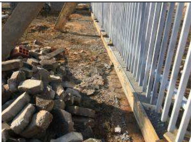
Figura 35C - fôrmas - estrutura de suporte do gradil