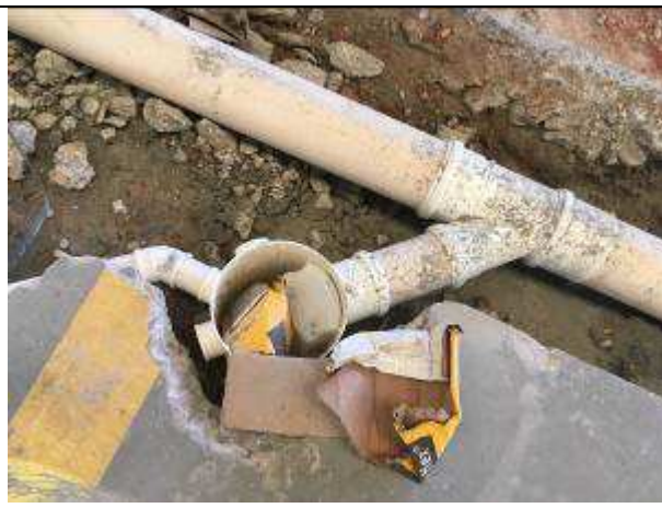
Figura 06C - caixa sifonada