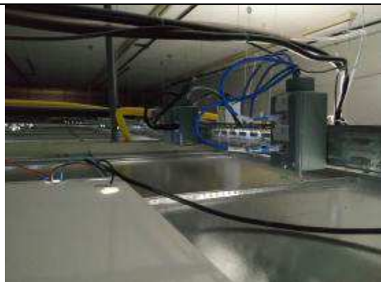
Figura 19E - pontos lógicos (múltiplo uso)