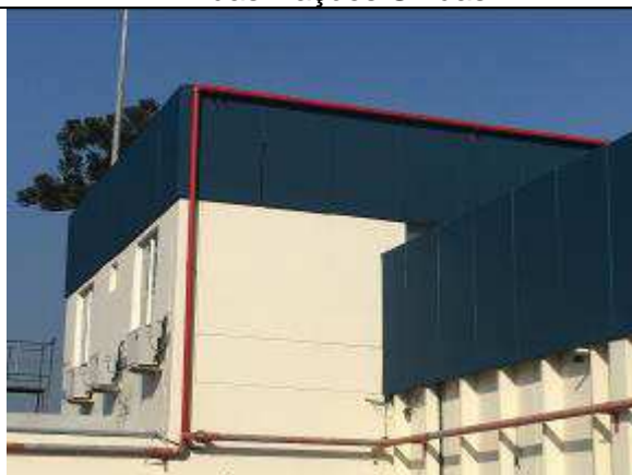
Figura 42C - pintura fachada fundos