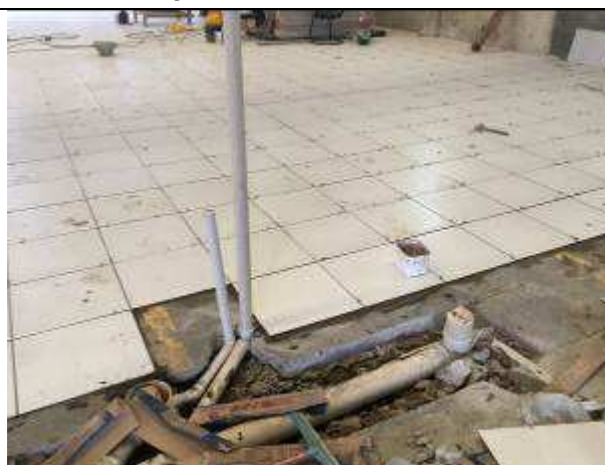
Figura 08C - ramais de esgoto - primários e secundários