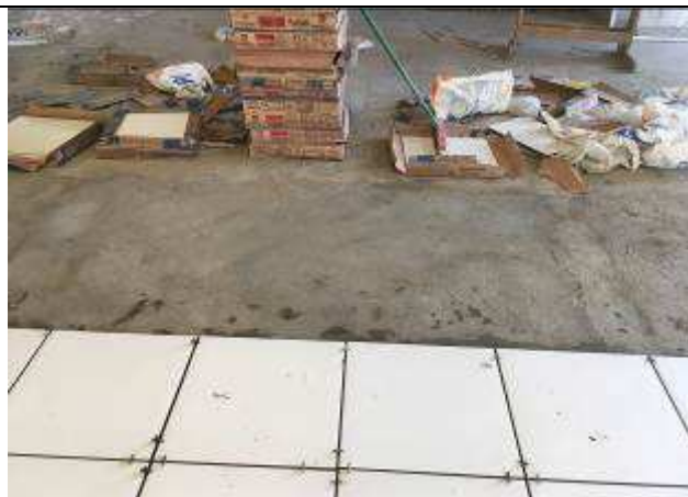
Figura 03C - lastro de concreto sobre vazio da área de pinturas