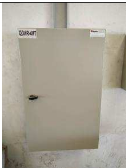
Figura 09E - Quadro elétrico QDAR-4VT