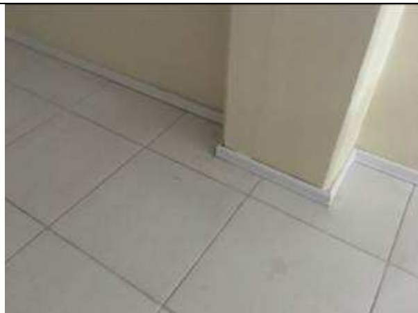
Figura 17C - rodapés