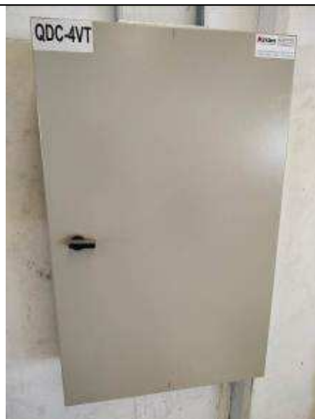
Figura 05E - Quadro elétrico QDC-4VT