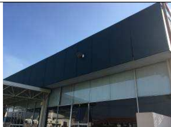
Figura 43C - pintura fachada lateral - Rua Joaquim Nabuco