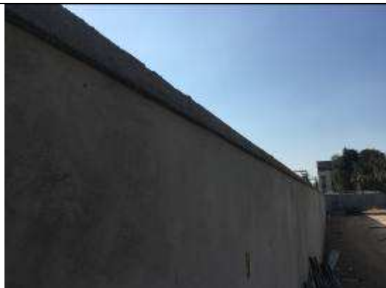
Figura 29C - requadro/pingadeiras - muro lateral esquerda