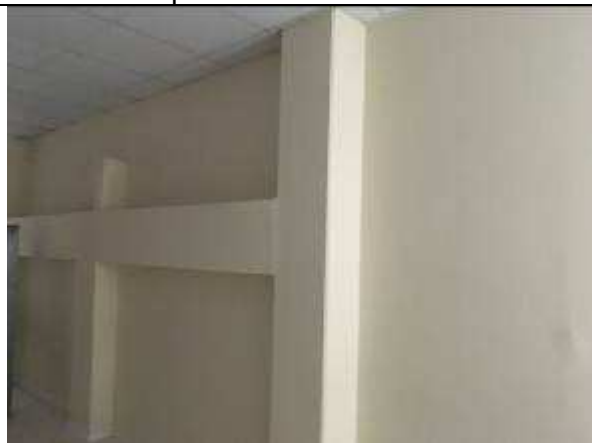
Figura 24C - Pintura interna - PABs