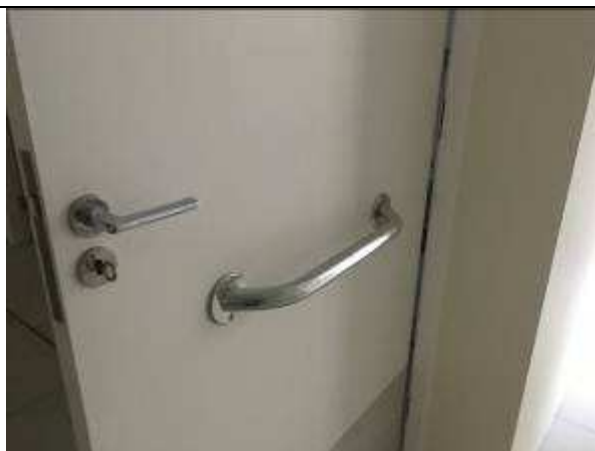
Figura 21C - barra de apoio reto - portas - BWC PABs