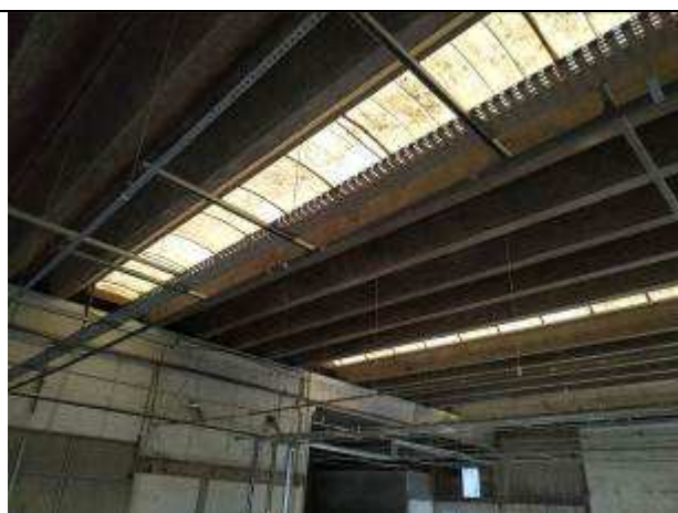
Figura 01E - Infraestrutura 4ª Vara