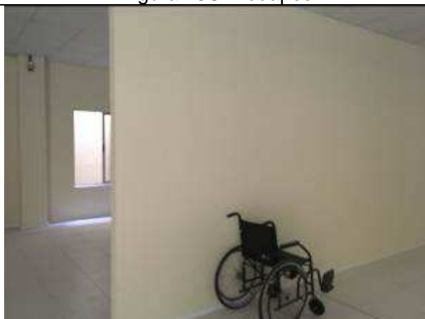
Figura 20C - Divisórias instaladas