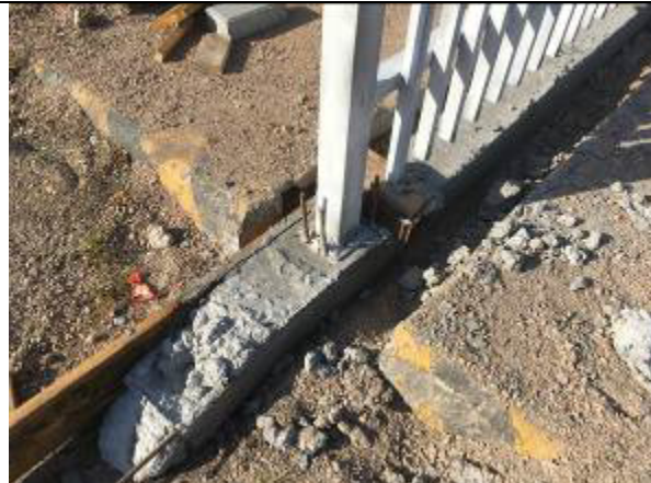
Figura 32C - estrutura de suporte do gradil