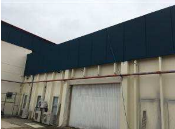
Figura 46C - pintura fachada fundos - área nova