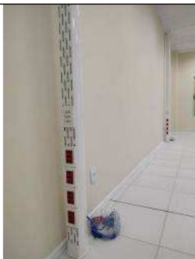
Figura 21E - Patch-cords