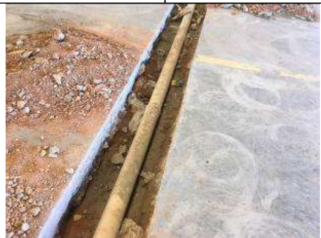
Figura 05C - tubo PVC - ramal de esgoto