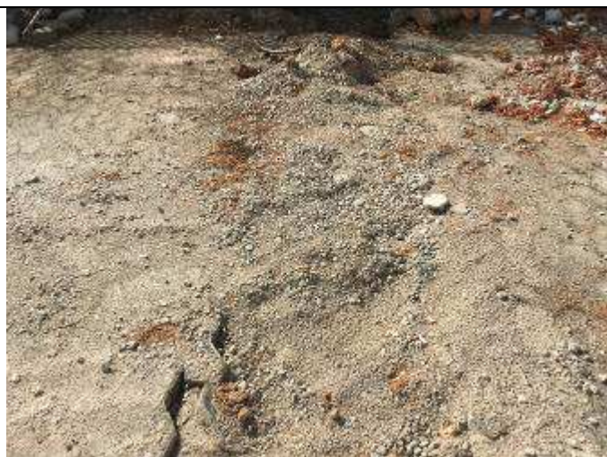
Figura 36C - valas para passagem de tubulação elétrica - estacionamento fundos