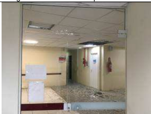
Figura 15C - porta de vidro temperado - balcão de atendimento