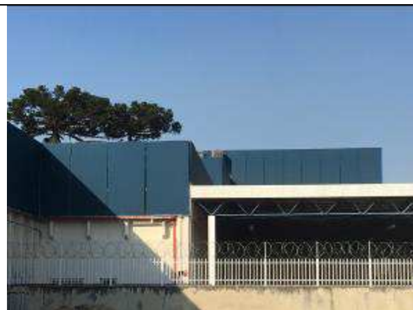
Figura 41C - pintura fachada lateral esquerda