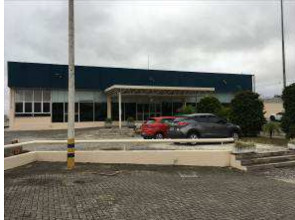
Figura 47C - pintura fachada lateral - Rua Joaquim Nabuco