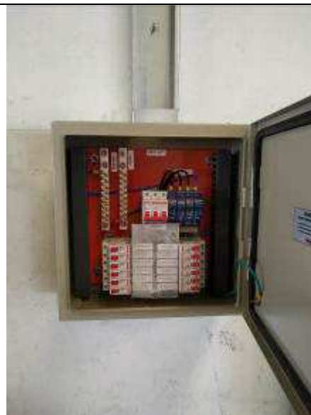
Figura 08E - Quadro elétrico QDE-4VT