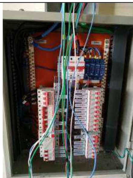
Figura 12E - Quadro elétrico QDC-Hall