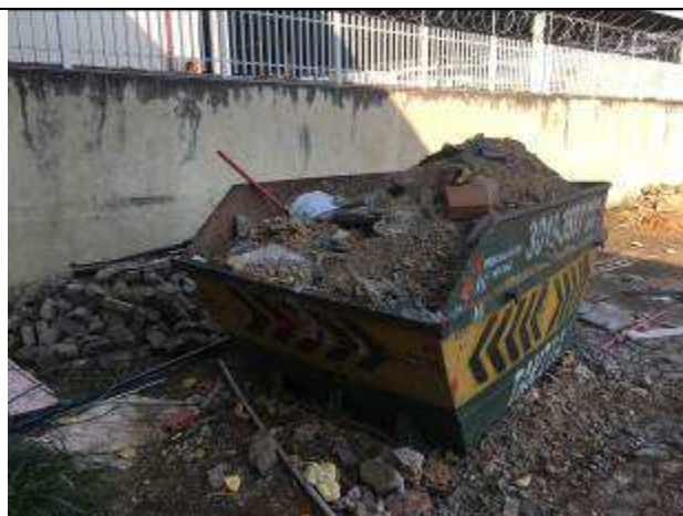
Figura 02C - caçamba de entulho