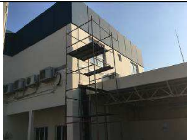
Figura 39C - pintura fachada fundos