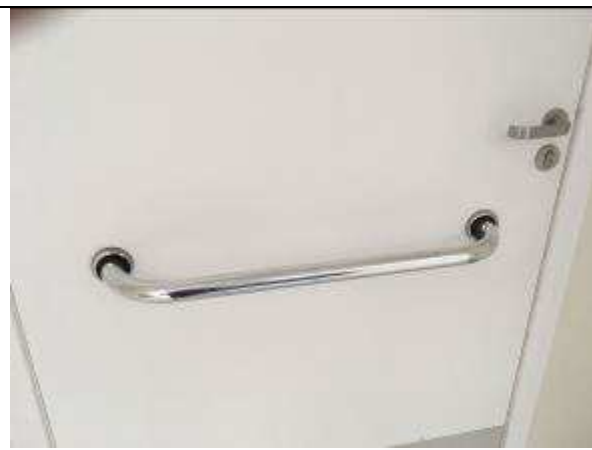
Figura 14C - barra de apoio reto - portas