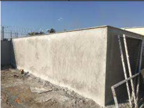
Figura 31C - alvenaria de vedação/requadro superior/pingadeiras - chapisco e massa única - muro que delimita área de serviço