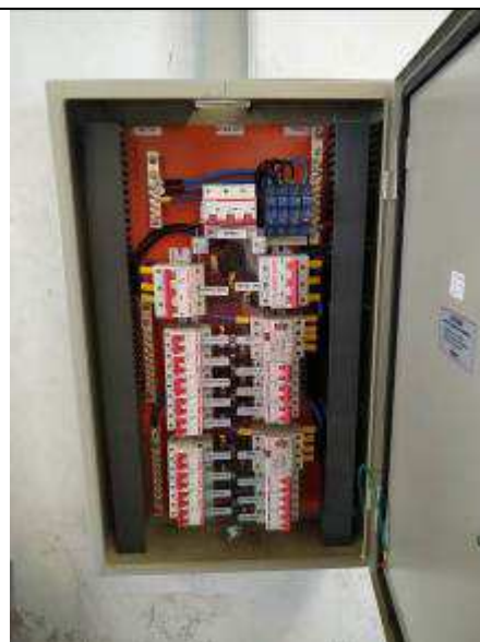
Figura 10E - Quadro elétrico QDAR-4VT