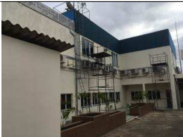
Figura 38C - Pintura fachada fundos