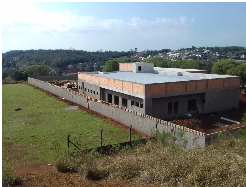
Figura 1 – Vista externa

As imagens a seguir retratam a situação geral do canteiro de obra, após término da etapa atual.