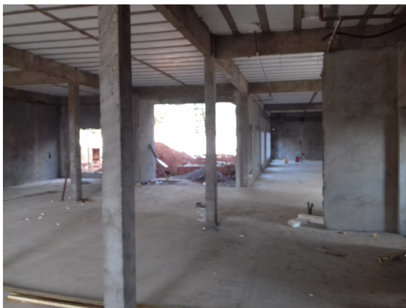
Figura 2 – Vista interna