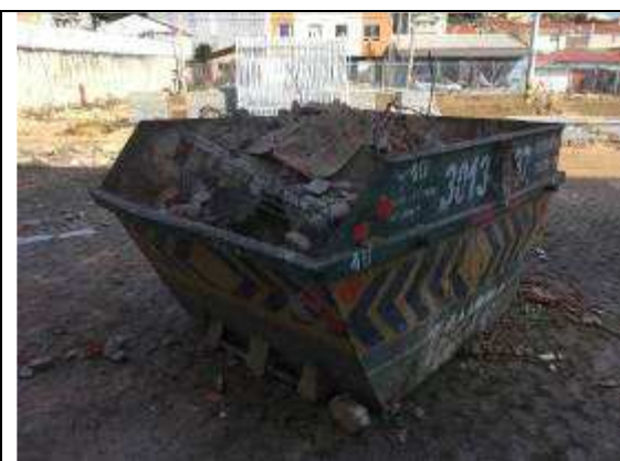
Figura 01C - Caçamba para retirada de entulhos