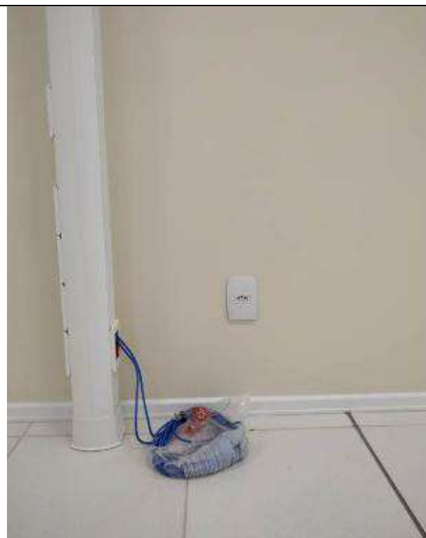
Figura 09E - Tomada elétrica e coluna técnica (sala múltiplo uso)