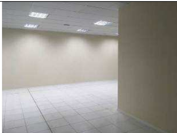
Figura 16C - juntas de dilatação - pisos