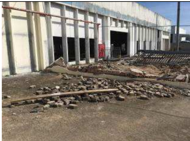
Figura 35C - demolição - muro entre terreno velho e novo