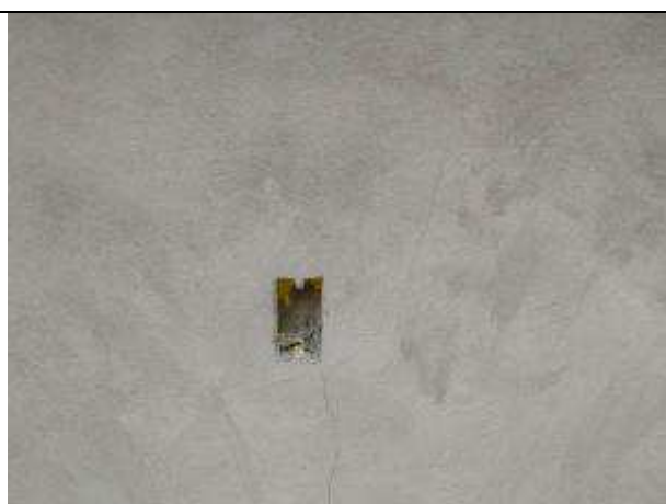
Figura 28E - Infraestrutura para iluminação externa