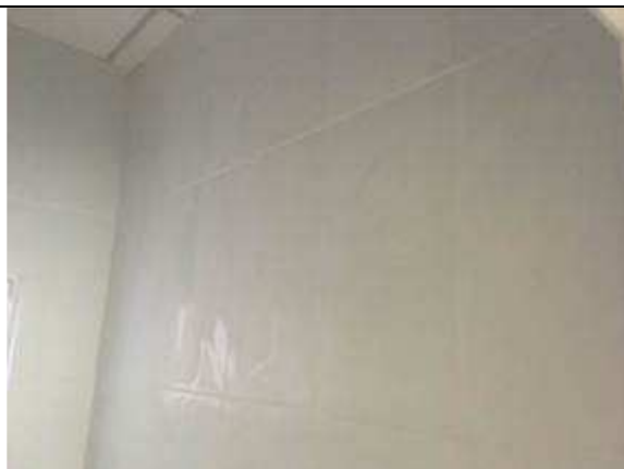
Figura 21C - Azulejos -BWCs PABs