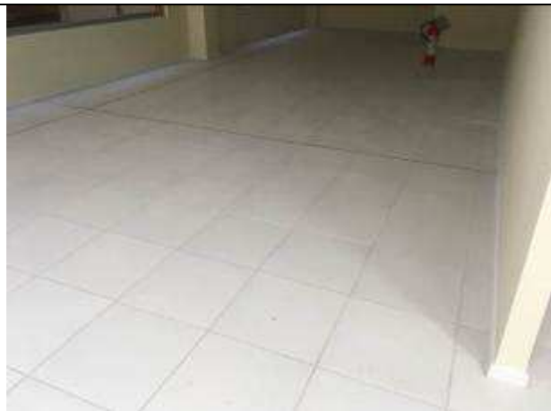
Figura 15C - Pisos cerâmicos - PABs