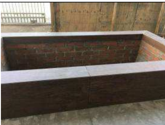
Figura 27C - floreiras de concreto - jardim de acesso ao FT