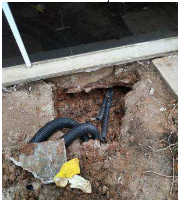
Figura 26E - Nova entrada de telecomunicações - transição para dentro do imóvel