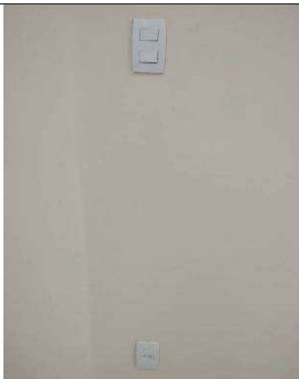
Figura 10E - Interruptores e tomada (OAB)