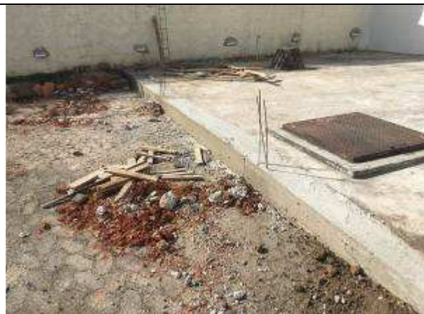
Figura 34C - fundações - muro delimitando área de serviço