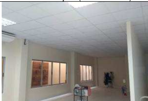
Figura 22E - Espaço reformado para as agências bancárias (anteriormente 4ª Vara)