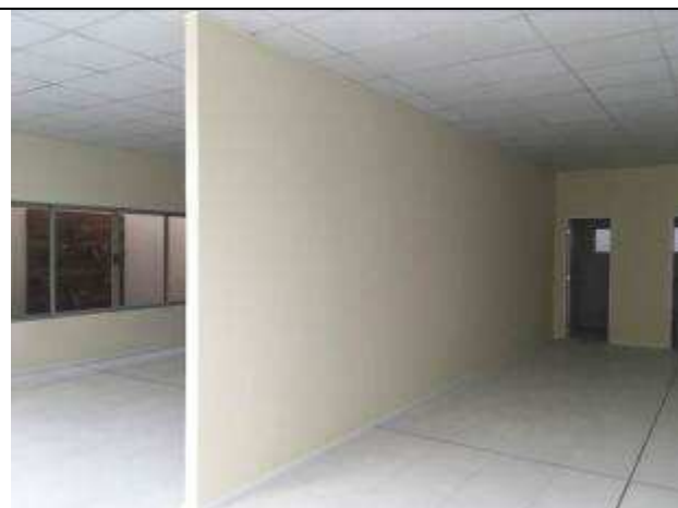
Figura 17C - Divisórias instaladas - PABs