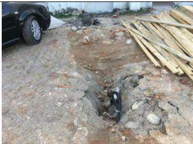
Figura 37C - valas para passagem de tubulação elétrica - estacionamento frente