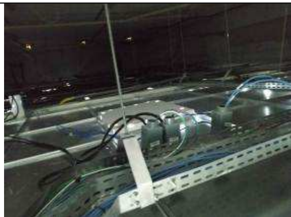
Figura 06E - Cabeamento elétrico e lógico, tomadas lógicas e elétricas genéricas