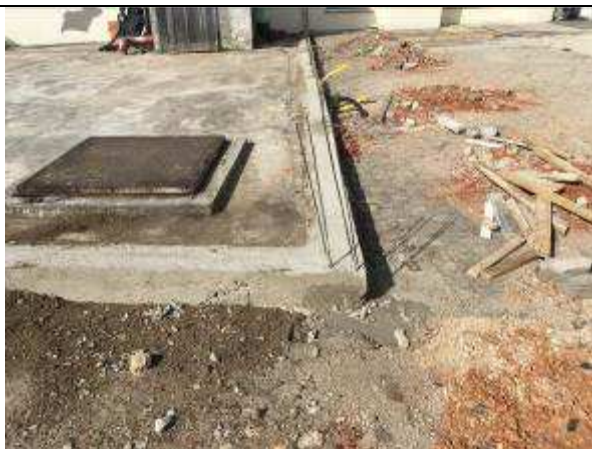
Figura 33C - fundações - muro delimitando área de serviço