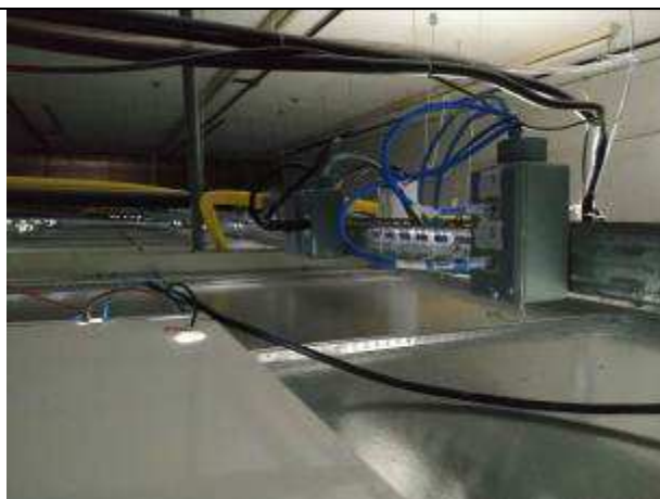
Figura 01E - Infraestrutura elétrica e lógica, tomadas lógicas e elétricas genéricas