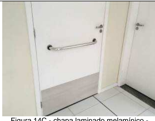
Figura 14C - chapa laminado melamínico - BWC PNEs