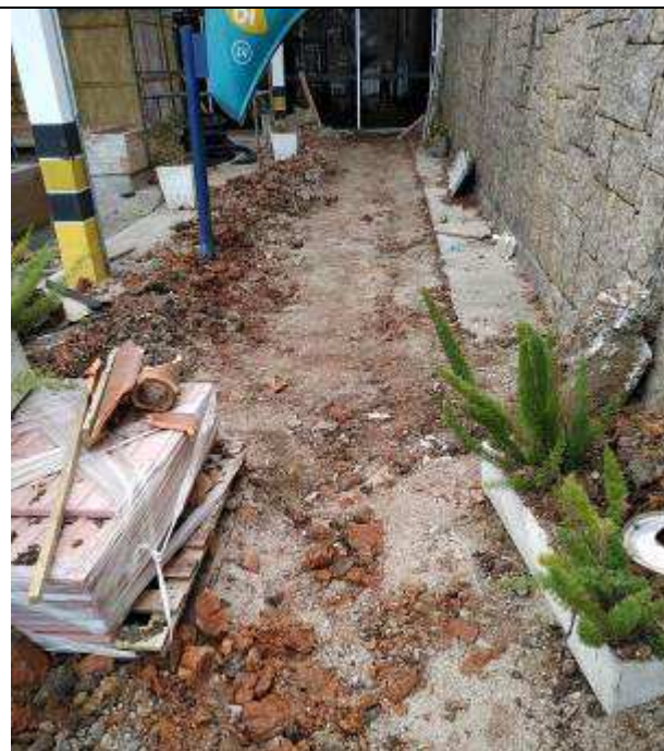
Figura 25E - Nova entrada de telecomunicações - trecho com linha enterrada