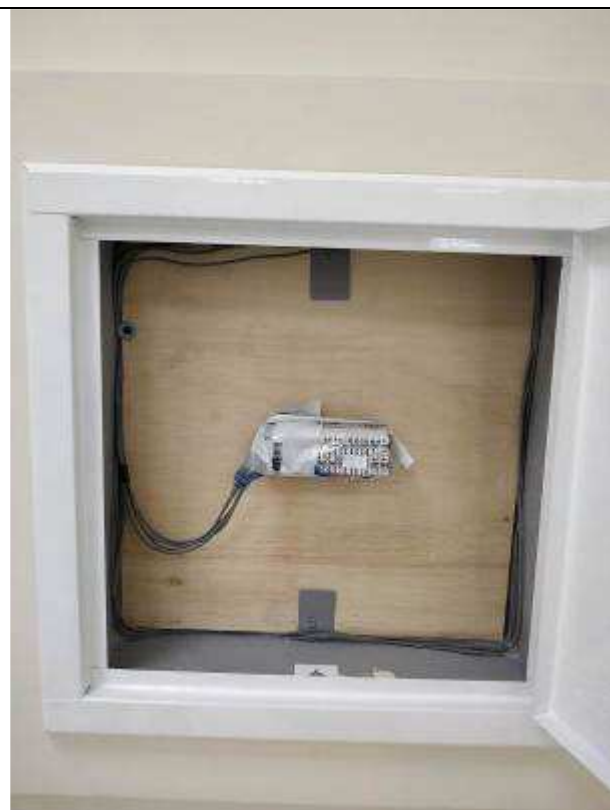
Figura 19E - Quadro de distribuição telefônica (OAB)