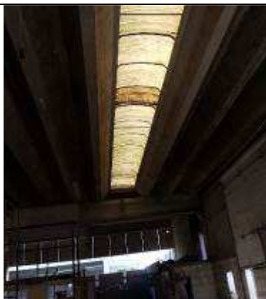
Figura 03C - Cobertura após lavagem