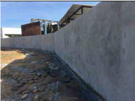
Figura 31C - revestimento massa única - muro lateral esquerda