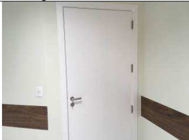
Figura 13C - porta acústica - sala de audiências