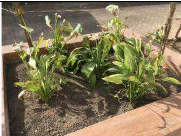
Figura 25C - Plantio de arbustos - jardim de acesso à 3ª VT