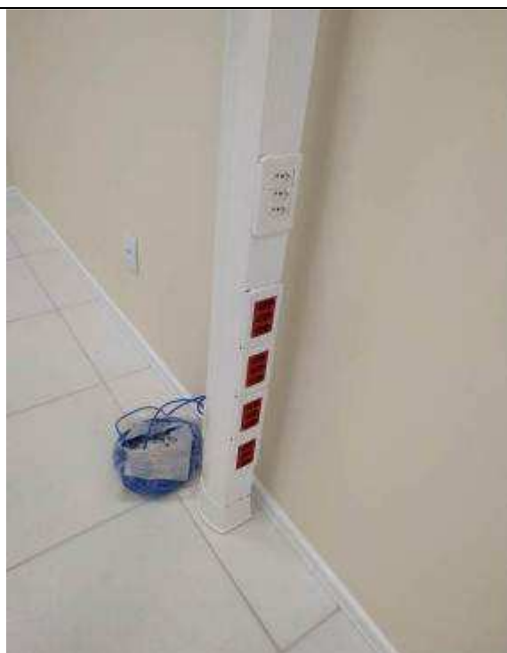
Figura 12E - Coluna técnica (sala múltiplo uso)