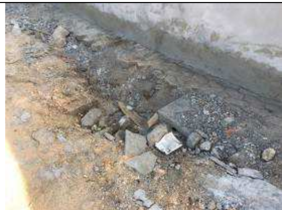
Figura 28C - demolição de pavimento - muro lateral esquerda