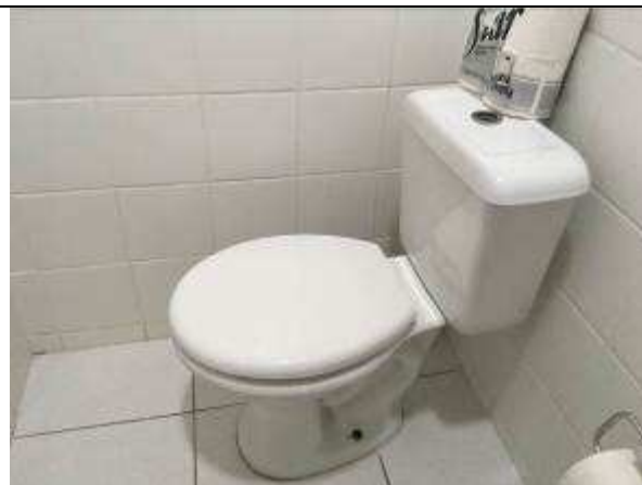
Figura 10C - Vaso reinstalado