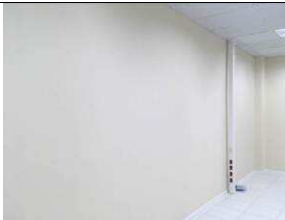
Figura 24C - Pintura interna