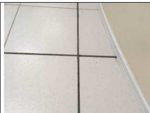
Figura 08C - juntas - Pisos