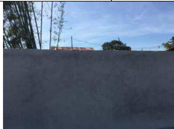
Figura 32C - revestimento massa única - muro fundos divisa