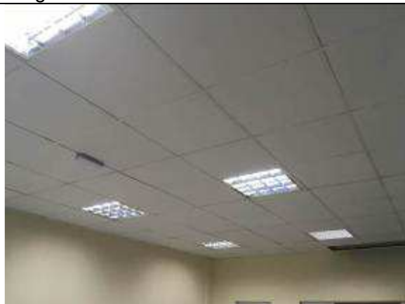
Figura 19C - Forros instalados - hall público