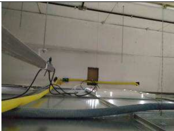
Figura 04E - Infraestrutura elétrica e lógica