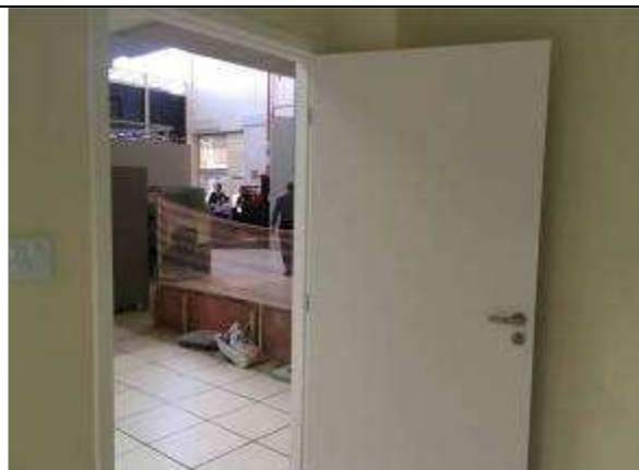
Figura 22C - Portas de madeira compensada lisa