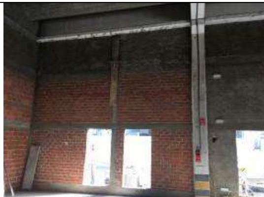
Figura 06C - fechamentos em alvenaria