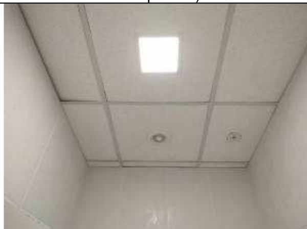
Figura 16E - Painel LED 12 W, sensor de presença e exaustor (OAB)