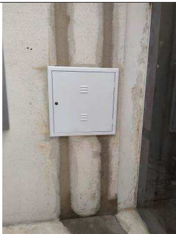
Figura 20E - Novo distribuidor geral de telecomunicações (Hall de entrada)