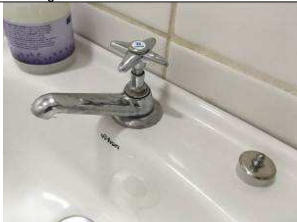
Figura 11C - metais reinstalados