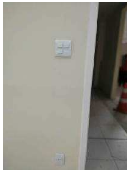
Figura 14E - Interruptores e tomada (sala múltiplo uso)