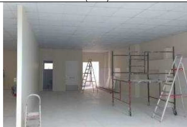
Figura 21E - Espaço reformado para as agências bancárias (anteriormente 4ª Vara)