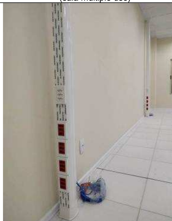
Figura 11E - Colunas técnicas (sala múltiplo uso)