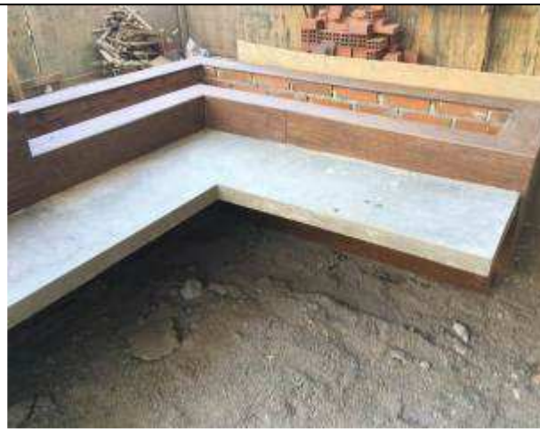
Figura 26C - bancos de concreto - jardim de acesso ao FT