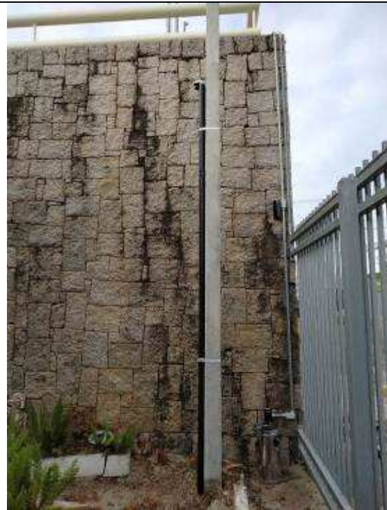
Figura 23E - Nova entrada de telecomunicações