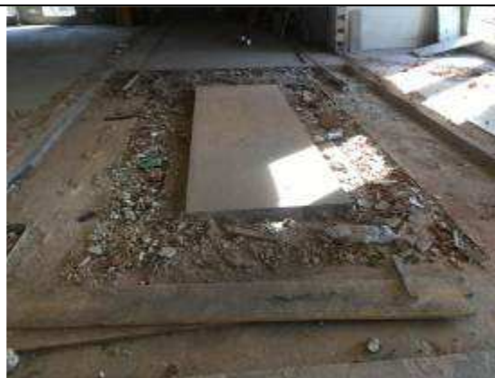
Figura 04C - reaterro, área de manutenção de veículos