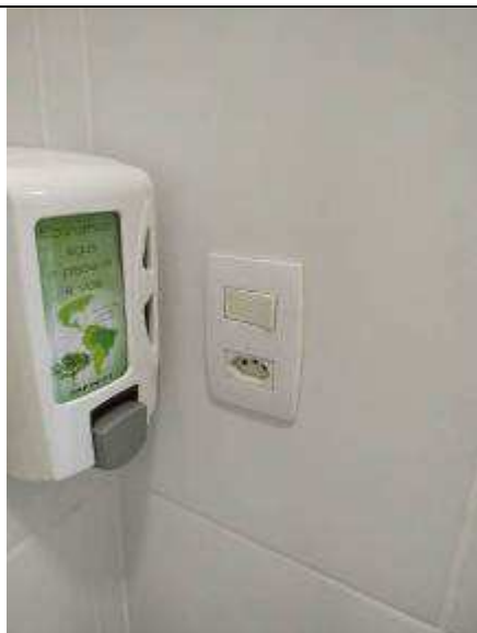
Figura 13E - Interruptor e tomada (OAB)