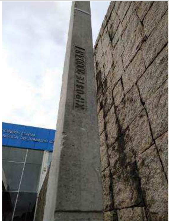
Figura 24E - Poste da nova entrada de telecomunicações