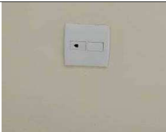
Figura 08E - Ponto telefônico (OAB)