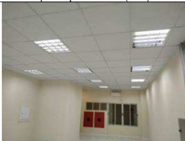
Figura 18E - Iluminação LED (4 x 9W) - OAB