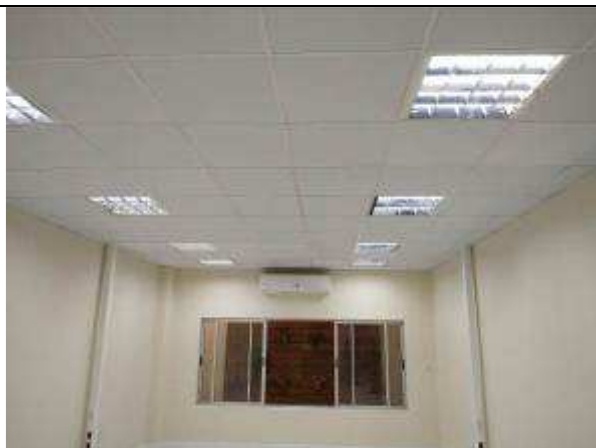
Figura 15E - Iluminação LED (4 x 9W) - sala múltiplo uso