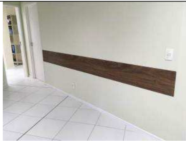
Figura 12C - bate macas - salas de audiência