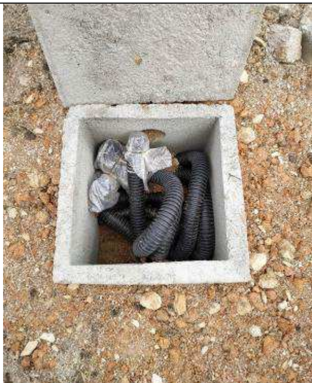
Figura 30E - Infraestrutura para iluminação externa