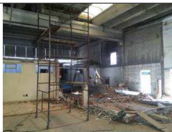
Figura 02C - Andaimos torre