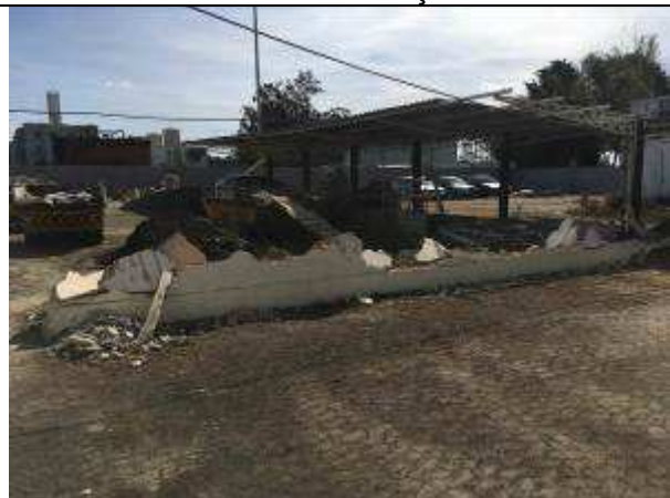
Figura 36C - demolição - muro entre terreno velho e novo