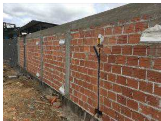
Figura 27E - Infraestrutura para iluminação externa