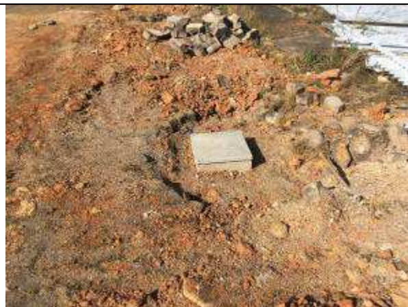
Figura 38C - valas para passagem de tubulação elétrica e caixas de passagem - estacionamento frente