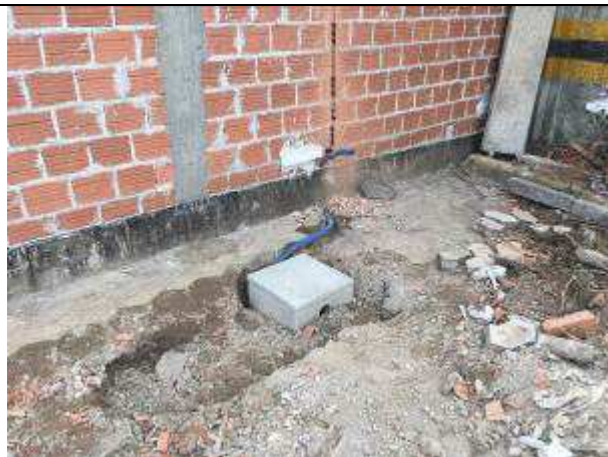
Figura 32E - Infraestrutura para iluminação externa