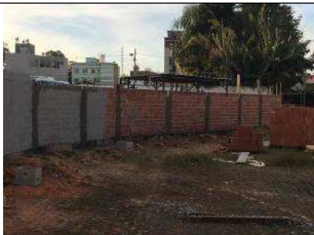
Figura 29C - estrutura - muro lateral esquerda