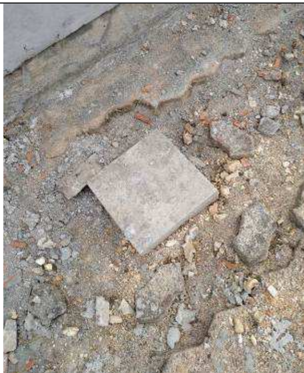
Figura 29E - Infraestrutura para iluminação externa