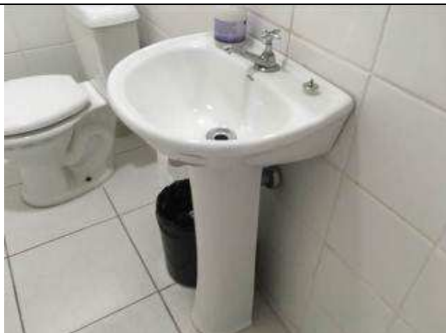
Figura 09C - Lavatórios reinstalados