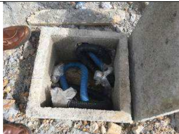
Figura 31E - Infraestrutura para iluminação externa