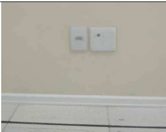
Figura 07E - Tomada elétrica e ponto telefônico (OAB)