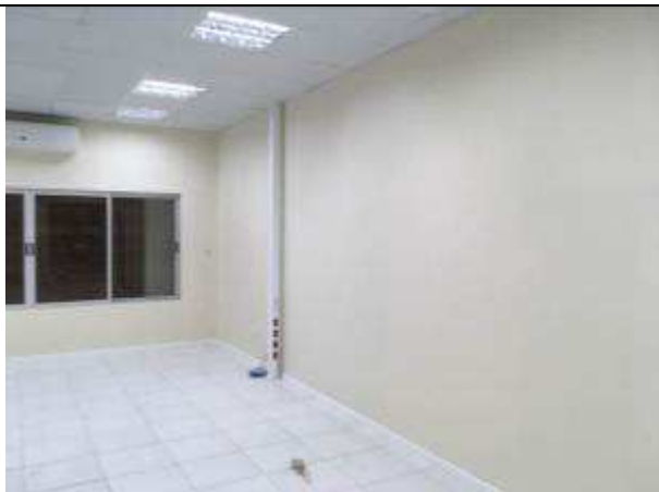
Figura 23C - Pintura interna