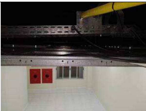
Figura 02E - Infraestrutura elétrica e lógica