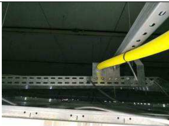
Figura 05E - Infraestrutura elétrica e lógica