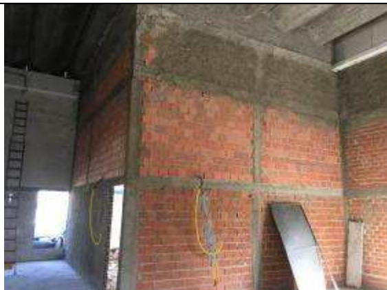
Figura 05C - Estrutura - novos sanitários