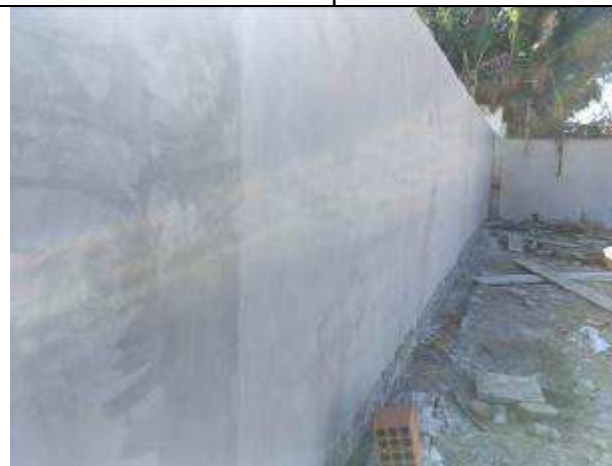
Figura 30C - revestimento massa única - muro lateral esquerda