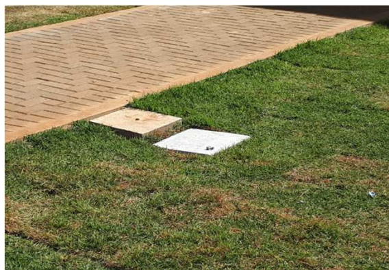
Figura 04E: caixas 30x30 e cabeamento 2,5mm 2 e 4mm 2 1kV externo - fundos