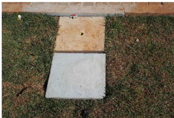
Figura 05E: caixas 30x30 e cabeamento 2,5mm 2 e 4mm 2 1kV externo - fundos