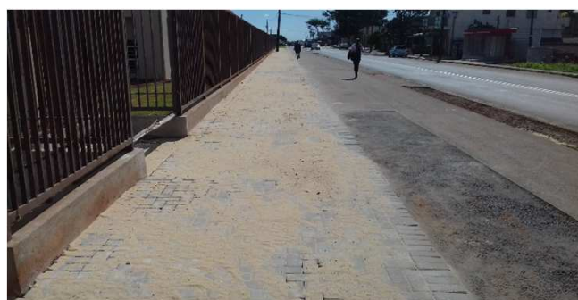
Figura 07C: Piso intertravado de concreto - Passeio Público