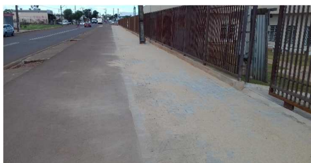
Figura 08C: Piso intertravado de concreto - Passeio Público