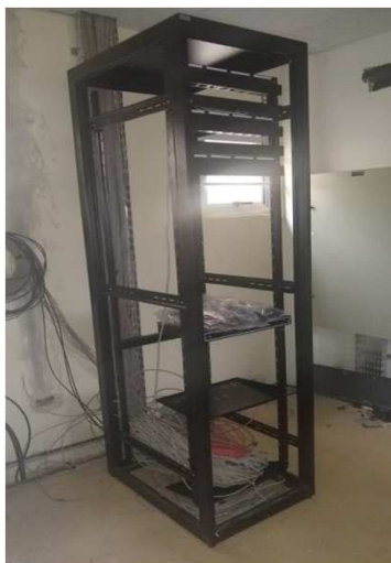
Fig 24E: Racks, patch panel, DIO, patch cords