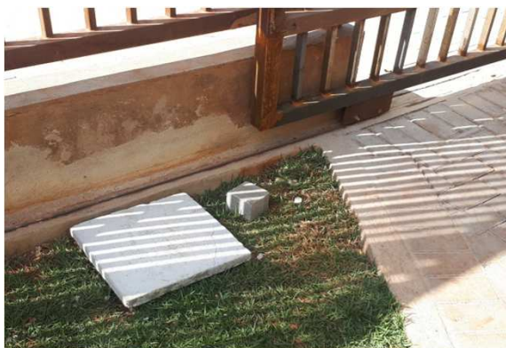
Figura 13E: caixas 30x30 e cabeamento 2,5mm 2 e 4mm 2 1kV externo - central