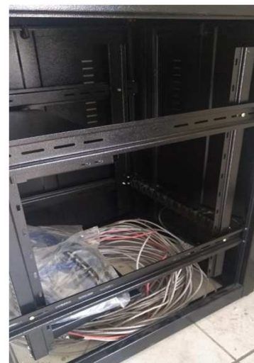
Fig 37E: Racks, patch panel, DIO, patch cords