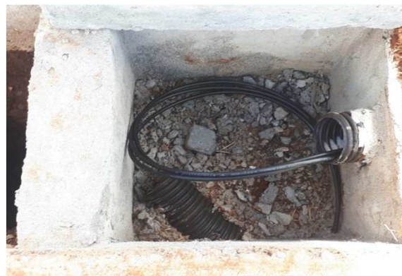
Figura 12E: caixas 30x30 e cabeamento 2,5mm 2 e 4mm 2 1kV externo - fundos