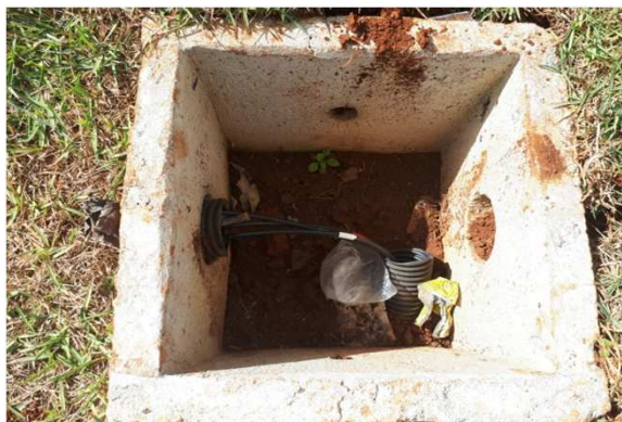
Figura 17E: caixas 30x30 e cabeamento 2,5mm 2 e 4mm 2 1kV externo - frente