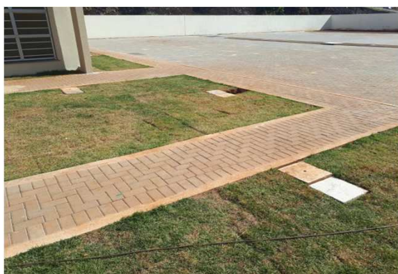
Figura 15E: caixas 30x30 e cabeamento 2,5mm 2 e 4mm 2 1kV externo - frente