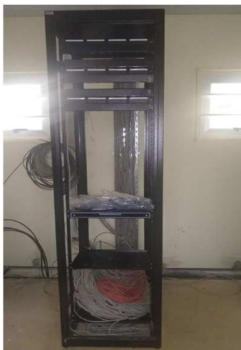
Fig 30E: Racks, patch pannel, DIO, patch cords