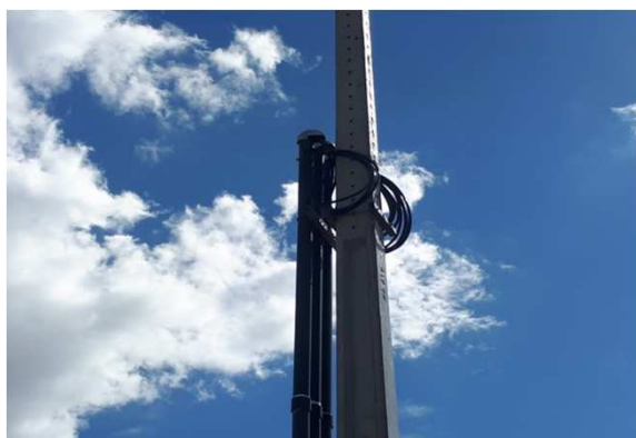
Figura 01E: entrada de energia - cabos 95mm 2