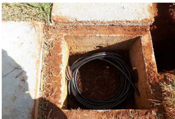
Figura 19E: cabeamento UTP cat6 externo CFTV