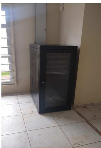
Fig 33E: Racks, patch pannel, DIO, patch cords