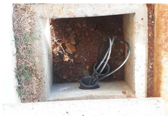
Figura 10E: caixas 30x30 e cabeamento 2,5mm 2 e 4mm 2 1kV externo - fundos