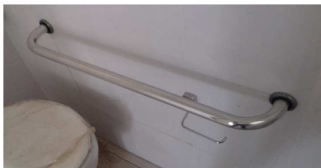
Figura 02C: Detalhe de barra de apoio para bacia sanitária