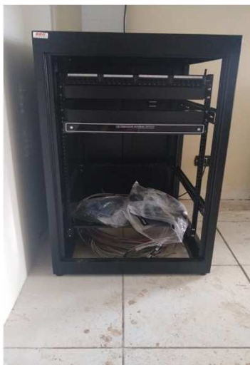
Fig 36E: Racks, patch panel, DIO, patch cords