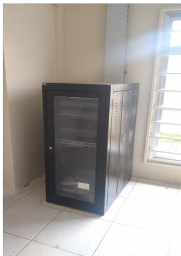
Fig 29E: Racks, patch pannel, DIO, patch cords