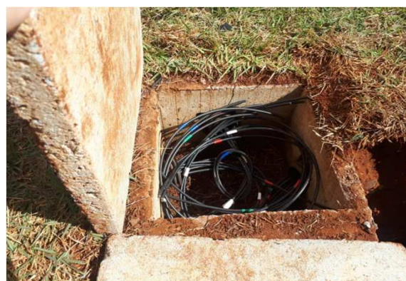
Figura 16E: caixas 30x30 e cabeamento 2,5mm 2 e 4mm 2 1kV externo - frente