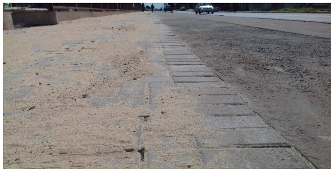
Figura 09C: Detalhe do Paver