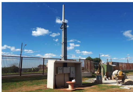
Figura 02E: entrada de energia - cabos 95mm 2