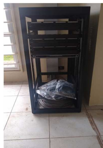
Fig 34E: Racks, patch pannel, DIO, patch cords