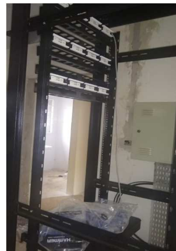
Fig 31E: Racks, patch pannel, DIO, patch cords