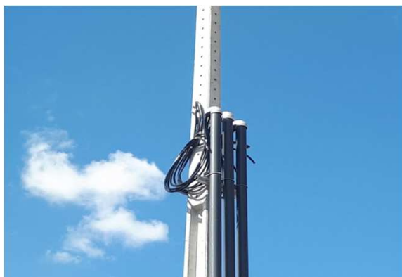
Figura 03E: entrada de energia - cabos 95mm 2