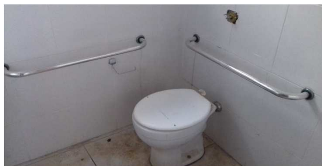
Figura 06C: Barras de apoio para bacia sanitária - Sanitário Masculino Distribuição