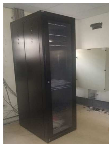
Fig 22E: Racks, patch pannel, DIO, patch cords