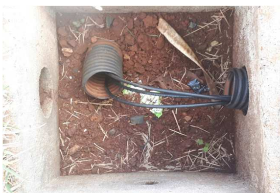
Figura 09E: caixas 30x30 e cabeamento 2,5mm 2 e 4mm 2 1kV externo - fundos