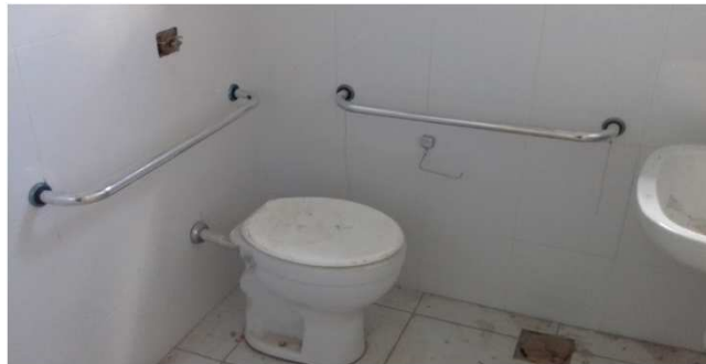
Figura 04C: Barras de apoio para bacia sanitária - Sanitário Feminino da 1a Vara