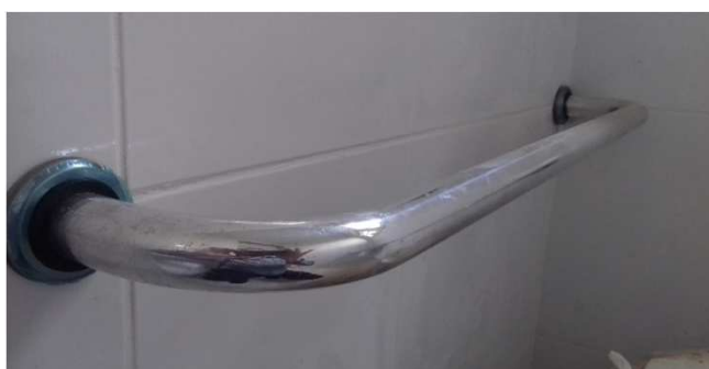
Figura 01C: Detalhe de barra de apoio para bacia sanitária