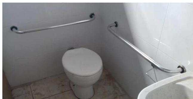
Figura 05C: Barras de apoio para bacia sanitária - Sanitário Feminino da 2a Vara