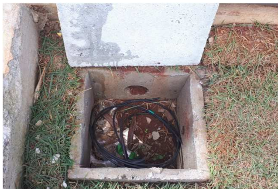
Figura 07E: caixas 30x30 e cabeamento 2,5mm 2 e 4mm 2 1kV externo - fundos