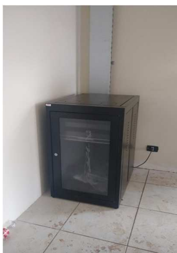
Fig 32E: Racks, patch pannel, DIO, patch cords