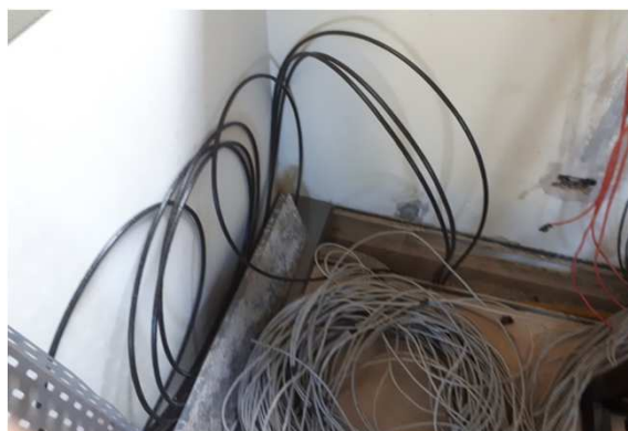
Figura 20E: cabeamento UTP cat6 externo CFTV