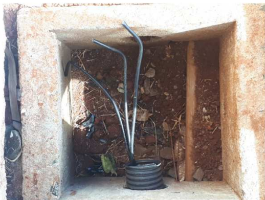
Figura 11E: caixas 30x30 e cabeamento 2,5mm 2 e 4mm 2 1kV externo - fundos