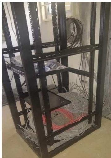
Fig 23E: Racks, patch panel, DIO, patch cords