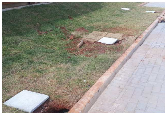
Figura 06E: caixas 30x30 e cabeamento 2,5mm 2 e 4mm 2 1kV externo - fundos