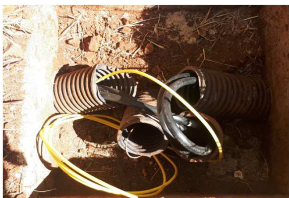
Figura 21E: cabeamento UTP cat6 externo CFTV