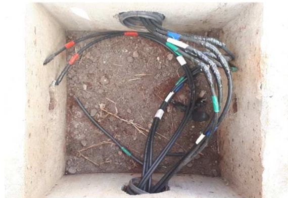
Figura 14E: caixas 30x30 e cabeamento 2,5mm 2 e 4mm 2 1kV externo - central