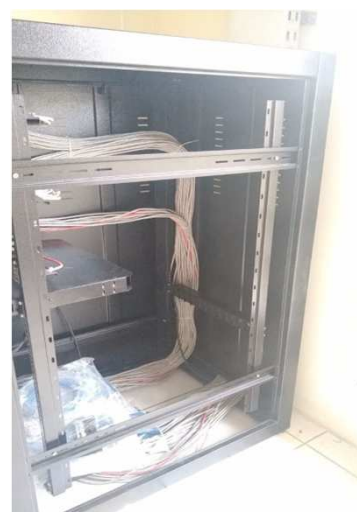
Fig 28E: Racks, patch panel, DIO, patch cords