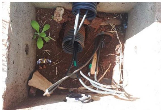
Figura 08E: caixas 30x30 e cabeamento 2,5mm 2 e 4mm 2 1kV externo - fundos