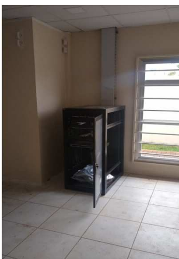
Fig 27E: Racks, patch panel, DIO, patch cords