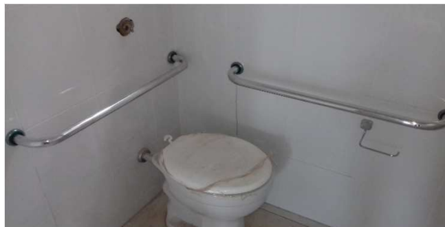
Figura 03C: Barras de apoio para bacia sanitária - Sanitário público