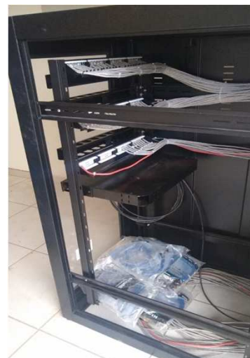
Fig 25E: Racks, patch panel, DIO, patch cords