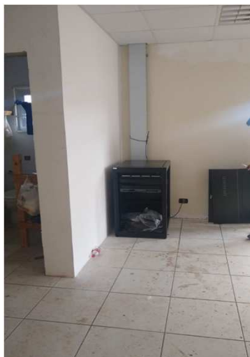
Fig 35E: Racks, patch panel, DIO, patch cords