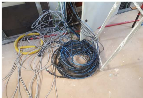
Figura 18E: cabeamento 2,5mm 2 e 4mm 2 1kV externo - quadro elétrico sala técnica