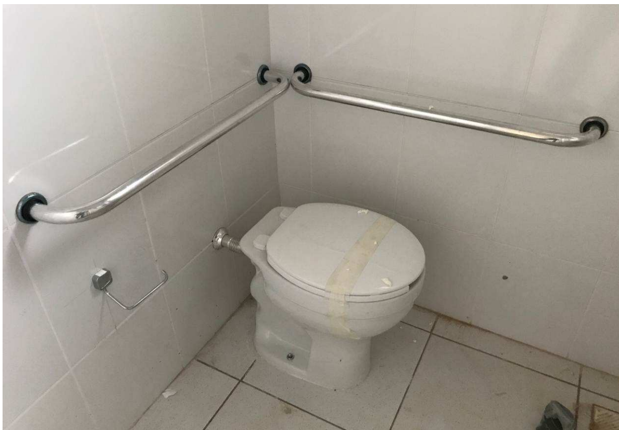
Figura 5 – Fórum - Vista interna - Banheiros.