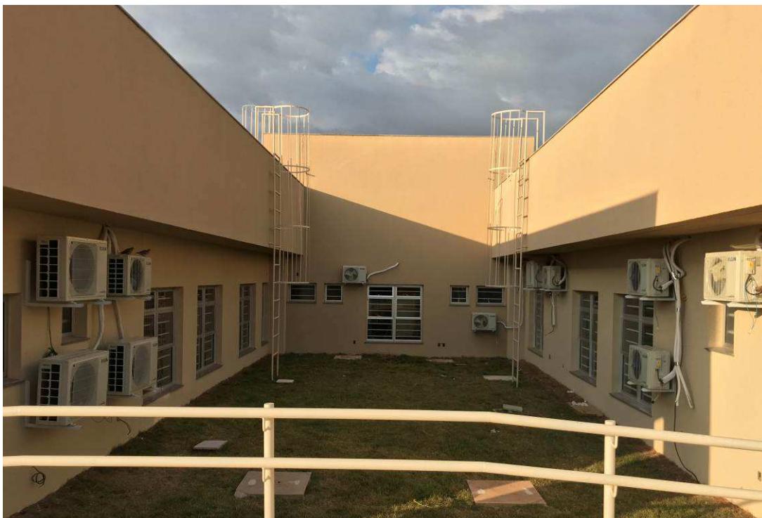
Figura 2 – Fórum - Vista externa - Fundos.