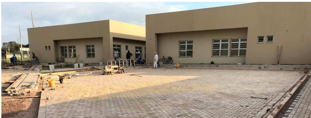
Figura 1 – Fórum - Vista externa - Frente.