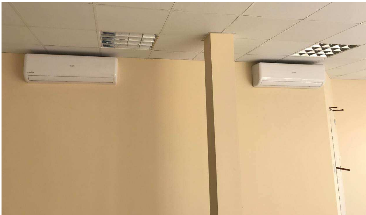
Figura 4 – Fórum - Vista interna - Evaporadoras dos equipamentos split.