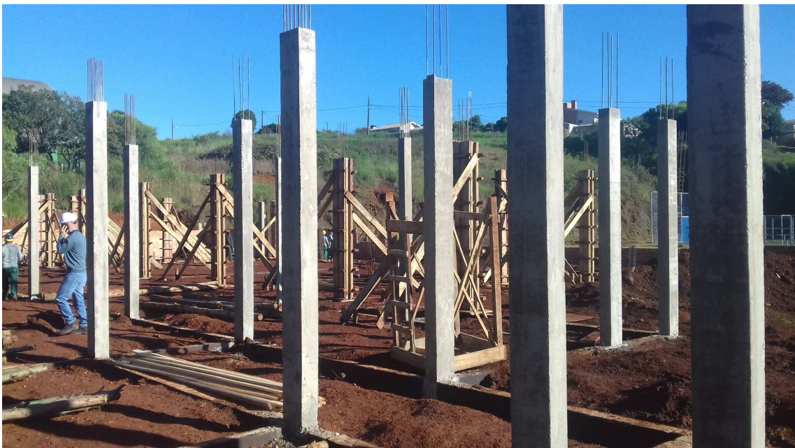
Figura 2 – Execução de pilares