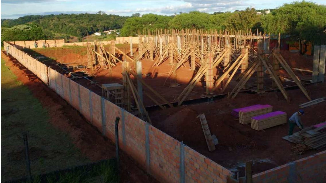
Figura 1 – Visão geral da obra

As imagens abaixo retratam a situação geral do canteiro de obra, após término da etapa atual.