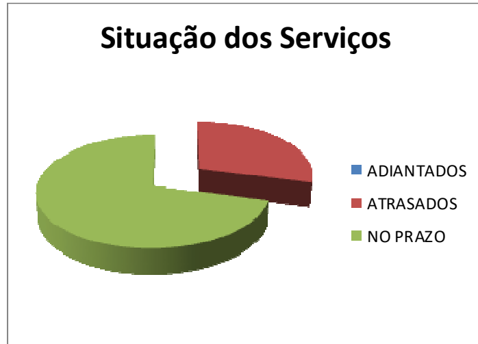
Gráfico 1.

O Gráfico 1, abaixo, mostra a quantidade de itens adiantados, atrasados e dentro do prazo, em relação à etapa atual, tendo em vista o cronograma vigente da obra.