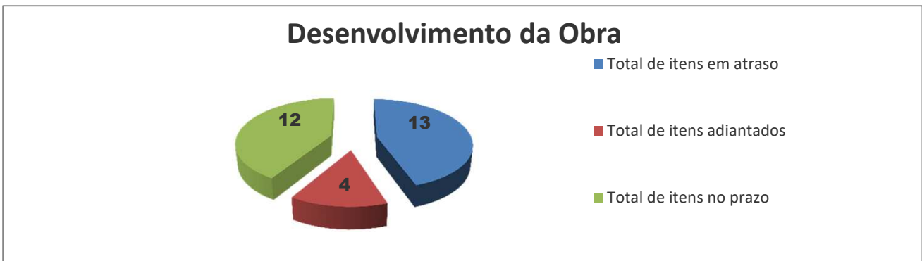
Comparativo mensal (Previsto x Executado)