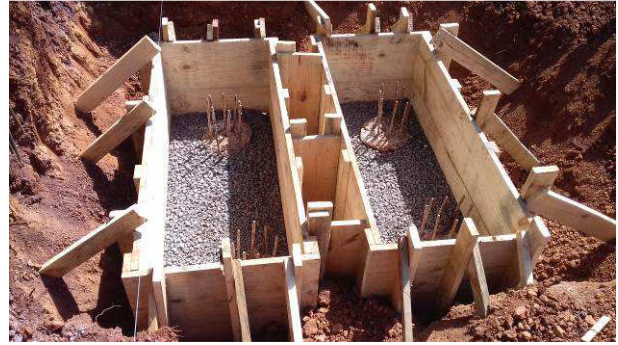
Figura 10C: Dois blocos para duas estacas tendo suas fôrmas montadas (B57 e B59)