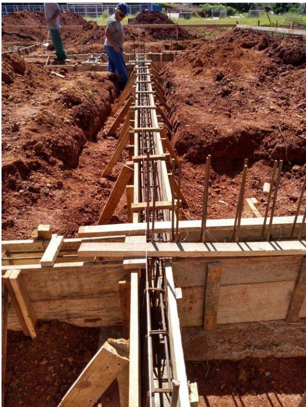
Figura 29C: Fôrmas e armaduras das vigas V52 (vertical) e V20 (horizontal)