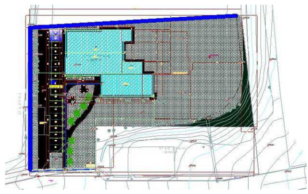
Figura 48C: Perímetro de muro onde foi executada a perfuração e concretagem das estacas, nesta etapa