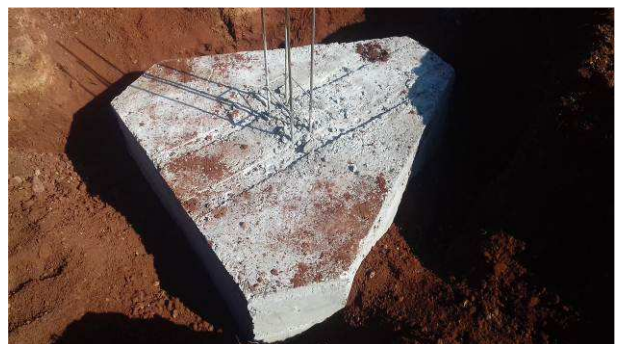
Figura 26C: Bloco B56, após a desforma