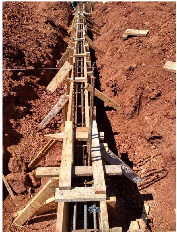
Figura 30C: Fôrmas e armaduras da viga V14