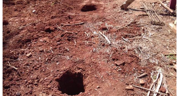
Figura 44C: Brocas já perfuradas na divisa lateral esquerda