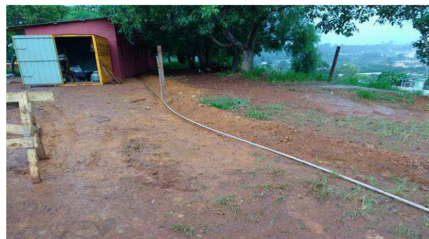
Figura 04C: Rede alimentadora do barraco de obra