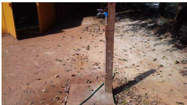
Figura 03C: Alimentação de água