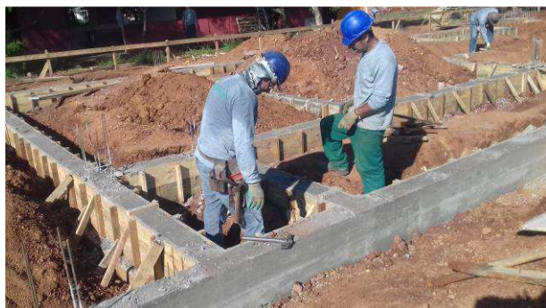
Figura 41C: Operários realizando a desforma das vigas V16 (já desformada), V17, V50 (entre os operários) e V52 (a esquerda)