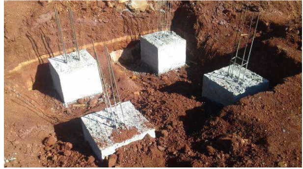
Figura 28C: Blocos B23, B24, B25 e B26, após a desforma