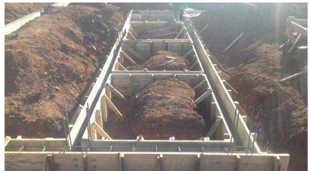
Figura 34C: Fôrmas das vigas V11 (vertical, a direita), V12 (vertical, a esquerda), V40, V43, V45, V47 e V49 (horizontais, de cima para baixo, respectivamente)