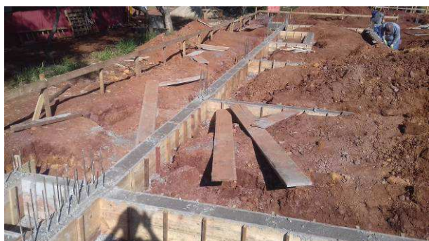
Figura 37C: Vigas V20 (maior), V52 (horizontal, inferior), V48 (horizontal, central), V44, V39 e V35 (na sequência, horizontal, de baixo para cima)