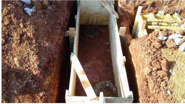
Figura 09C: Fôrma de bloco para 2 estacas, sendo confeccionada (B21)