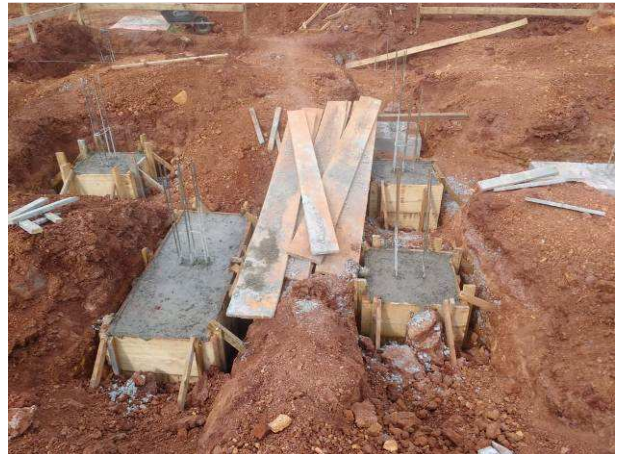
Figura 22C: Blocos B13 (maior), B12, B14, B15 e B16, após concretagem