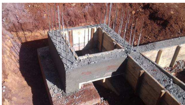
Figura 38C: Vigas V20, V28, V29 e V30, em processo de desforma