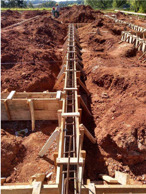
Figura 31C: Fôrmas e armaduras das vigas V18 (centro), V32 (esquerda), V30 (abaixo) e V20 (canto superior direito)