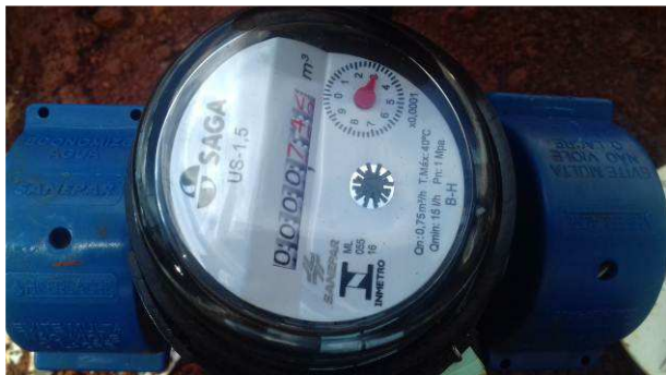
Figura 01C: Hidrômetro