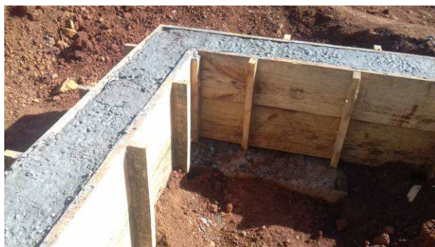
Figura 35C: Detalhe de uma viga após a concretagem