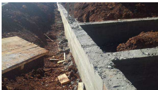
Figura 40C: Vigas V12, V11, V45 e V47, após o processo de desforma