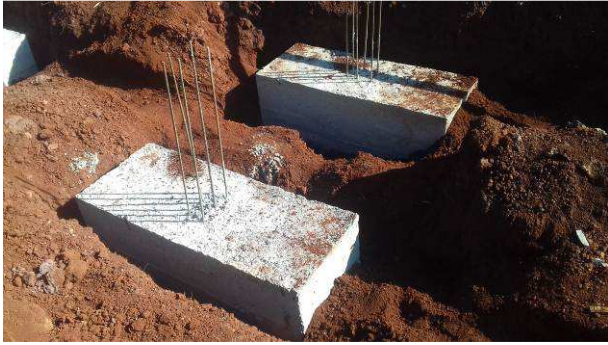
Figura 27C: Blocos B53 e B60, após a desforma