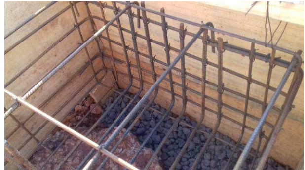
Figura 16C: Armaduras do bloco B55