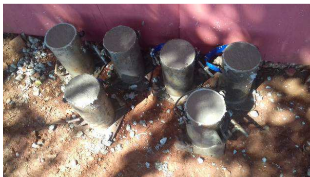
Figura 42C: Retirada de corpos de prova para ensaio de rompimento do concreto das baldramas