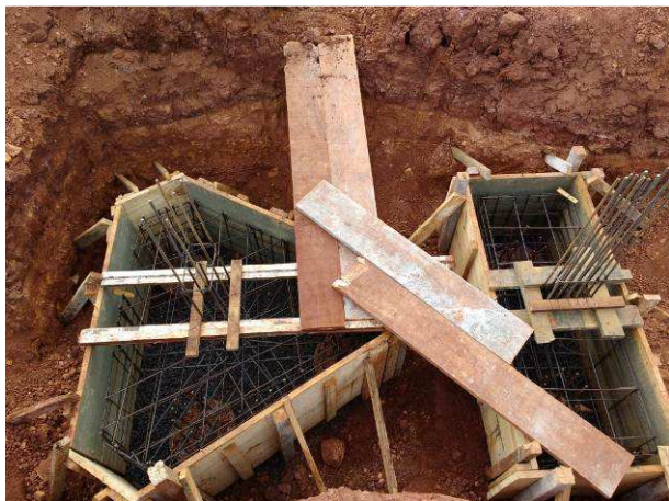
Figura 13C: Fôrma e armadura para bloco de 3 estacas (esquerda, B30) e 2 estacas (direita, B33)