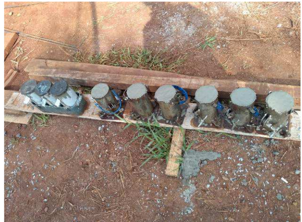
Figura 24C: Corpos de prova retirados durante a concretagem (à esquerda pela usina e à direita pela contratada)