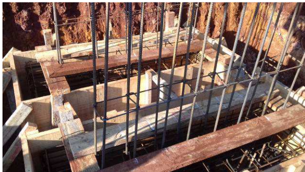
Figura 17C: Armaduras e arranques dos blocos B52 e B58