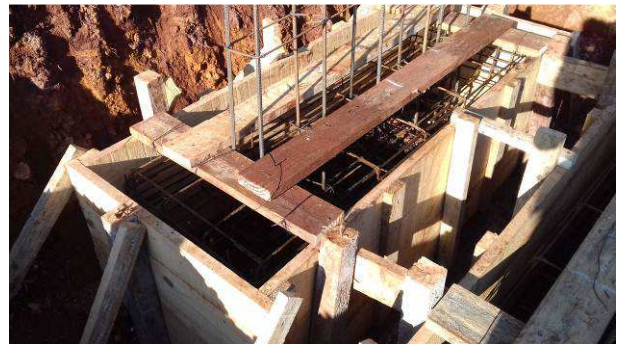
Figura 18C: Armaduras e arranques do bloco B59