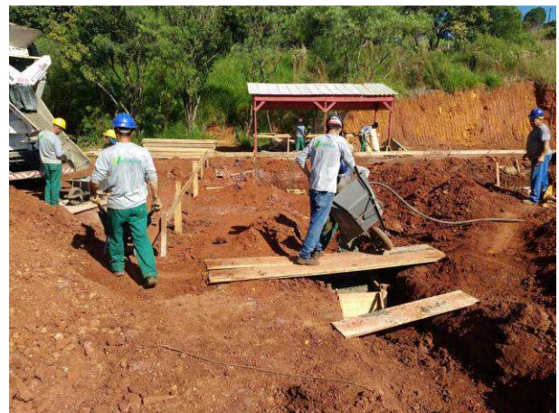
Figura 20C: Concretagem do bloco B38