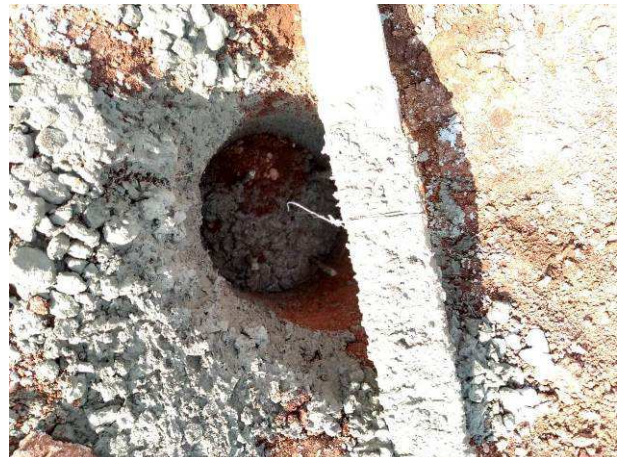
Figura 46C: Detalhe de estaca já concretada