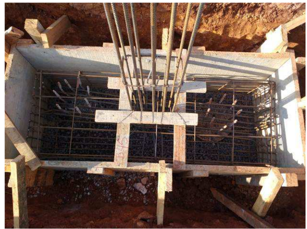
Figura 12C: Fôrma e armadura para bloco de 2 estacas