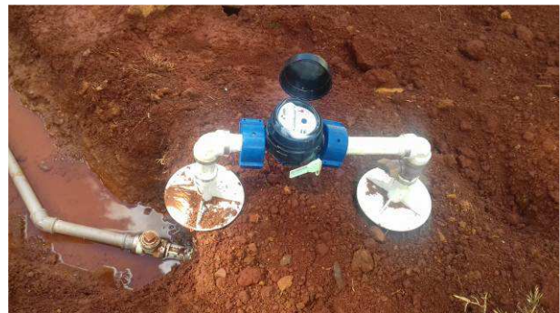
Figura 02C: Cavalete com registro e hidrômetro