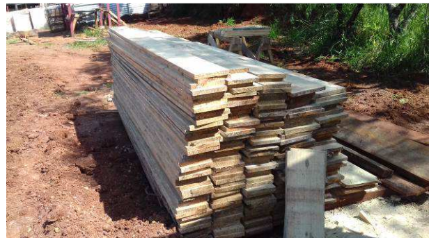
Figura 08C: Estoque de madeira para caixaria