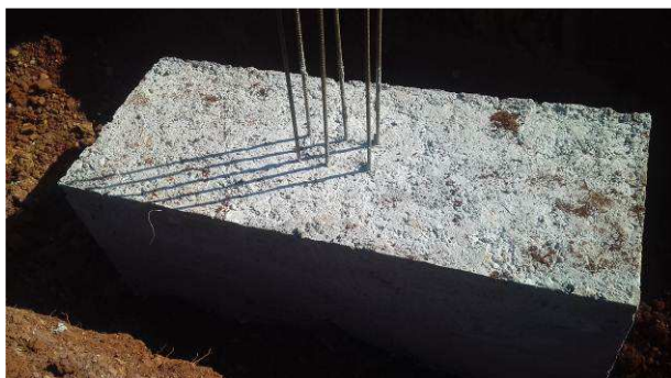
Figura 25C: Bloco B46, após a desforma