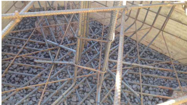
Figura 15C: Armaduras do bloco B29