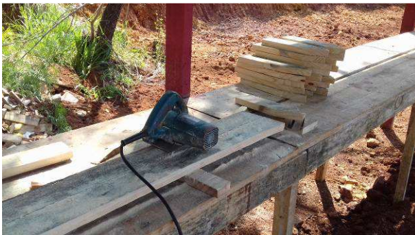
Figura 07C: Ferramenta de corte de madeira para execução de fôrmas