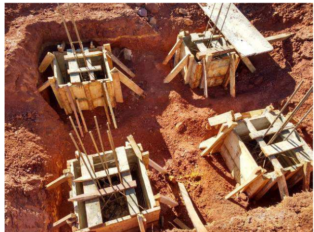
Figura 14C: Fôrmas e armaduras para blocos de 1 estaca - B23, B24, B25 e B26