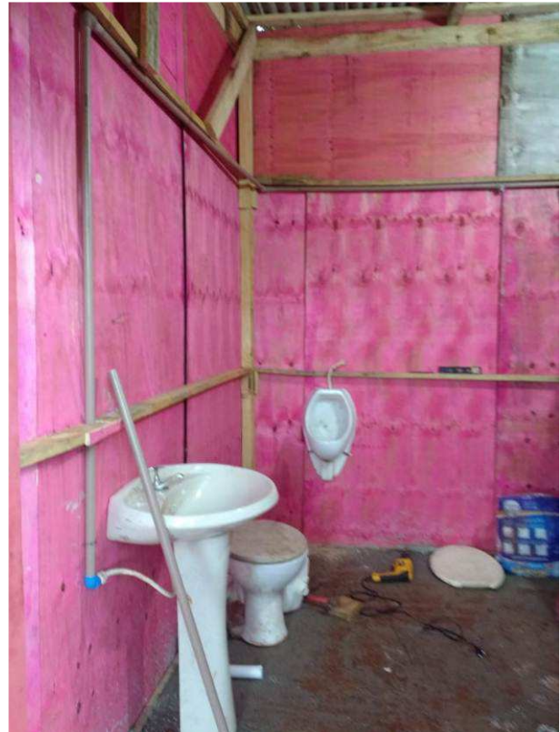
Figura 06C: Lavatório e mictório