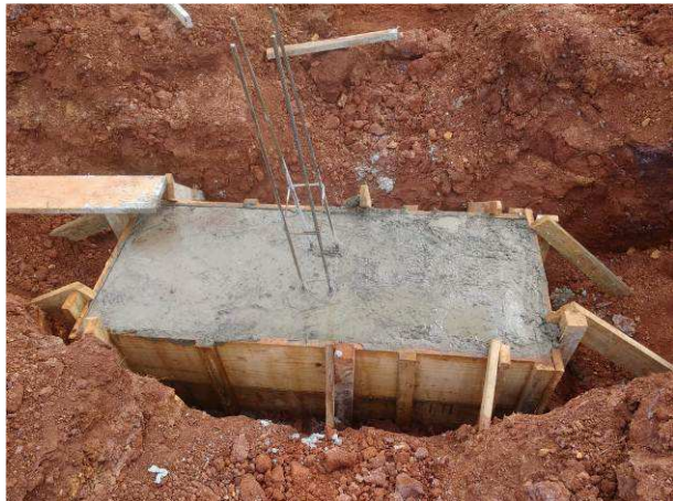
Figura 23C: Bloco B8, após concretagem