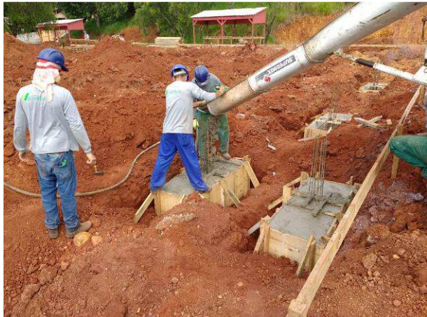
Figura 21C: Concretagem dos blocos B2 e B10