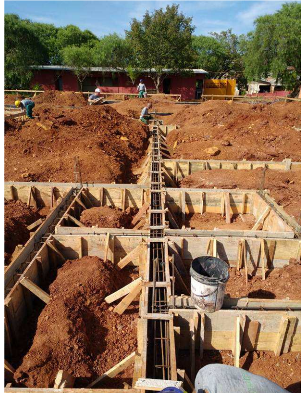
Figura 32C: Fôrmas e armaduras das vigas V41 (maior, vertical), V42 (vertical, à esquerda), V8, V7, V5, V4 e V3 (na horizontal, de cima para baixo)