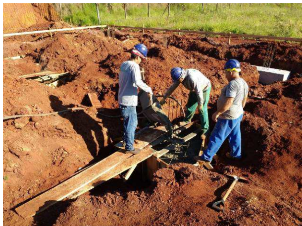
Figura 19C: Operários realizando a concretagem do bloco B20