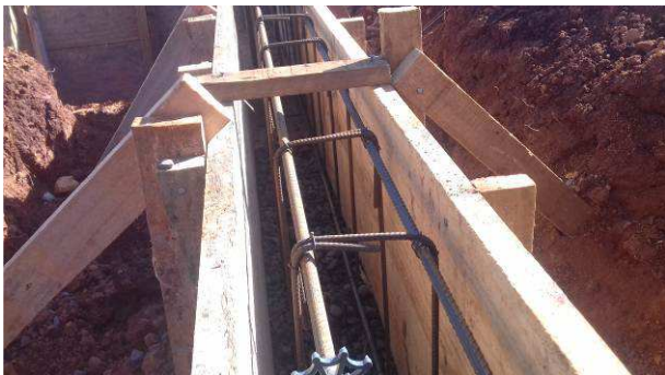
Figura 33C: Detalhe de armadura, fôrma, travamento e escoramento da fôrma