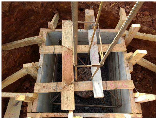
Figura 11C: Fôrma e armadura para bloco de 1 estaca (B43)