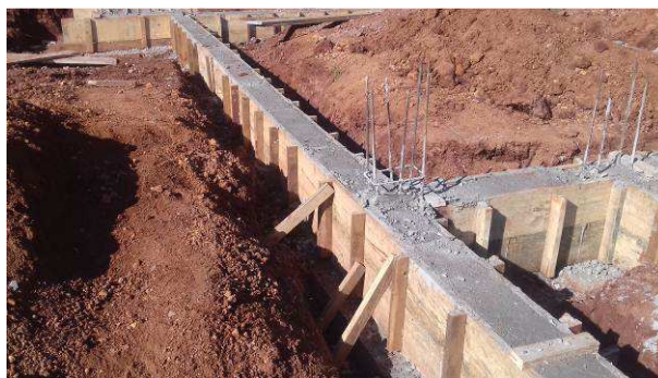
Figura 36C: Vigas já concretadas e em processo de cura