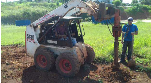
Figura 43C: Maquinário tipo "Bobcat", utilizado para perfuração de brocas do muro (nos fundos do imóvel)