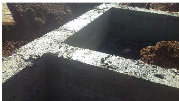
Figura 39C: Vigas V51, V52 e V53, após desforma