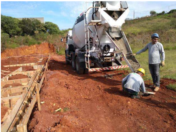
Figura 45C: Concretagem das estacas do muro de divisa do terreno (fundos)