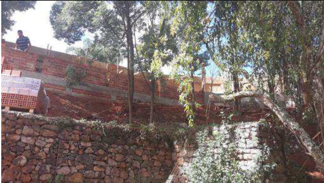
Figura 06 - Alvenaria para construção do muro.