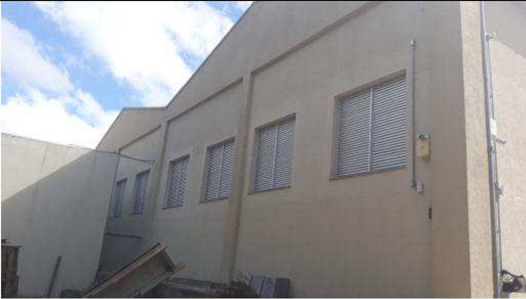
Figura 18 - Janelas venezianas da fachada lateral