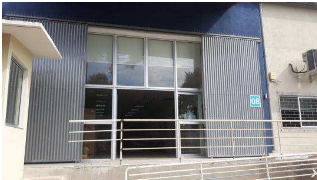
Figura 17 - Portas e vidros fixos (entrada Doca SMP).