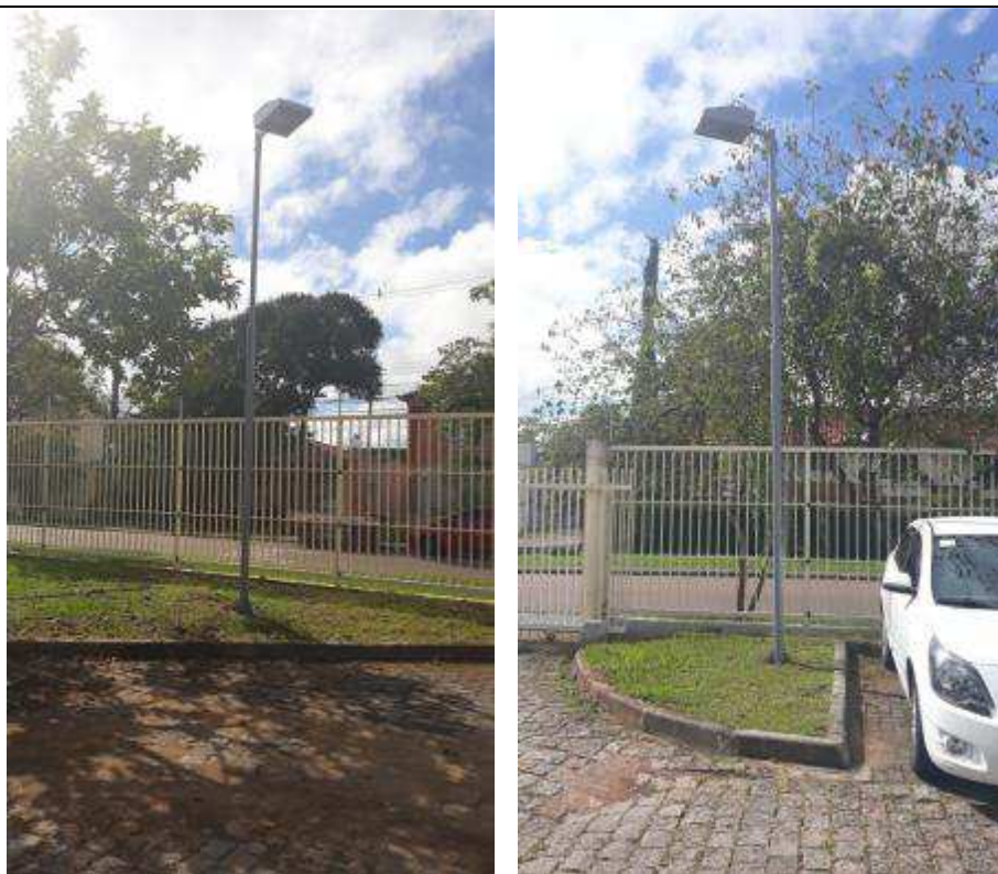
Figuras 25 - Pinturas nos postes restantes.