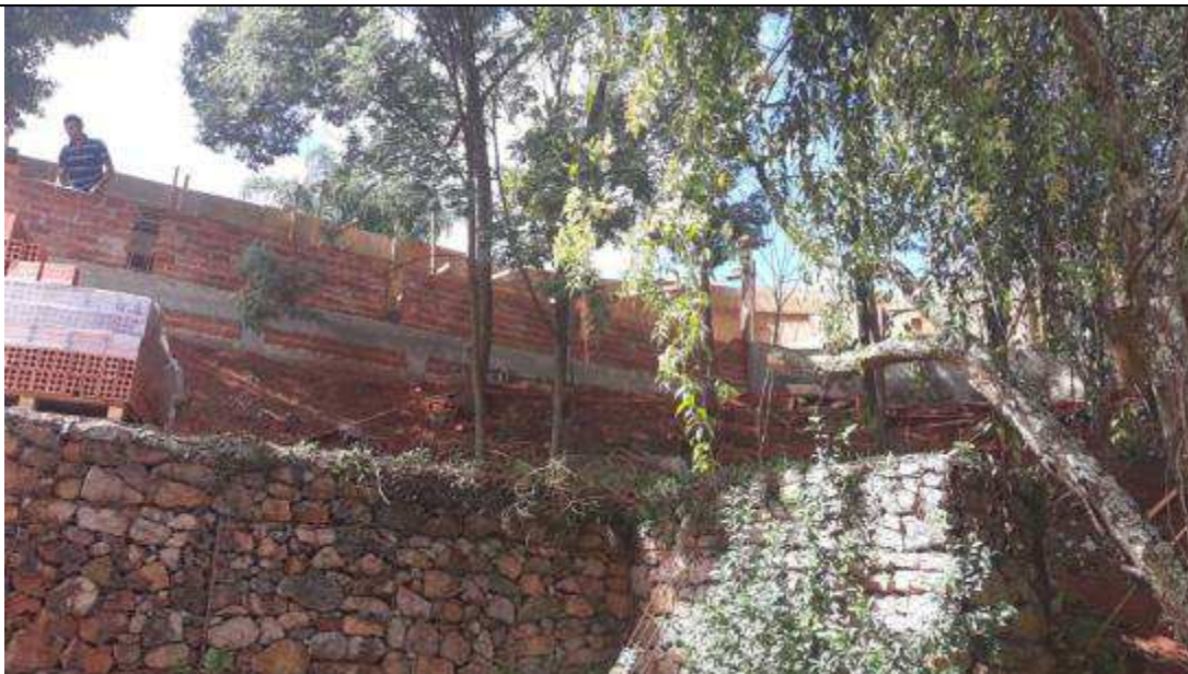
Figura 03 - Vigas de concreto do muro de divisa.