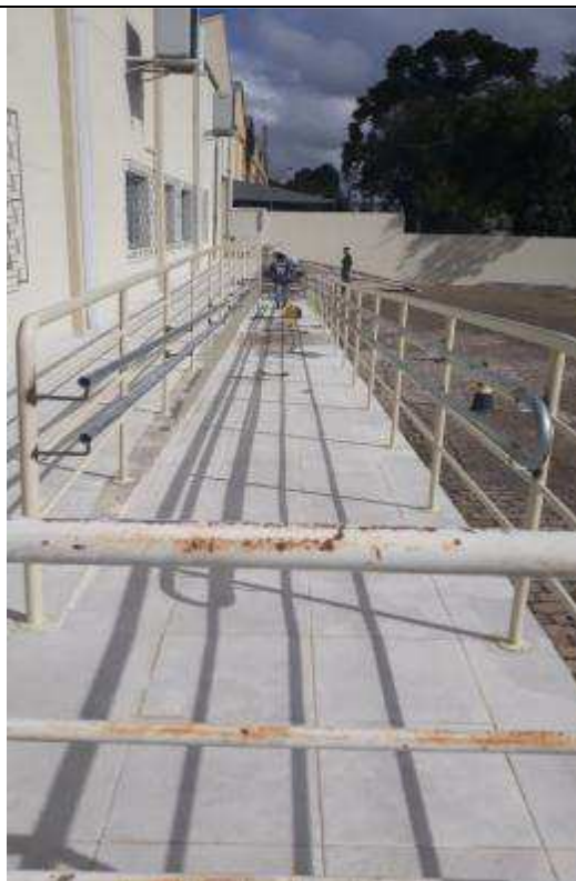
Figuras 14 - Corrimãos das rampas.