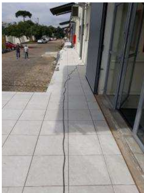
Figura 01: Guarda corpo e corrimão removidos.