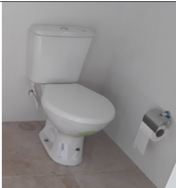
Figuras 11 - Papeleiras cromadas