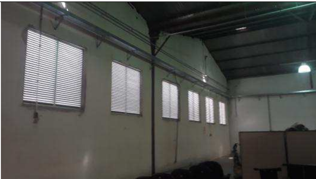
Figura 07 - Requadros dos vãos das venezianas dos fundos