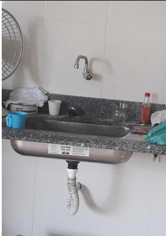
Figura 12 - Cuba e torneira da Área de Vivência