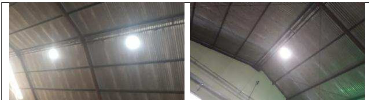
Figuras 21 - Exaustores eólicos.