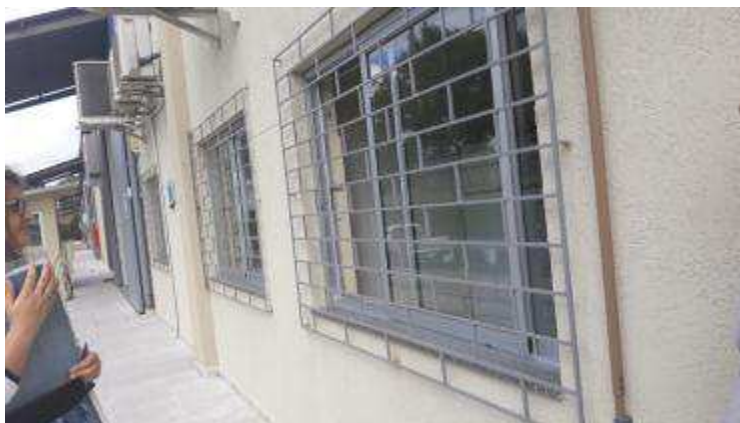
Figuras 16 - Janelas novas.