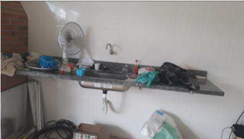
Figura 09 - Bancada de granito da Área de Vivência.