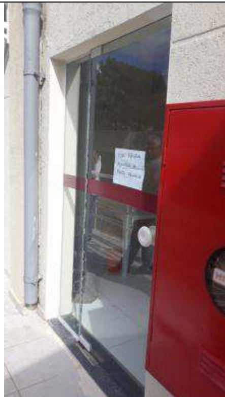
Figura 19 - Porta de vidro reinstalada na Copa.