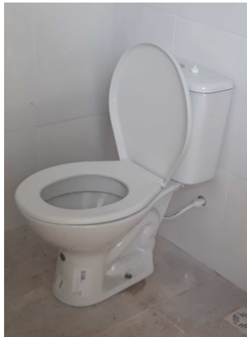
Figuras 10 - Sanitários com caixas acopladas e assentos.