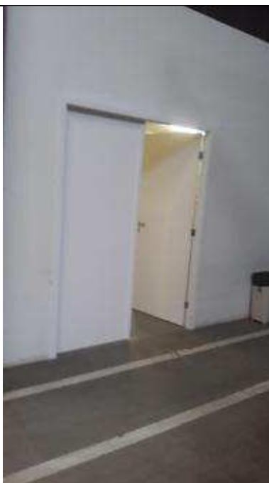
Figura 26 - Pintura na porta da SMP.