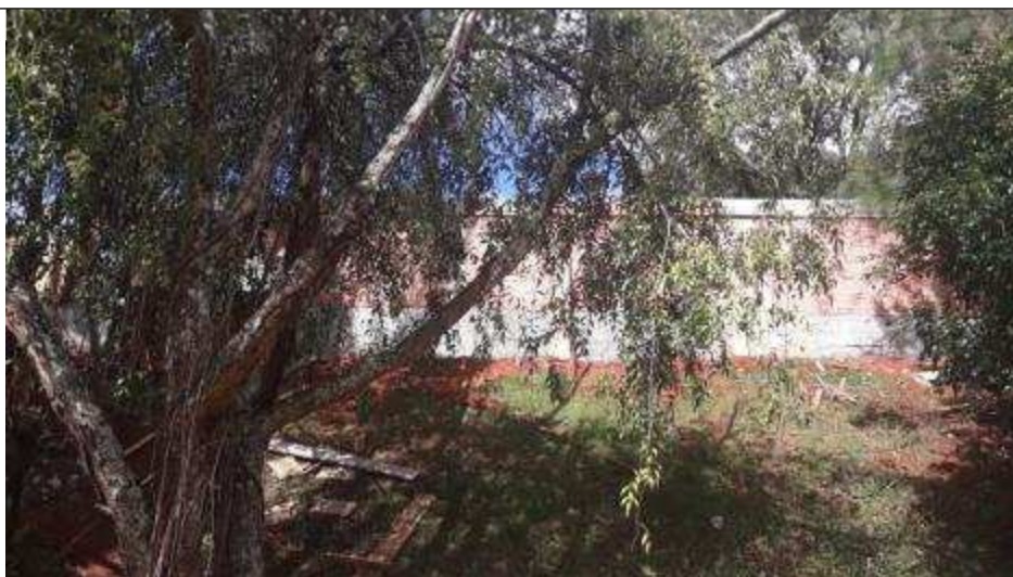
Figura 02: Pilares do muro de divisa.