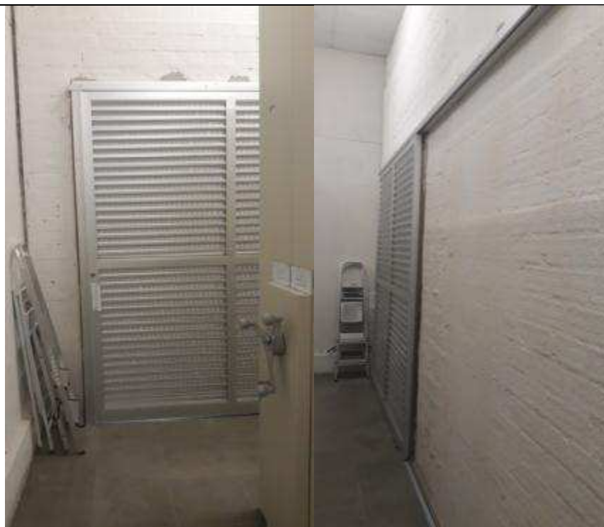
Figuras 15 - Porta de alumínio de correr da Sala das Estantes Deslizantes.