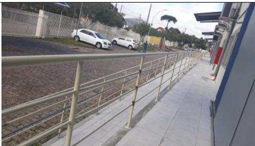
Figuras 04 - Assentamento de revestimento cerâmico na plataforma e rampa.