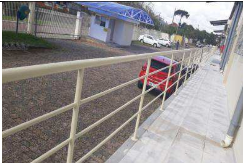
Figura 13 - Guarda corpo instalado.