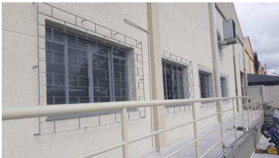
Figuras 23 - Pintura nas janelas na cor grafite.