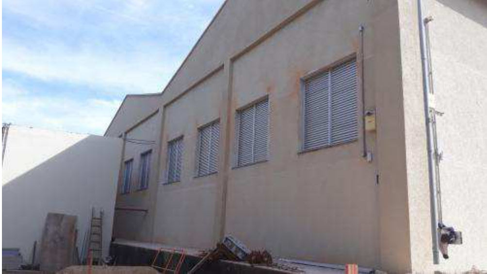
Figura 08 - Peitoris das janelas dos fundos.