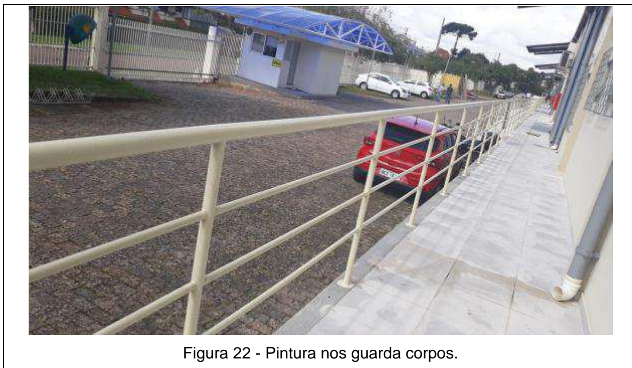
Figura 22 - Pintura nos guarda corpos.