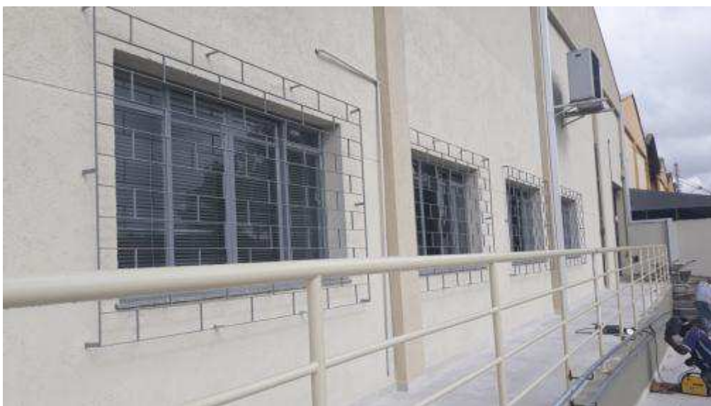
Figuras 20 - Gradis das janelas reinstalados.