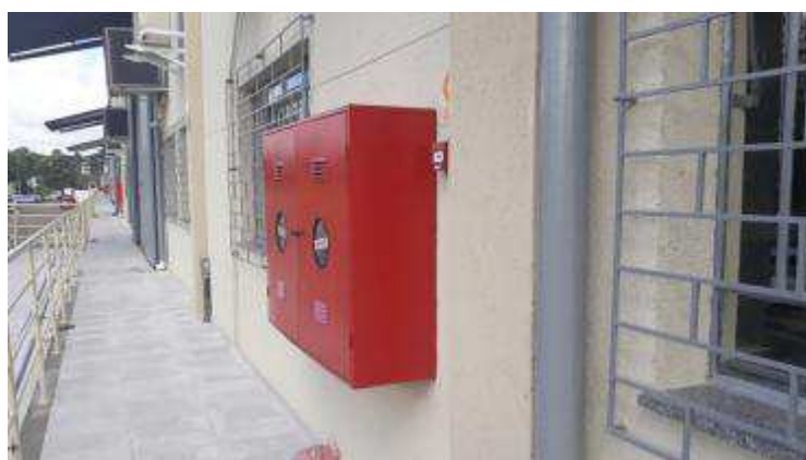
Figuras 24 - Pinturas nos hidrantes.