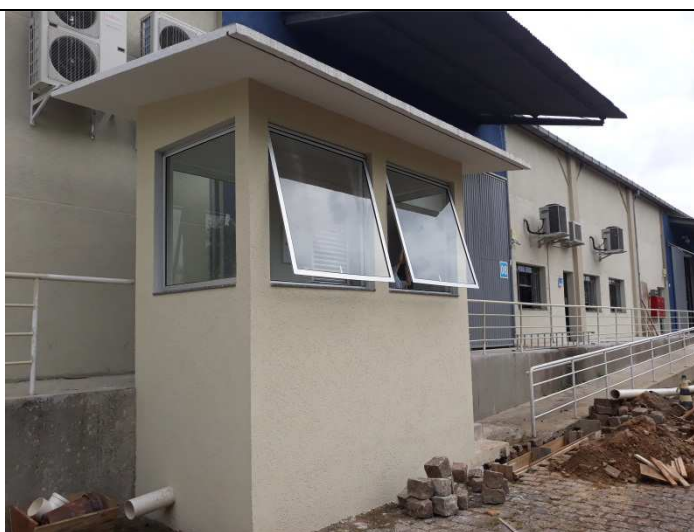
Figura 16 - Janelas de alumínio MAXIM-AR guarita da plataforma.