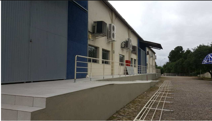
Figura 12 - Reinstalação do guarda corpo.