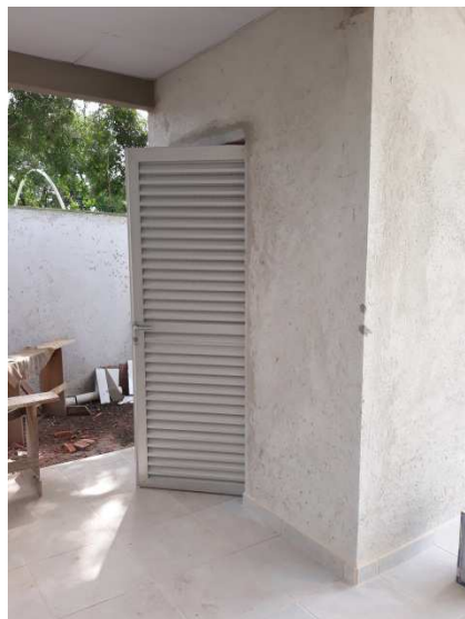
Figura 14 - Portas em alumínio natural tipo veneziana.