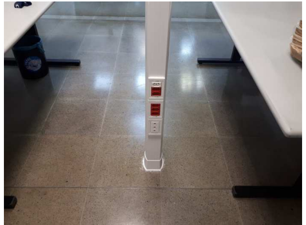
Figuras 02E - Instalações elétricas, lógicas - Secretaria do Arquivo