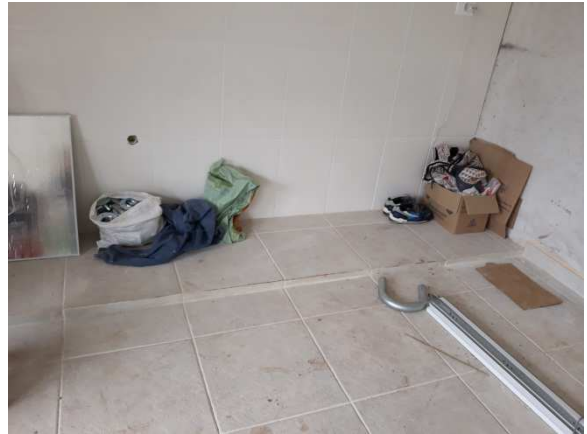
Figura 07 - Assentamento de piso cerâmico na Área de Vivência.