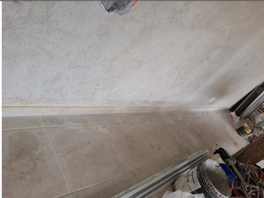
Figura 08 - Assentamento de rodapé cerâmico na Área de Vivência.