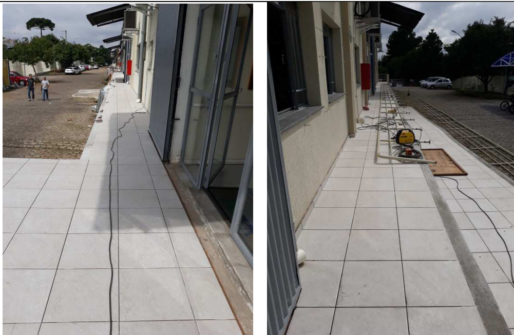
Figura 06 - Assentamento de revestimento cerâmico na plataforma e rampa.