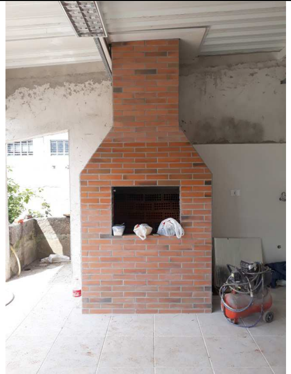
Figura 11 - Revestimentos de parede da pia e churrasqueira.