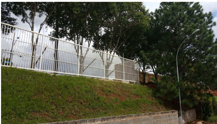
Figura 13 - Gradil de fechamento do terreno.