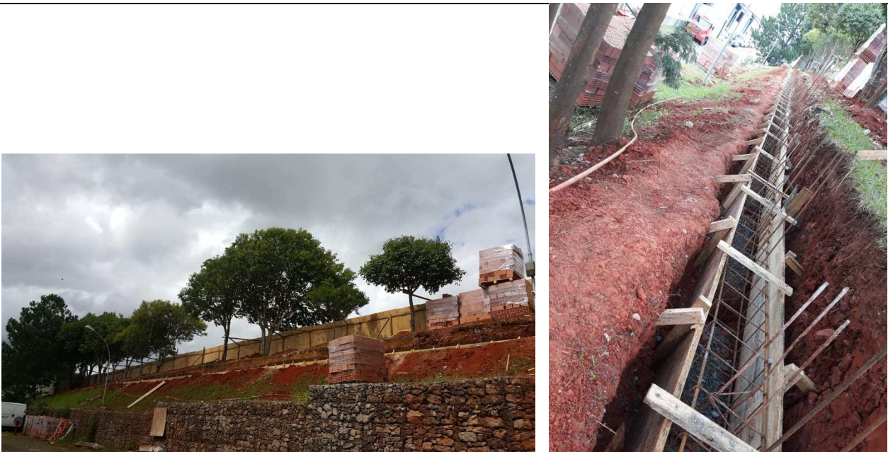
Figura 04: Escavações de valas para construção do baldrame..