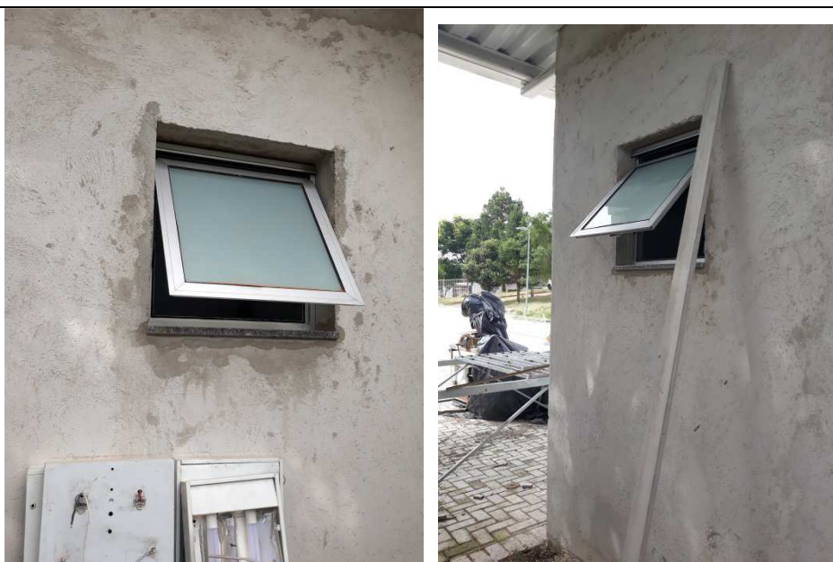
Figura 15 - Janelas de alumínio MAXIM-AR banheiros.