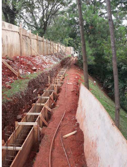
Figura 01 - Tapume de chapa de madeira compensada para proteção do lote