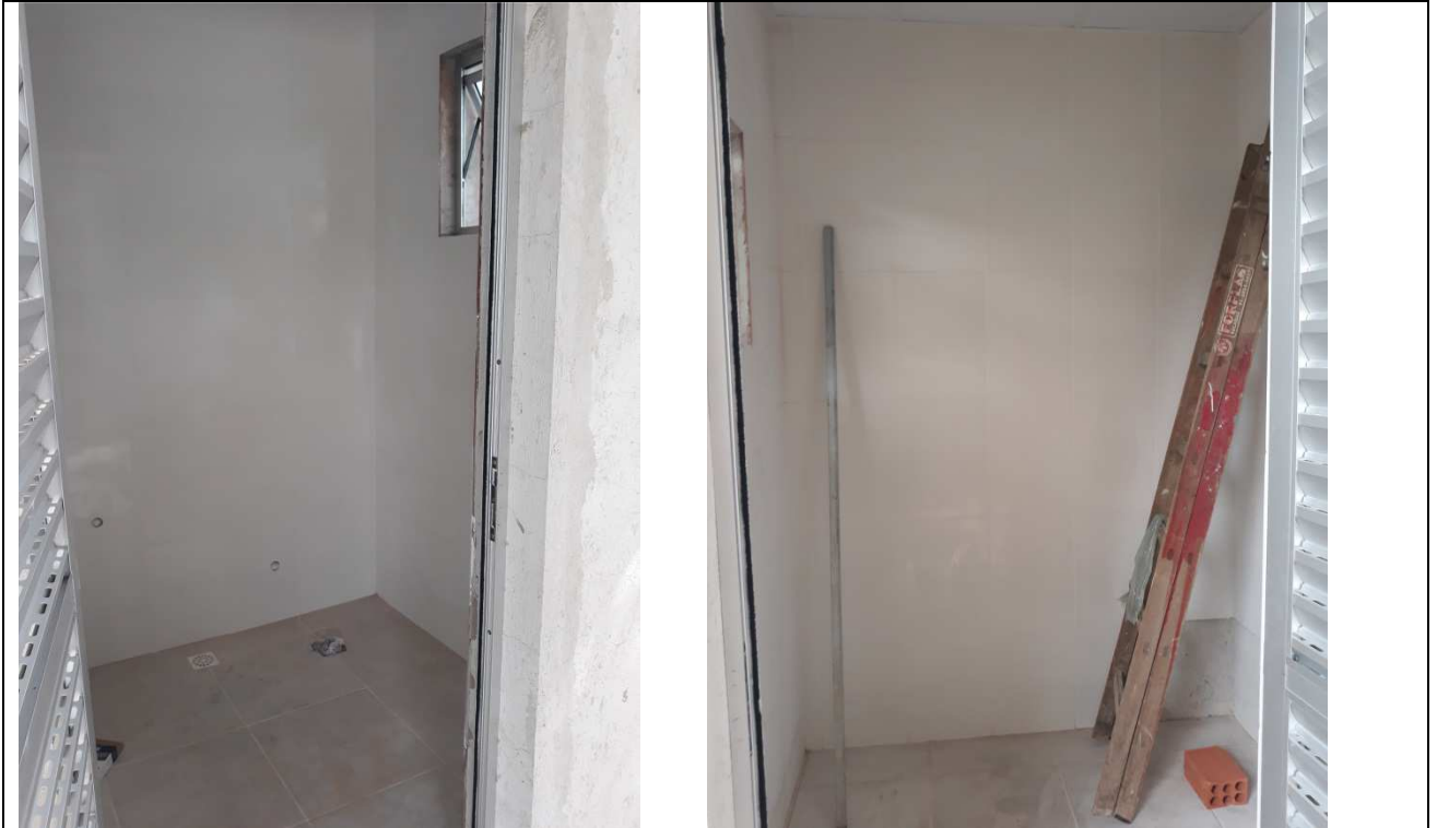
Figura 09 - Assentamento dos pisos e azulejos dos banheiros da Área de Vivência.