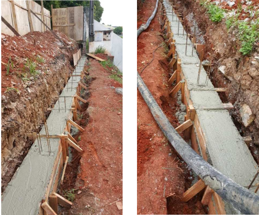
Figura 05 - Baldrame construído no perímetro do mural.