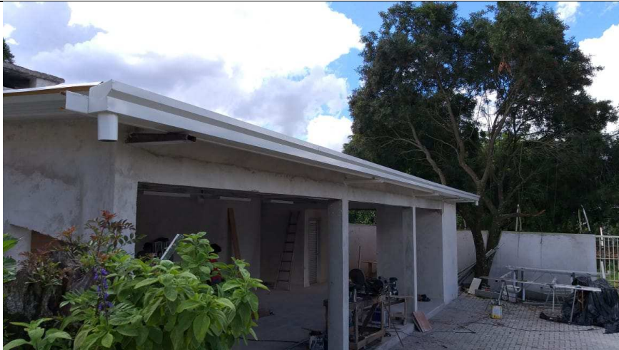
Figuras 18 - Calhas na cobertura da Área de Vivência.