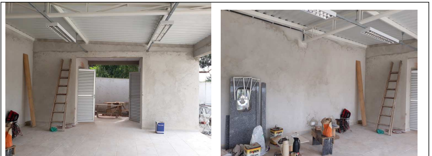
Figura 10 - Chapisco nas paredes da Área de Vivência.