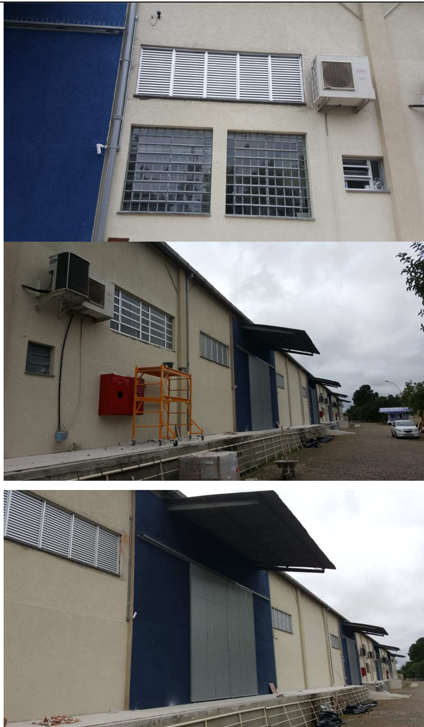
Figura 17 - Janelas venezianas superiores fachada frontal e peitoril em granito.