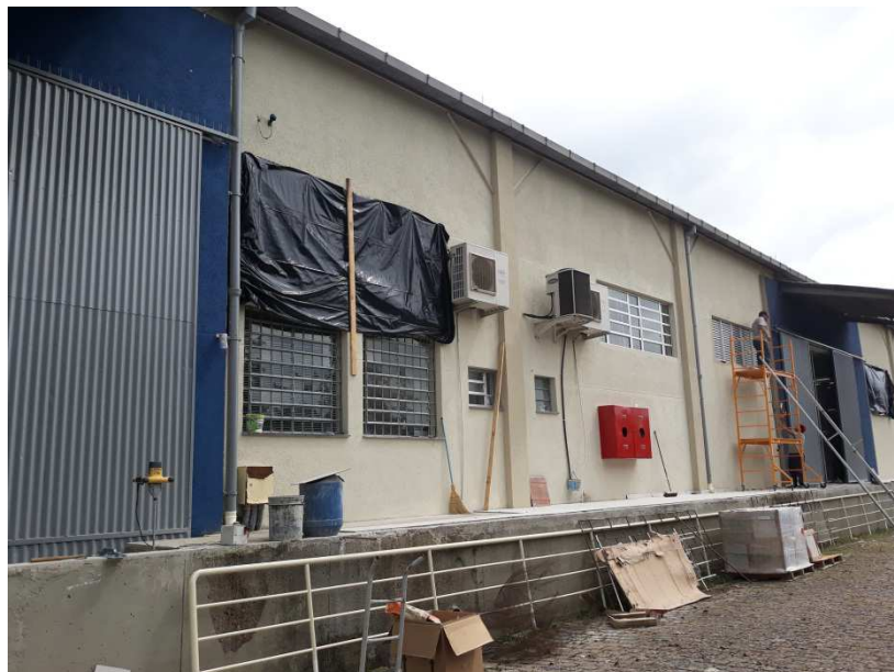
Figura 02: Guarda corpo e corrimão removidos.