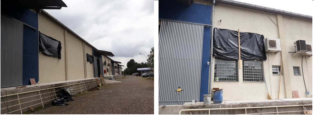
Figura 03: Remoção das janelas superiores frontais.