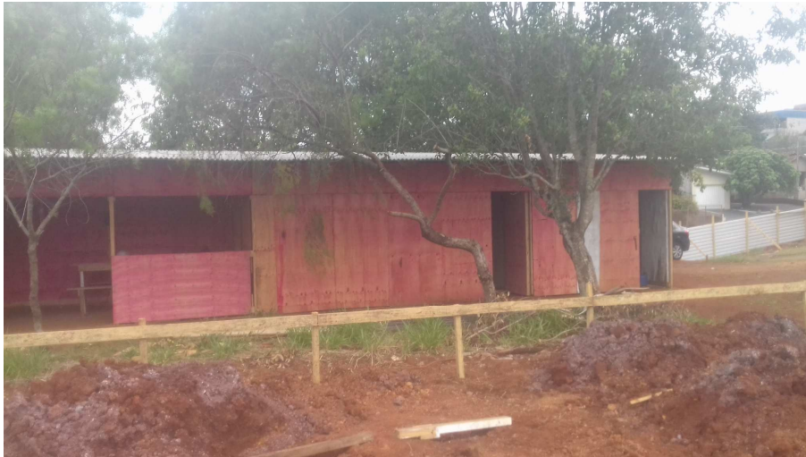
Figura 2 – Barraco de obra