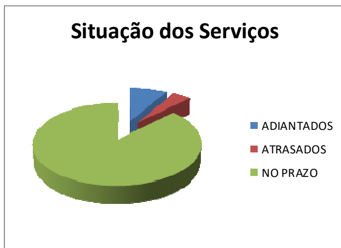
Gráfico 1.

O Gráfico 1, abaixo, mostra a quantidade de itens adiantados, atrasados e dentro do prazo, em relação à etapa atual, tendo em vista o cronograma vigente da obra.