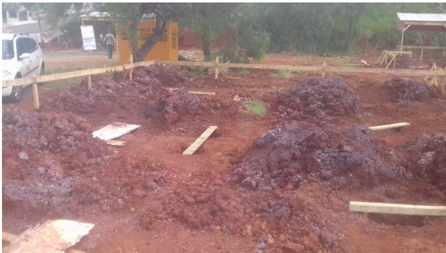
Figura 1 – Visão do canteiro de obras

As imagens abaixo retratam a situação geral do canteiro de obra, após término da etapa atual.