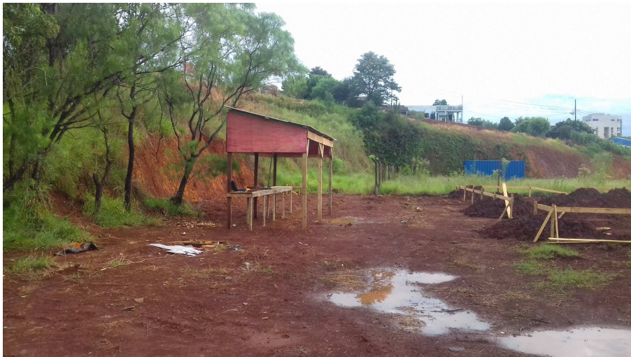
Figura 3 – Área operacional