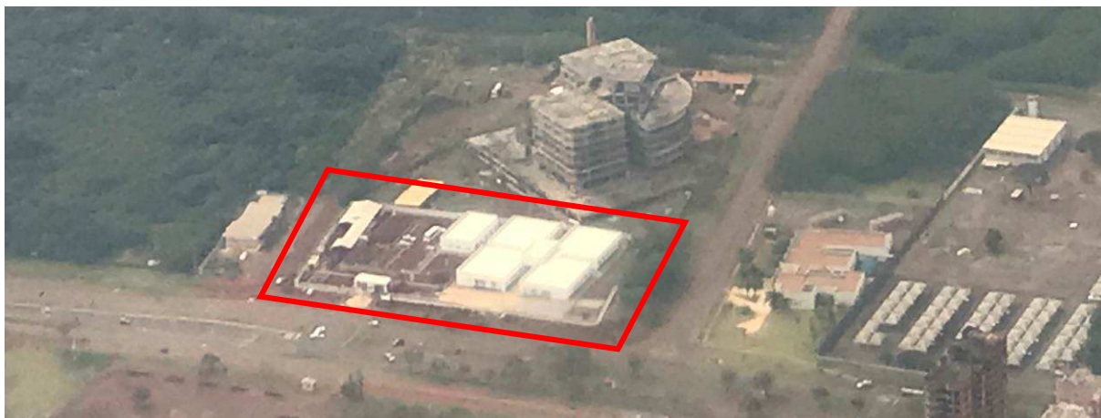
Figura 1 – Prédio do Fórum – vista aérea.