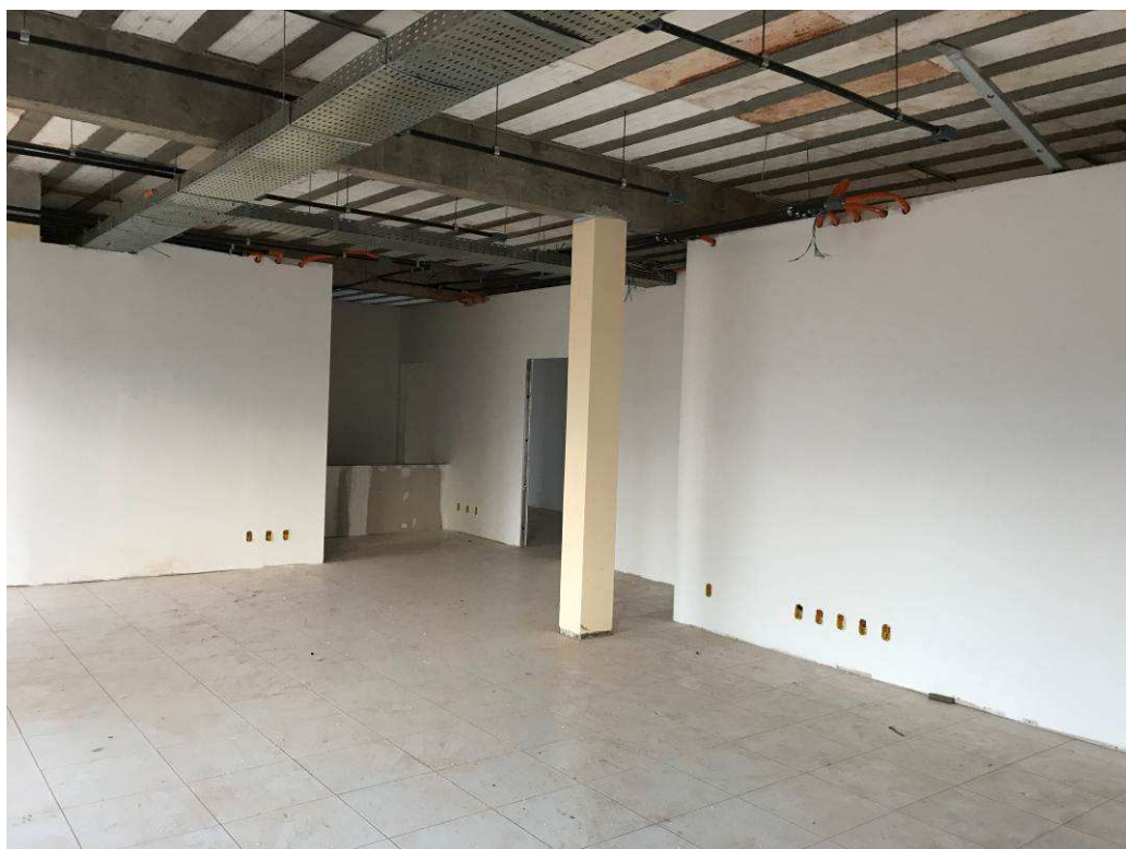
Figura 6 – Prédio do Fórum – vista interna.