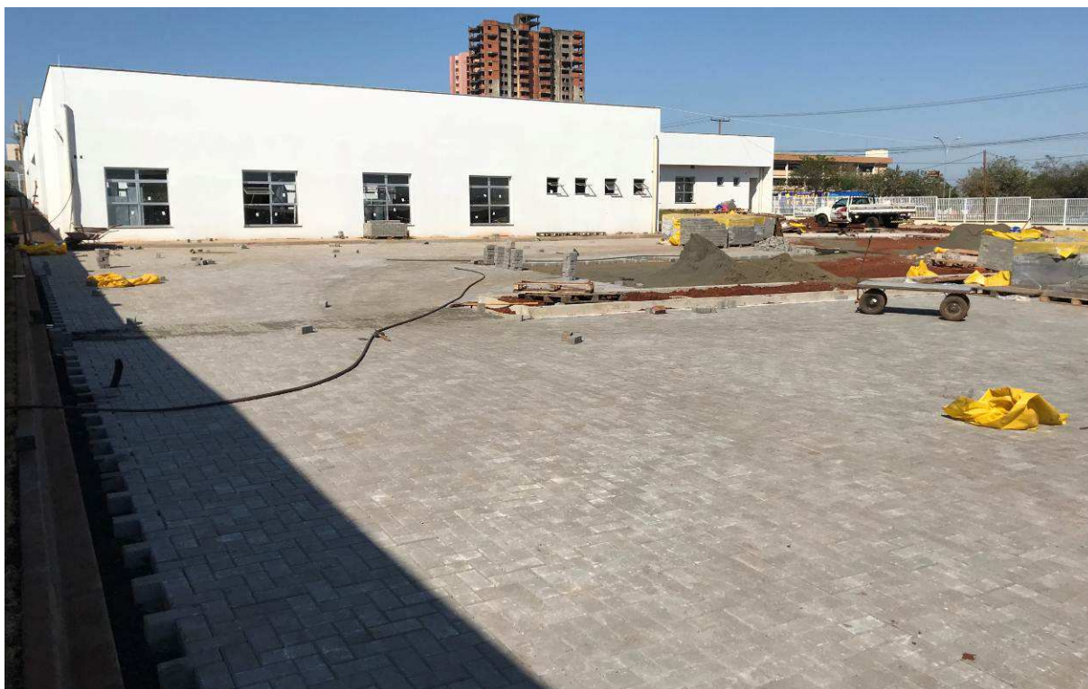
Figura 5 – Prédio do Arquivo – vista externa.