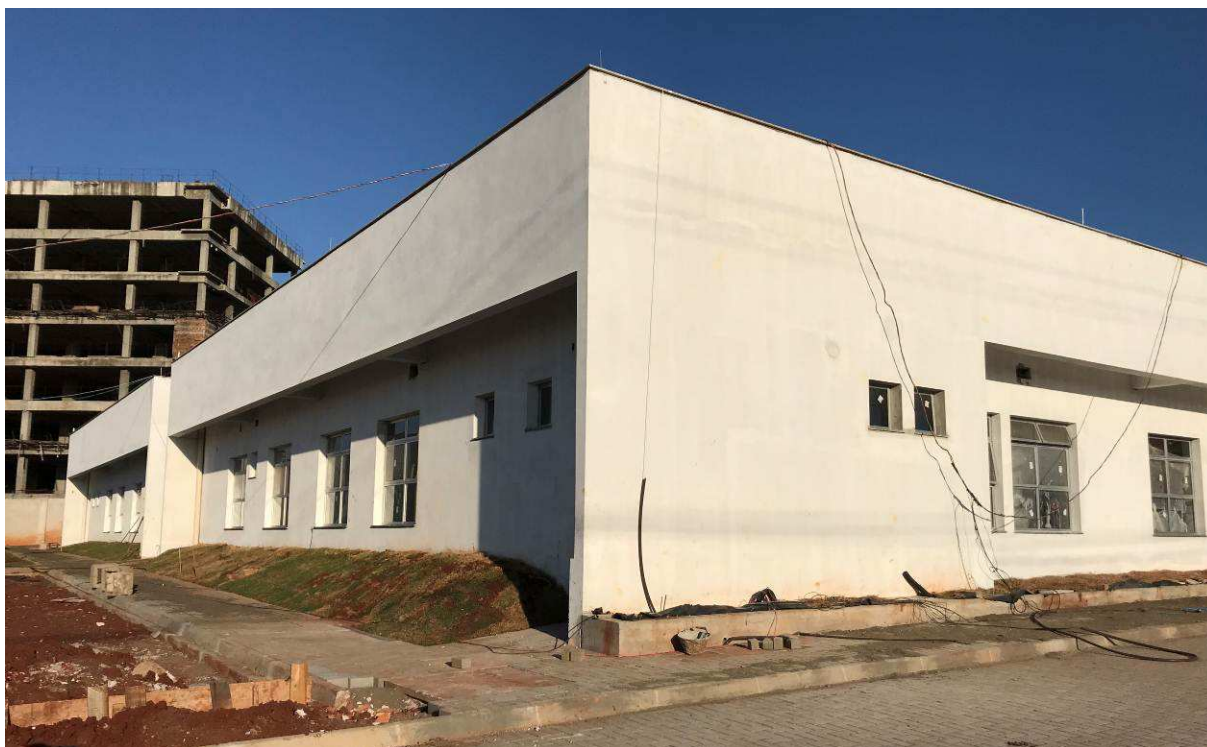
Figura 4 – Prédio do Arquivo – vista externa.