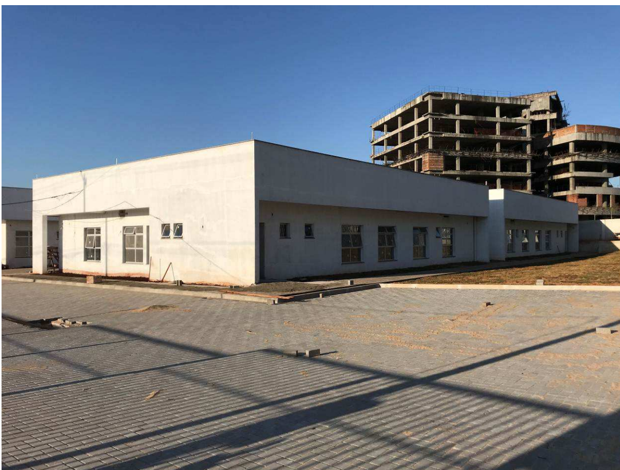
Figura 3 – Prédio do Fórum – vista externa.