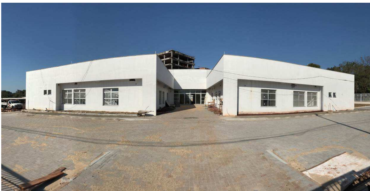
Figura 2 – Prédio do Fórum – vista externa.