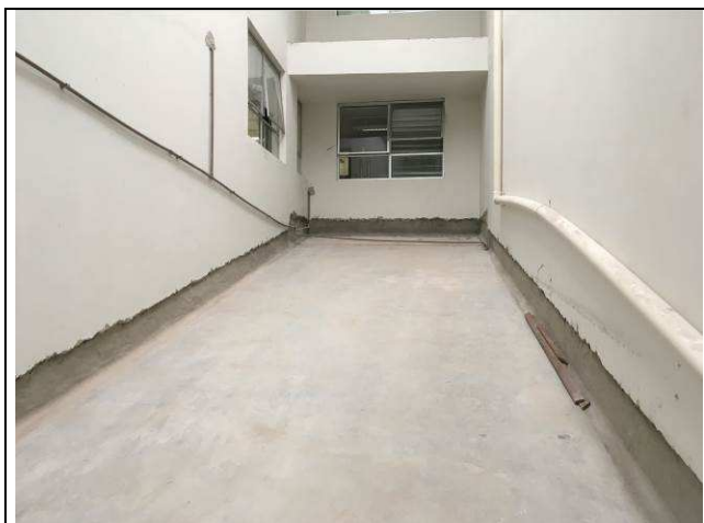
Figura 01C: Demolição da alvenaria.