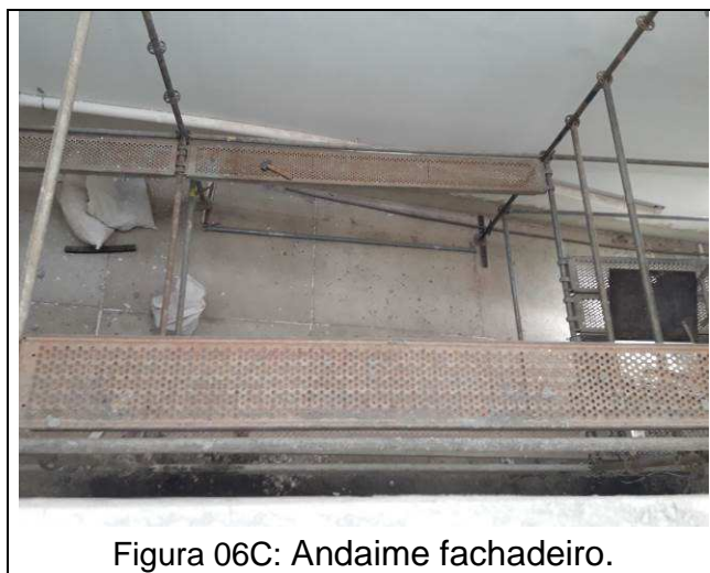
Figura 06C: Andaime fachadeiro.