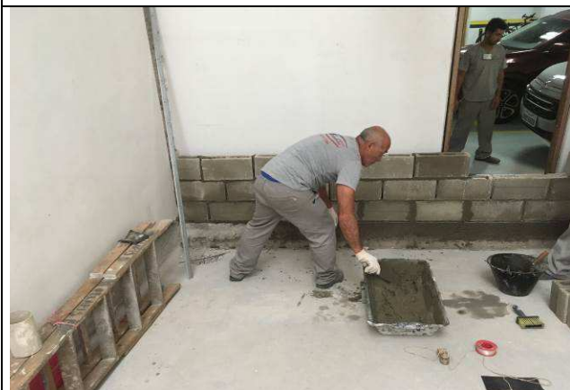
Figura 04C: Fechamento do vão remanescente da porta de acesso