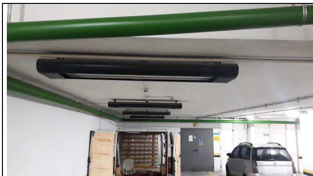
Figura 07C: Nova prumada, fixada no teto da garagem.