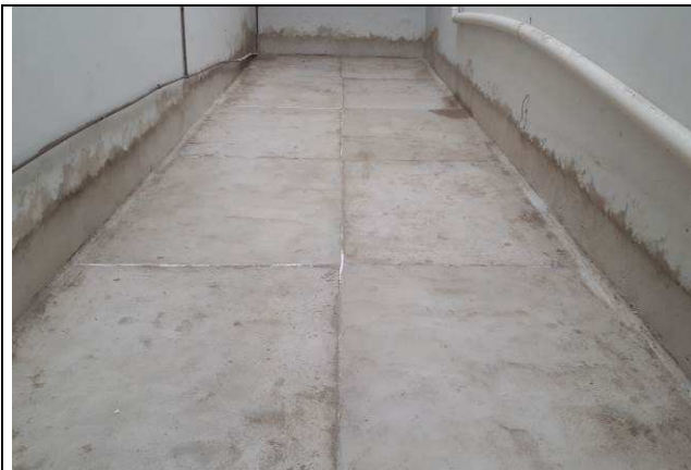
Figura 02C: Embutimento da manta asfáltica.