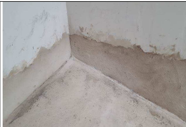
Figura 03C: Embutimento da manta asfáltica.