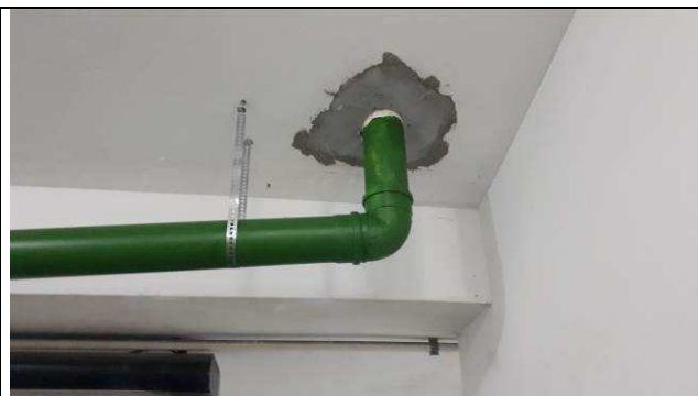
Figura 08C: Nova prumada, fixada no teto da garagem.