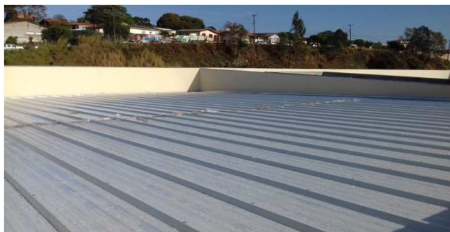
Figura 11C: Telhas sanduíche, instaladas no bloco da direita