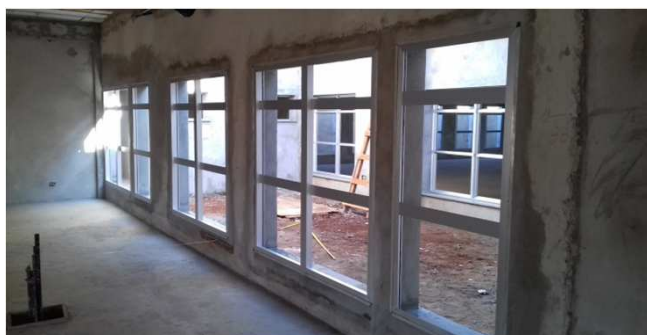
Figura 05C: caixilhos de alumínio - 180x180 e 90x180cm - vidro quádruplo