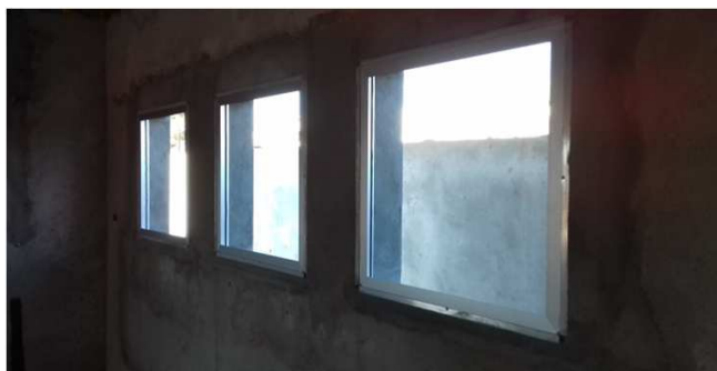
Figura 07C: caixilhos de alumínio - 90x90cm - bloco da direita