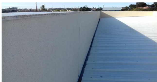
Figura 43C: Pintura de face interna de platibanda - bloco da direita