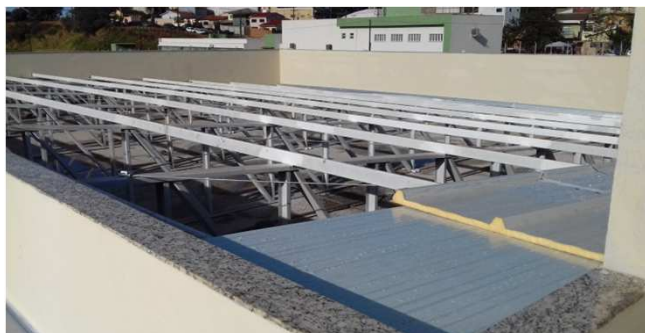
Figura 45C: Pintura de platibanda - bloco da esquerda