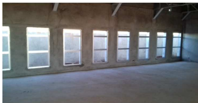
Figura 09C: caixilhos de alumínio - 90x180cm - bloco central