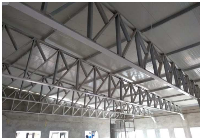
Figura 18C: visão das telhas por baixo, no vão livre das salas de múltiplo uso