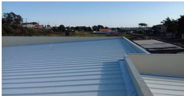
Figura 12C: Telhas sanduíche, instaladas no bloco da direita - detalhe encontro com rufo