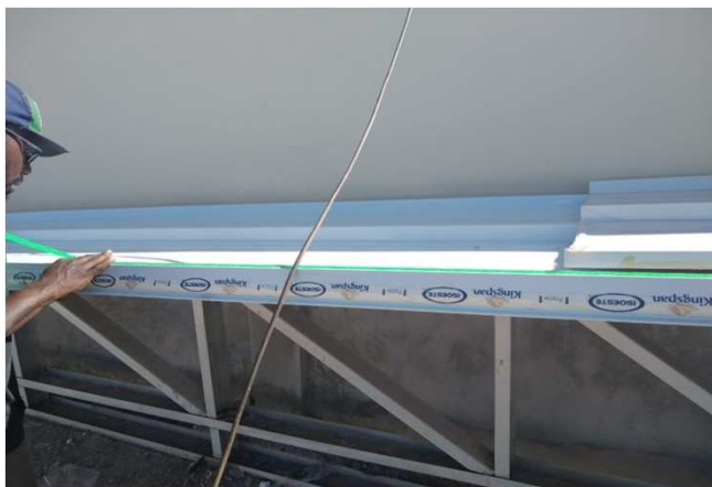
Figura 17C: Aplicação de fita de vedação na sobreposição longitudinal de telhas