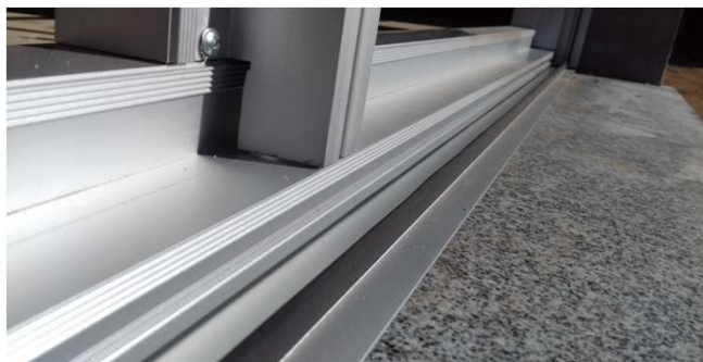
Figura 29C: Detalhe de assentamento de caixilho sobre o peitoril de granito