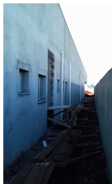
Figura 38: Prumada Pluvial - bloco central e da esquerda