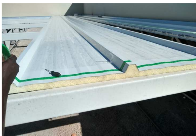
Figura 16C: sobreposição transversal sendo vedada