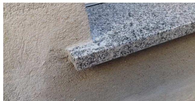
Figura 33C: Detalhe de avanço do peitoril na parede, conforme a boa técnica exige