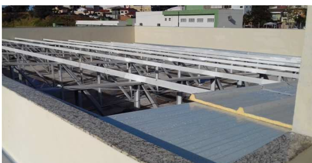
Figura 22C: Capeamento de platibanda no bloco da esquerda