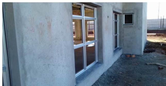
Figura 02C: caixilhos de alumínio - 180x180cm - bloco da esquerda