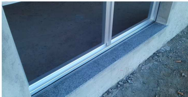
Figura 30C: Peitoril de granito em esquadria de 180x180cm