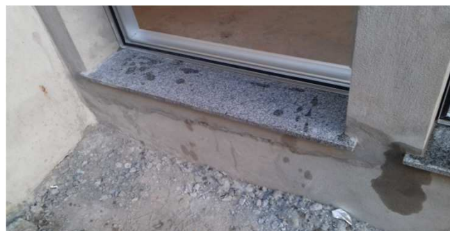
Figura 31C: Peitoril de granito em esquadria de 90x180cm