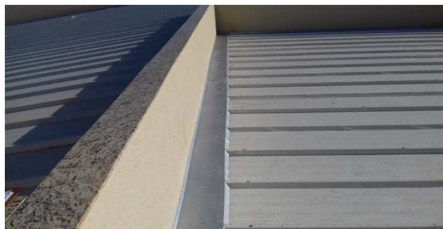
Figura 24C: Capeamento e rufo em cobertura do bloco central