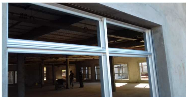
Figura 01C: caixilho de alumínio - 180x180cm - bloco da direita