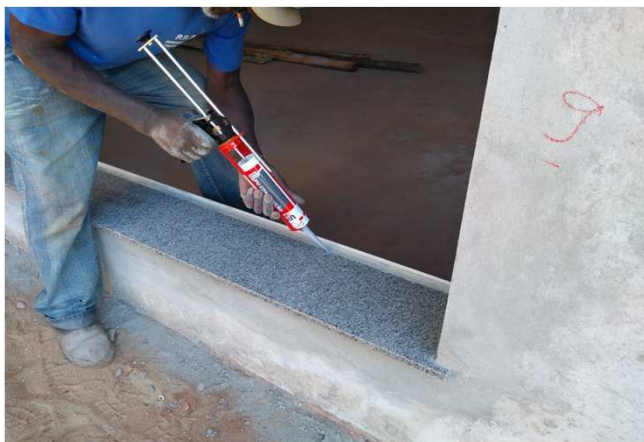
Figura 35C: Aplicação de silicone para vedar o encontro entre contramarco e peitoril, antes da fixação do caixilho