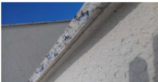
Figura 19C: Detalhe de pingadeira em uma das capas de platibanda