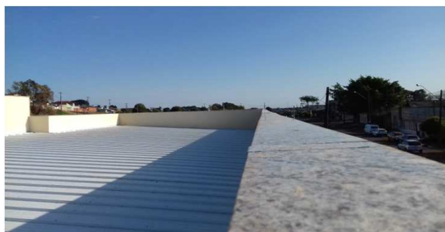
Figura 20C: Capa de platibanda, no bloco central - frente