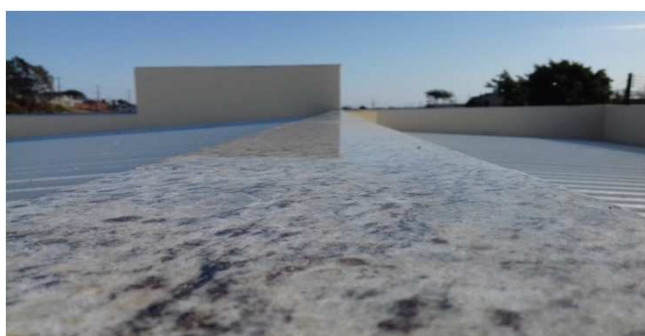
Figura 21C: Capeamento de platibanda entre duas coberturas, no bloco central