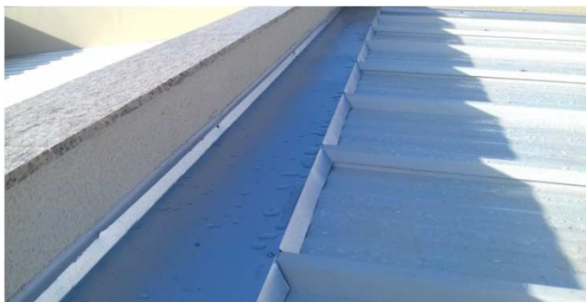
Figura 23C: Detalhe de capa e rufo, em cobertura de reservatório