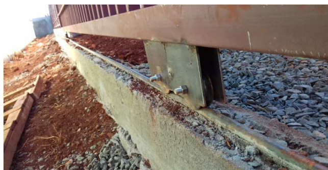
Figura 40C: Detalhe de roldanas e trilho de portão