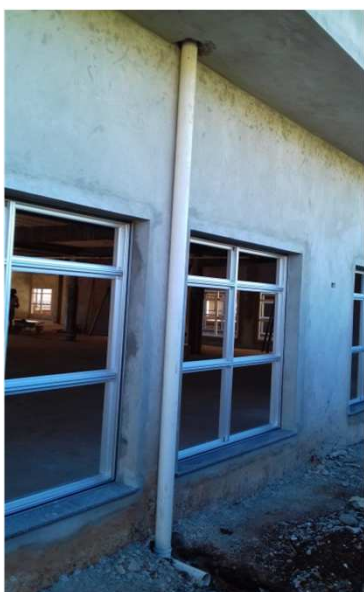
Figura 36: Prumada Pluvial - bloco da direita