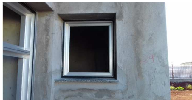
Figura 04C: caixilhos de alumínio 60x60cm - bloco da esquerda