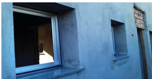
Figura 32C: Peitoril de granito em esquadria de 90x90cm