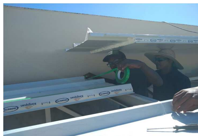
Figura 15C: trabalhador aplicando a fita de vedação "dupla-face" antes de executar a sobreposição transversal