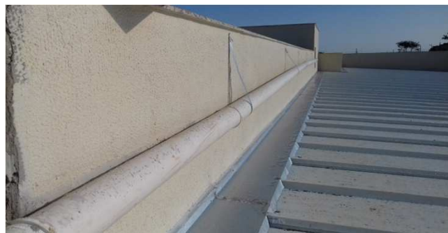
Figura 46C: Pintura de face interna de platibanda - bloco central