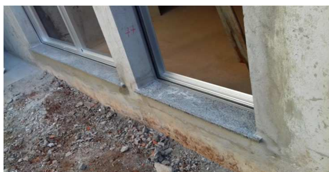
Figura 34C: Peitoris de janelas de 180 e 90cm