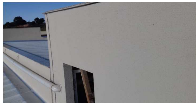
Figura 44C: Pintura de face interna de platibanda - bloco central