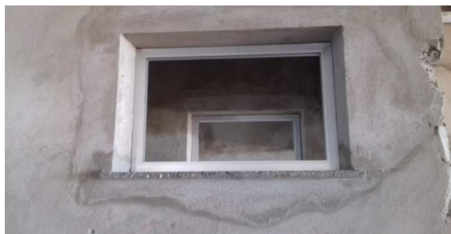
Figura 08C: caixilhos de alumínio - 90x60cm