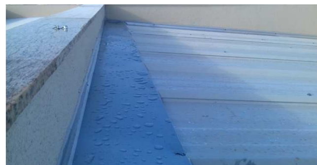
Figura 28C: Detalhe da chapa de rufo, contínua e com ondulação insignificante