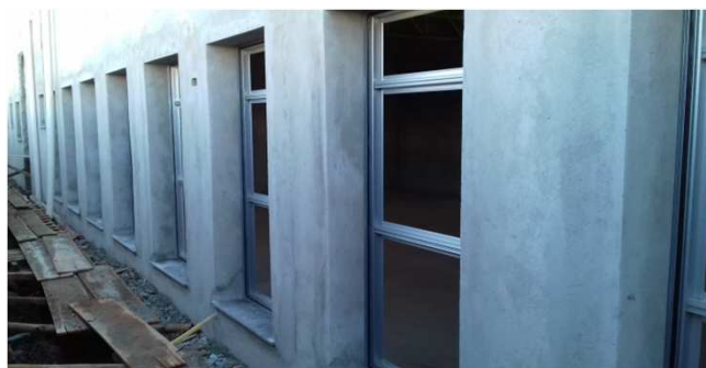
Figura 06C: caixilhos de alumínio - 90x180cm - bloco central