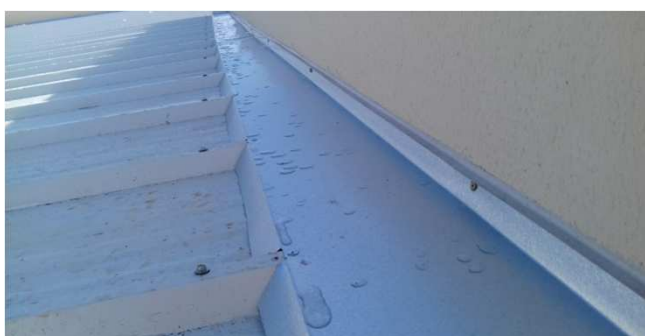
Figura 25C: Rufo recortado conforme a onda da telha, fixado com parafuso e vedado com poliuretano