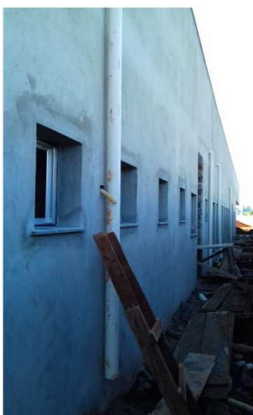
Figura 37: Prumada Pluvial - bloco da direita