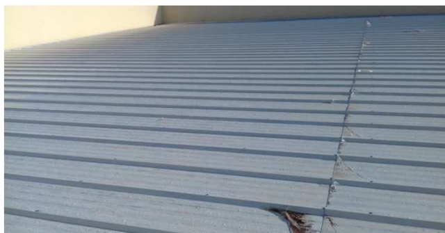
Figura 14C: Detalhe da linha de fixação e de sobreposição de telhas (tamanho maior que 12m)