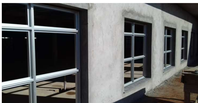
Figura 03C: caixilhos de alumínio - 180x180cm - bloco da direita - lateral