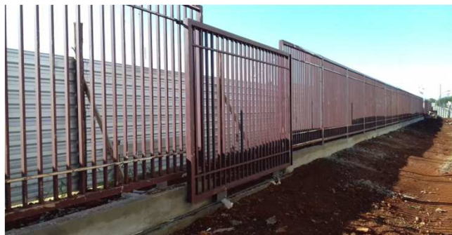
Figura 42C: Portão de acesso de pedestres