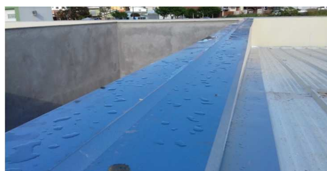
Figura 26C: Rufo flexível (com folga de dilatação), aplicado entre duas platibandas, na junta de dilatação