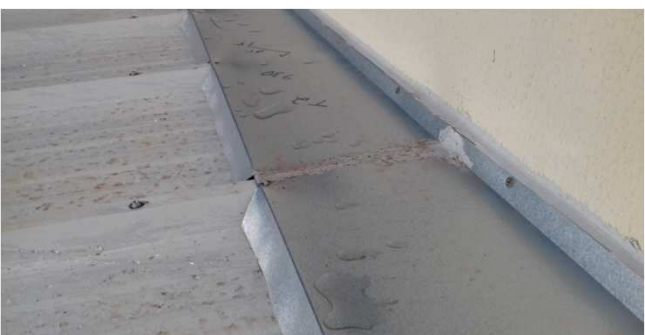
Figura 27C: Detalhe de vedação em emenda de rufo