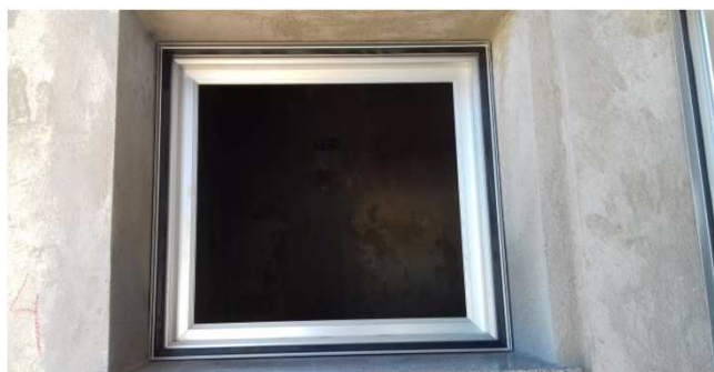
Figura 10C: caixilho de alumínio - 60x60cm - em sanitário.