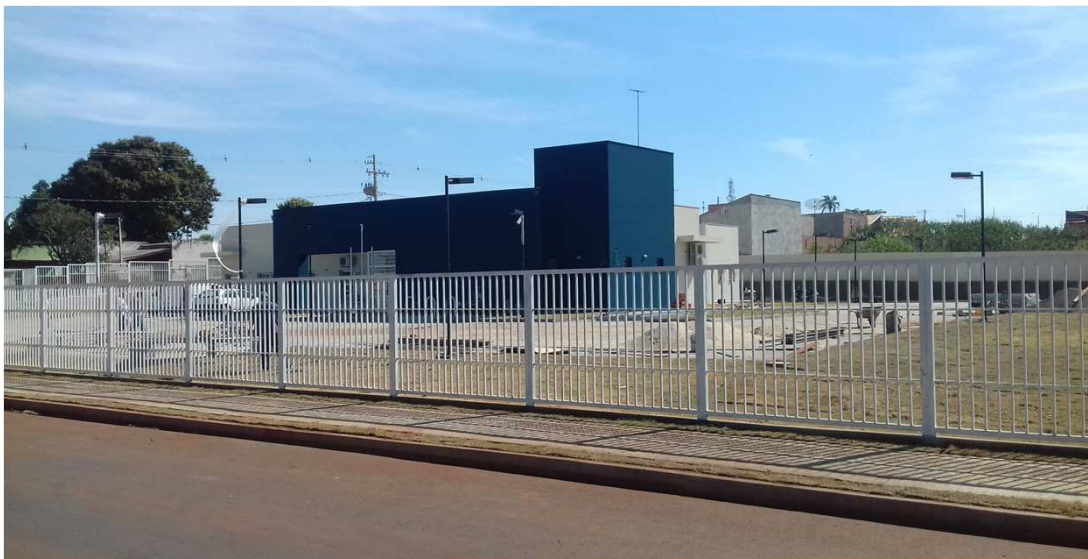
visão geral da obra

O total executado nesta etapa, foi de 311.579,22 (trezentos e onze mil, quinhentos e setenta e nove reais e vinte e dois centavos), que corresponde a um percentual de 17,93% para a medição e 96,21% acumulado. Estava previsto, no cronograma atualizado, um total de 18,71%, para a etapa, isto é, a obra atrasou 0,78% nesta etapa em relação ao cronograma atual. Restando 3,71% da obra por executar e, com a previsão contratual de término da obra para a data de 10/08/18, a contratada apresentou novo cronograma, mantendo esse prazo.