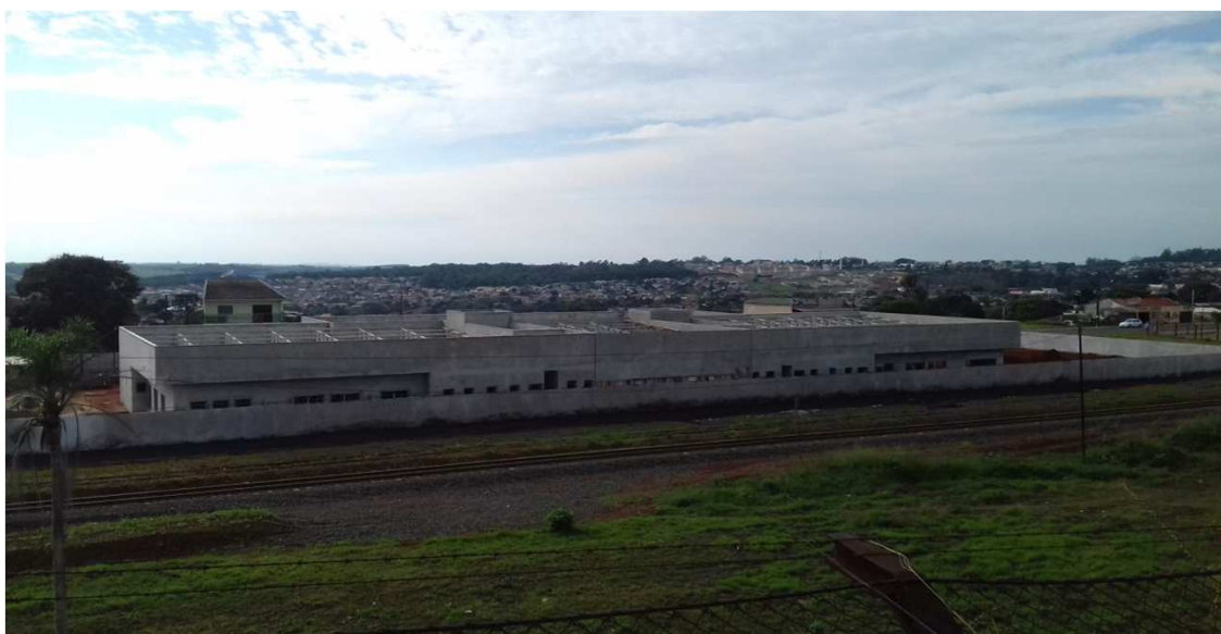
Figura 01C: Visão geral da obra

Considerando a instituição da Comissão de Recebimento e Fiscalização da CONSTRUÇÃO DO FÓRUM TRABALHISTA DE APUCARANA, objeto do Contrato Nº 34/2017, CP 04/2016, com efeitos através do despacho exarado pela Sra. Ordenadora da Despesa, os componentes abaixo elencados apresentam o relatório fotográfico das vistorias realizadas, que tiveram como objetivo a fiscalização dos serviços executados pela Contratada, no período de 07/06/2018 até 28/06/2018 (décima segunda medição).