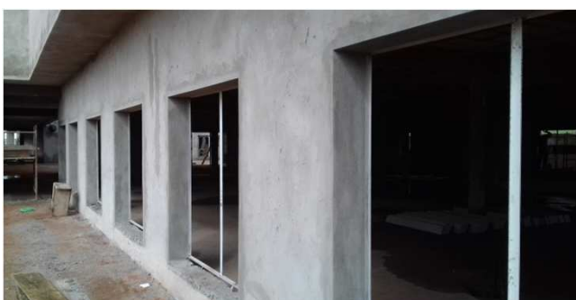
Figura 07C: janelas de 180x180cm com requadro e contramarco, na frente