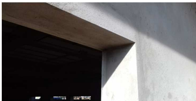
Figura 04C: requadro de vão de janela, visto por fora. Contramarco já instalado.