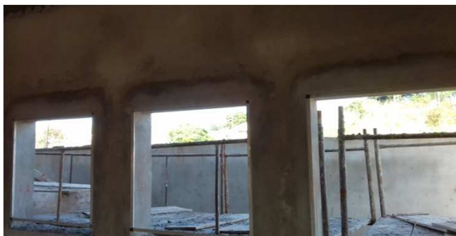
Figura 08C: janelas de 90x90cm com requadro e contramarco executados, nos fundos.