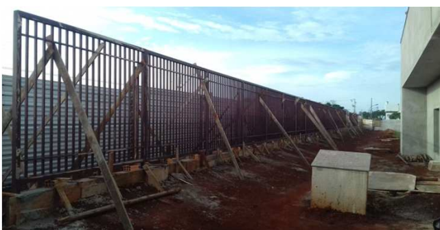
Figura 17C: vista do gradil esquerdo