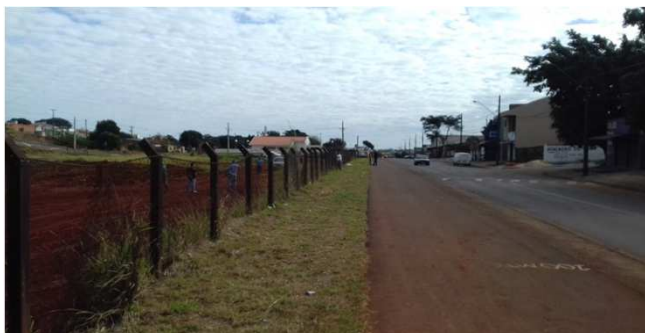
Figura 02C: cerca metálica existente antes do início da obra