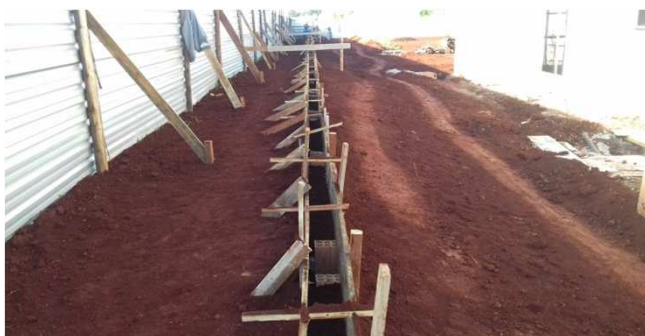
Figura 10C: Abertura de valas e execução de fôrmas, para baldrames do gradil