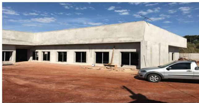
Figura 09C: janelas de 180x180cm com requadro e contramarco, na frente