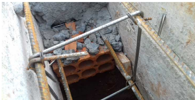
Figura 14C: detalhe da armadura das baldrames: 8mm (long) e 5mm (transv)