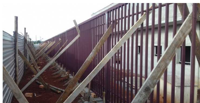
Figura 16C: gradil escorado, após concretagem dos montantes nos sulcos