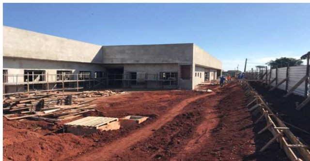
Figura 03C: local onde existia a cerca, que foi demolida. Início da execução das fôrmas das baldrames para o gradil