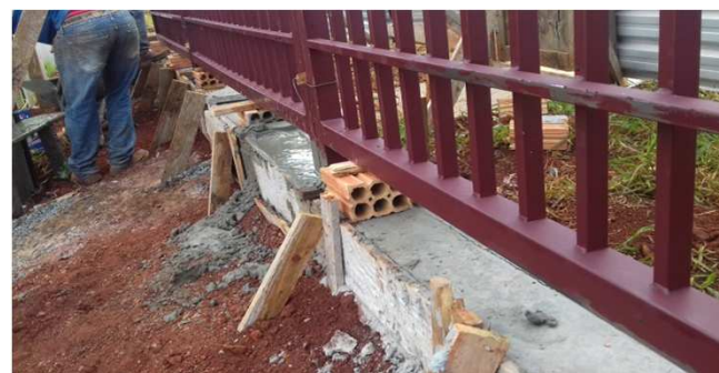
Figura 18C: detalhe do montante do gradil, chumbado na baldrame