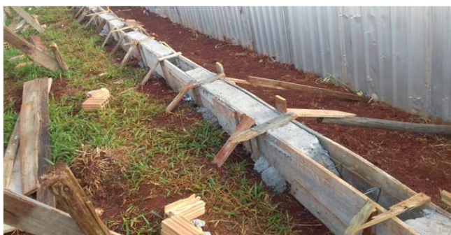
Figura 12C: início da concretagem das baldrames, os locais sem concretagem são os locais onde serão chumbados os montantes do gradil