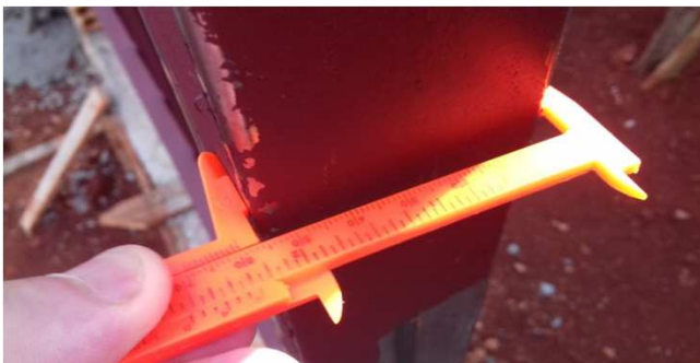
Figura 19C: aferição do montante principal do gradil