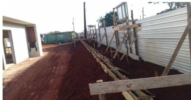
Figura 11C: Abertura de valas e execução de fôrmas, para baldrames do gradil