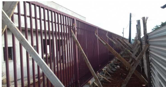
Figura 15C: gradil escorado, após concretagem dos montantes nos sulcos