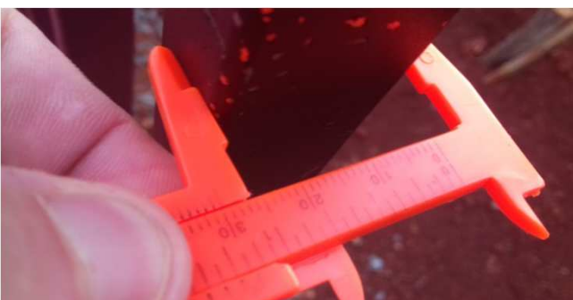
Figura 21C: aferição da travessa vertical (lado maior)