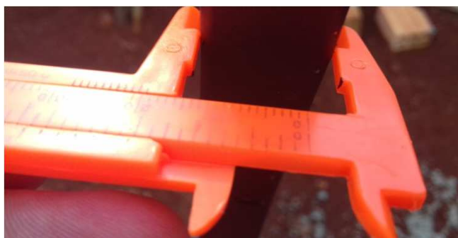
Figura 20C: aferição da travessa vertical (lado menor)