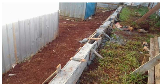
Figura 13C: início da concretagem das baldrames, os locais sem concretagem são os locais onde serão chumbados os montantes do gradil