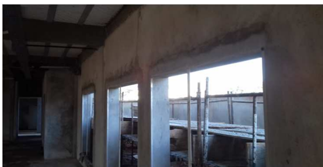
Figura 06C: janelas de 180x180cm com requadro e contramarco, nos fundos