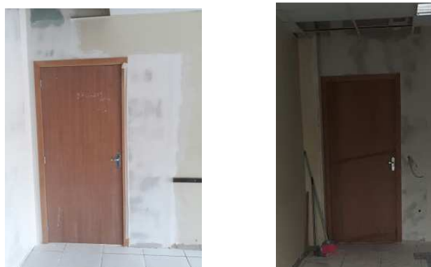
Figura 21 - Instalação da porta do banheiro e audiência