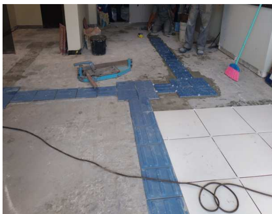
Figura 4 - Demolição de piso cerâmico.