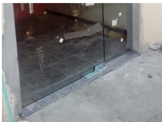
Figura 18: Execução de soleira na porta da secretaria.