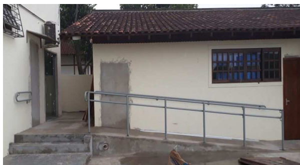
Figura 6 - Demolição de alvenaria(porta secretaria e arquivo)