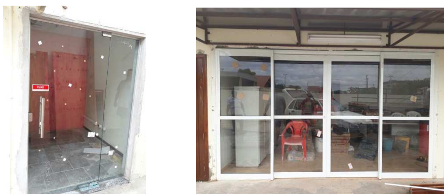
Figura 23 - Instalação da porta da secretaria em vidro temperado e porta janela em alumínio na área de vivência.