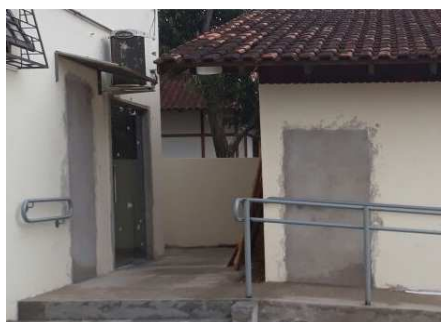
Figura 14: Alvenaria - Fechamento de vãos. Na porta da copa e porta arquivo.