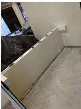
Figura 11 - Remoção do tampo de balcão de atendimento.