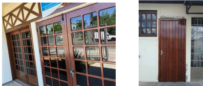
Figura 22 - Reinstalação da porta da fachada e arquivo.