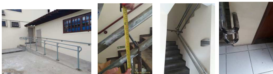
Figura 24 - Instalação parcial de guarda corpo e corrimão na rampa e em uma das escadas.