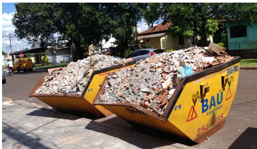
Figura 2 - Uso de caçamba para remoção de entulho.