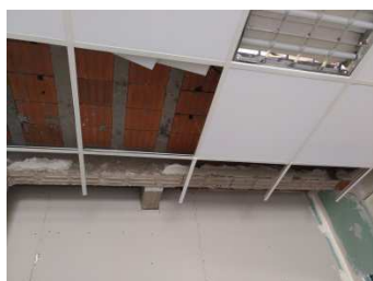
Figura 20: Adaptação do forro nas áreas de intervenções.