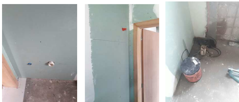
Figura 15: Gesso acartonado verde no banheiro adaptado