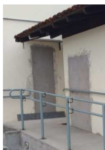
Figura 25 - Chapisco e massa única, fechamento porta da copa e arquivo.