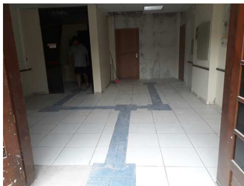
Figura 17: Piso cerâmico e piso podotátil. Falta finalização.