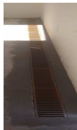
Figura 12 - Execução de alvenaria, aterro, lastro de concreto, armação, grelha e tubo de drenagem. O Corrimão deve ser corrigido.