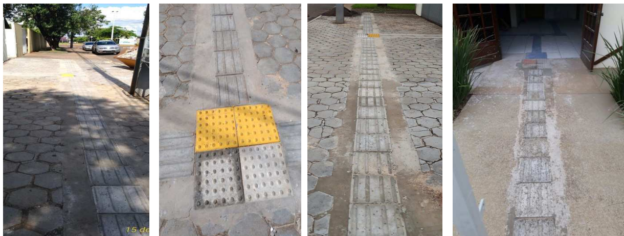
Figura 13 - Calçada em concreto e instalação de piso podotátil externo. Falta a pintura diferenciando o alerta do direcional.