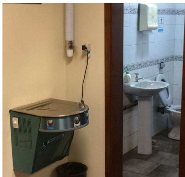
Figura 10 - Remoção de louças - Foram removidas as louças do banheiro e o bebedouro. Remoção de torneira, papeleiras, válvula, saboneteira e cabide.