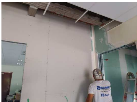
Figura 16: Gesso acartonado duplo ainda não finalizado.