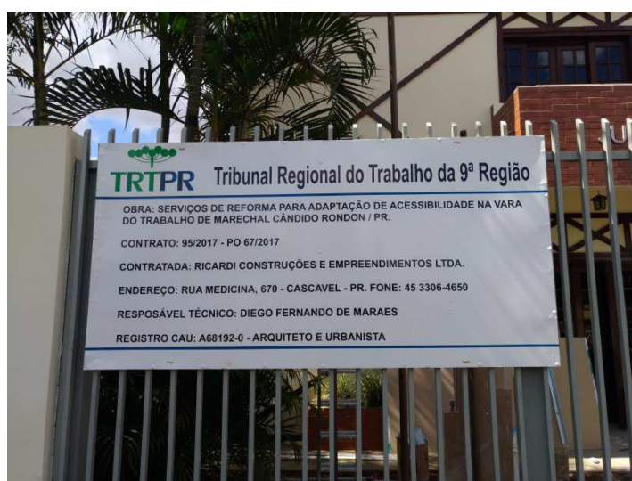
Figura 1 - Instalação de placa de obra.