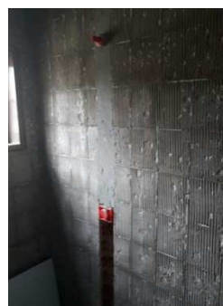
Figura 7 - Remoção de azulejos