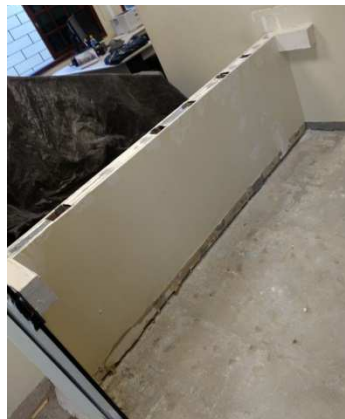
Figura 5 - Reforma balcão de atendimento.