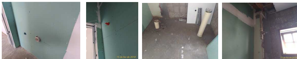
Figura 19: Instalações hidrossanitárias do banheiro adaptado.