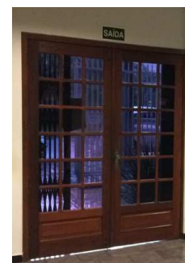
Figura 9 - Retirada esquadrias de madeira (porta audiência, banheiro, arquivo, janela secretaria e porta copa e porta com duas folhas fachada-invertida)