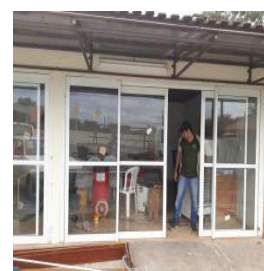
Figura 8 - Remoção de esquadrias metálicas (pantográfica e porta janela copa)