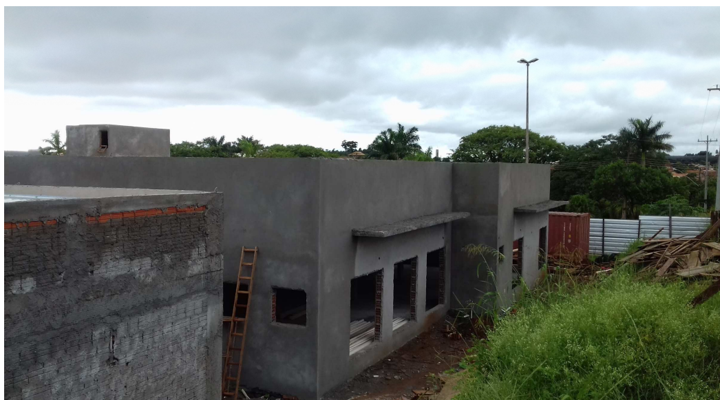
visão geral da obra

Esta 10ª medição da planilha contratual atingiu o valor de R$ 47.435,92 (quarenta e sete mil, quatrocentos e trinta e cinco reais e noventa e dois centavos), que corresponde a um percentual de 2,82% para a medição e 38,96% acumulado. Estava previsto, no cronograma atualizado, um acumulado de 55,83%, isto é, a obra encontra-se com um atraso de 16,87%. A contratada apresentou cronograma readequando os serviços de forma a manter o prazo final da obra inalterado.