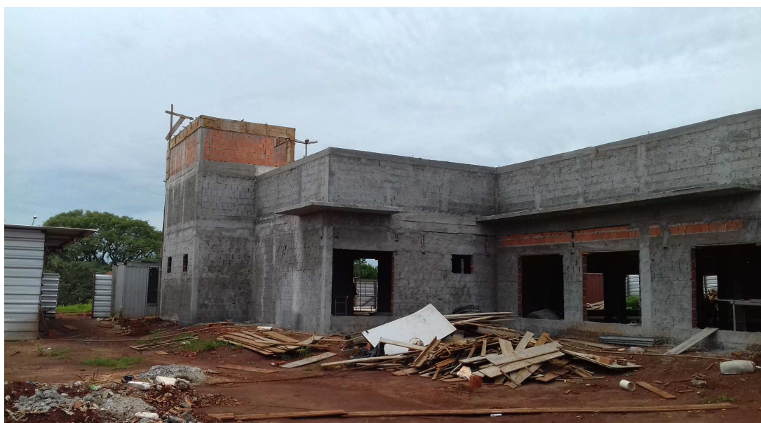
Imagem: visão geral da obra

Esta 9ª medição da planilha contratual atingiu o valor de R$ 156.810,25 (cento e cinquenta e seis mil, oitocentos e dez e vinte e cinco centavos), que corresponde a um percentual de 9,34% para a medição e 36,14% acumulado. Estava previsto, no cronograma atualizado, um acumulado de 43,43%, isto é, a obra encontra-se com um atraso de 7,29%. A contratada apresentou cronograma readequando os serviços de forma a manter o prazo final da obra inalterado.