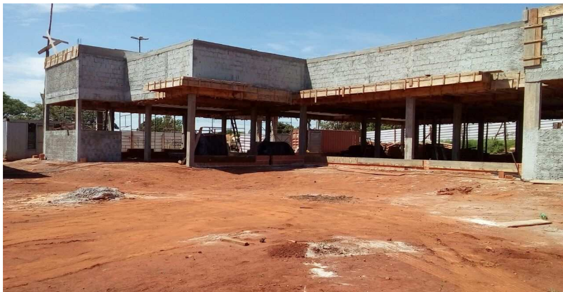
Imagem: visão geral da obra

Esta 8ª medição da planilha contratual atingiu o valor de R$ 138.417,89 (cento e trinta e oito mil, quatrocentos e dezessete reais e oitenta e nove centavos), que corresponde a um percentual de 8,24% para a medição e 26,80% acumulado. Estava previsto, no cronograma atualizado, um acumulado de 37,46%, isto é, a obra encontra-se com um atraso de 10,66%. A contratada apresentou cronograma readequando os serviços de forma a manter o prazo final da obra inalterado.