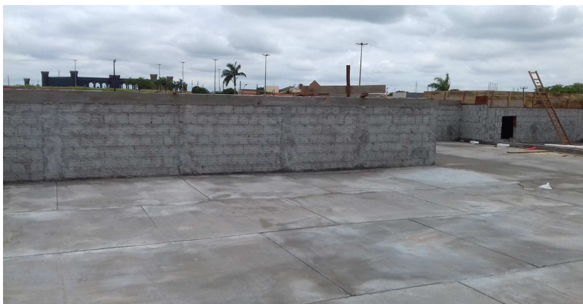
Imagem: panos de laje após a recuperação executada

A contratada realizou a recuperação das lajes que, após a concretagem (na etapa anterior) apresentaram aspecto rústico e sem o devido sarrafeamento. Os panos de laje foram regularizados com uso de argamassa de traço forte e os trechos com capeamento insuficiente foram resolvidos com aplicação de uma ponte de aderência (Viapoxi Adesivo Gel) e graute (Graute Plus Quarzolit). O resultado alcançado foi plenamente satisfatório, o que possibilita à contratada passar a se preocupar com a produtividade dos demais serviços em andamento.