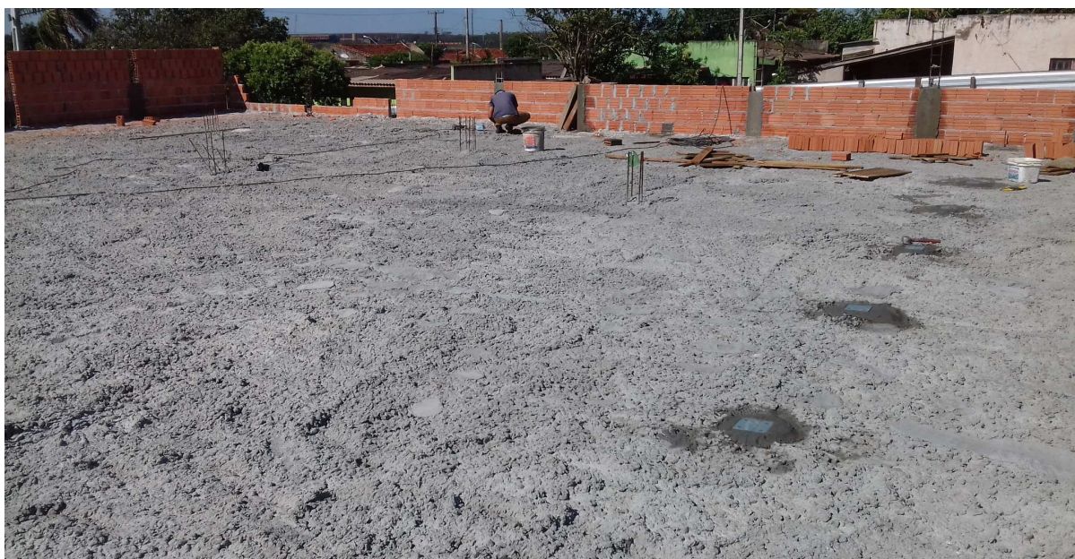
Imagem: Aspecto rústico da laje após concretagem e cura. Levanta suspeitas quanto ao lançamento do concreto após o fim de pega (possibilidade de desagregação entre argamassa e brita).

Esta 7ª medição da planilha contratual atingiu o valor de R$ 34.102,06 (trinta e quatro mil, cento e dois reais e seis centavos), que corresponde a um percentual de 2,03% para a medição e 18,56% acumulado. Estava previsto, no cronograma atualizado, um acumulado de 32,06%, isto é, a obra encontra-se com um atraso de 13,50%. A contratada apresentou cronograma readequando os serviços de forma a manter o prazo final da obra inalterado.