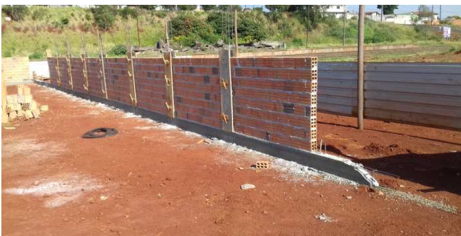
Figura 14: Muro executado parcialmente, na lateral direita