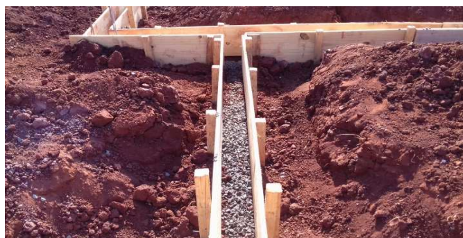
Figura 10: Forma montada e lastro de brita lançado, aguardando armadura e concreto