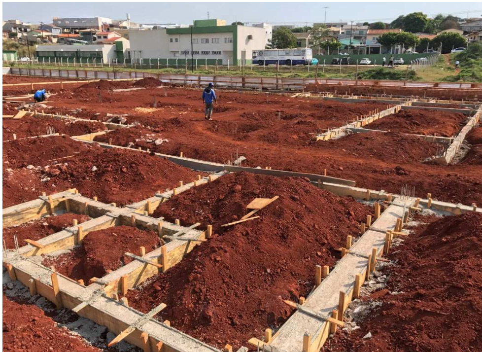
Vista geral da obra

Considerando a instituição da Comissão de Recebimento e Fiscalização da CONSTRUÇÃO DO FÓRUM TRABALHISTA DE APUCARANA, objeto do Contrato Nº 34/2017, CP 04/2016, com efeitos através do despacho exarado pela Sra. Ordenadora da Despesa, os componentes abaixo elencados apresentam o relatório fotográfico das vistorias realizadas, que tiveram como objetivo a fiscalização dos serviços executados pela Contratada, no período de 26/08/2017 até 25/09/2017 (terceira etapa).