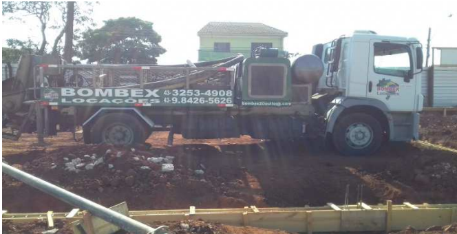
Figura 11: Bomba utilizada na concretagem das baldrame