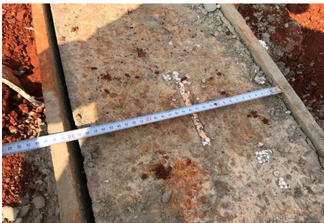
Figura 4: Detalhe de uma viga baldrame dupla (junta estrutural)