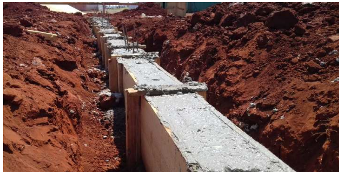
Figura 5: Viga baldrame no dia da concretagem (pós concretagem)