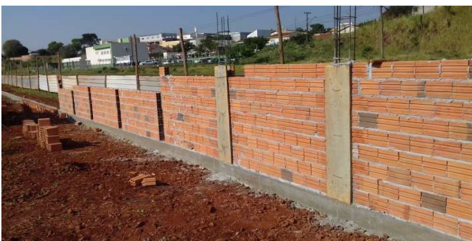
Figura 12: Muro de fechamento do terreno, executado parcialmente nos fundos