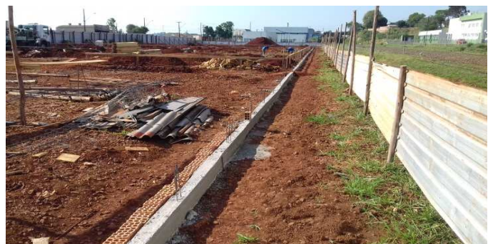
Figura 13: Viga baldrame do muro de fechamento, antes do início do levantamento do muro