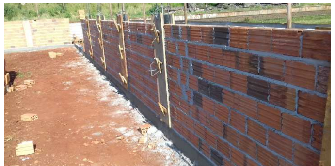
Figura 15: Muro executado parcialmente, na lateral direita