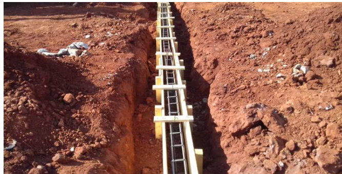
Figura 6: Viga baldrame com forma e ferragem montada, antes da concretagem