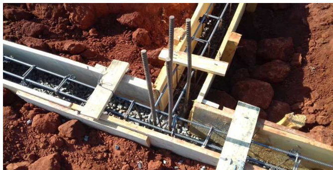
Figura 7: Detalhe de forma, ferragem e lastro de brita no fundo da baldrame, antes de concretar