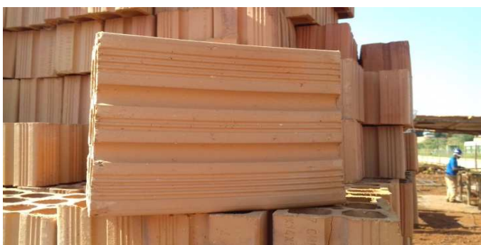
Figura 18: Tijolo utilizado. No detalhe a posição de assentamento (em pé, para apresentar espessura de 9cm).