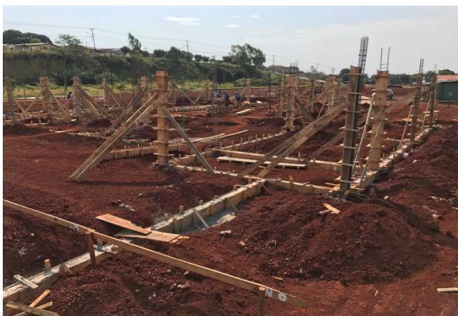
Figura 2: Baldrames do fórum após a concretagem