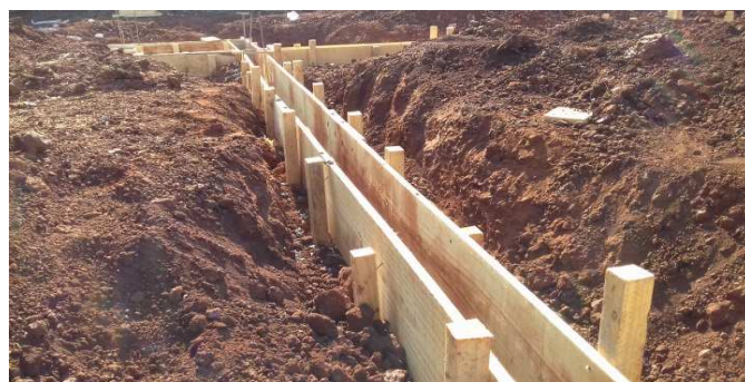
Figura 9: Detalhe de forma montada antes da instalação da armadura e concretagem