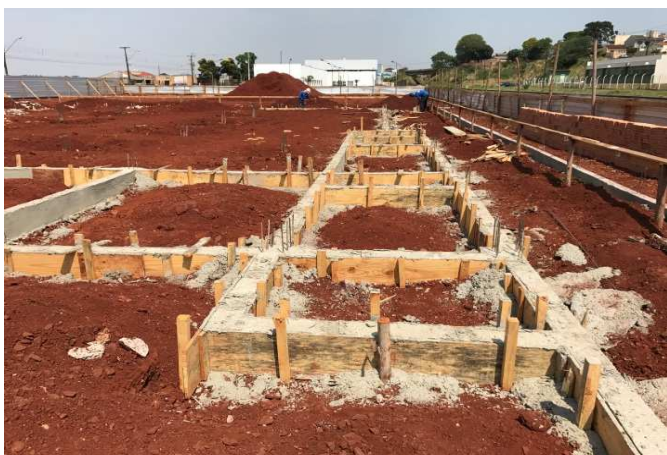
Figura 1: Baldrames do fórum após a concretagem