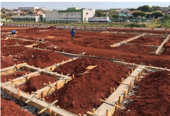
Figura 3: Baldrames do fórum após a concretagem